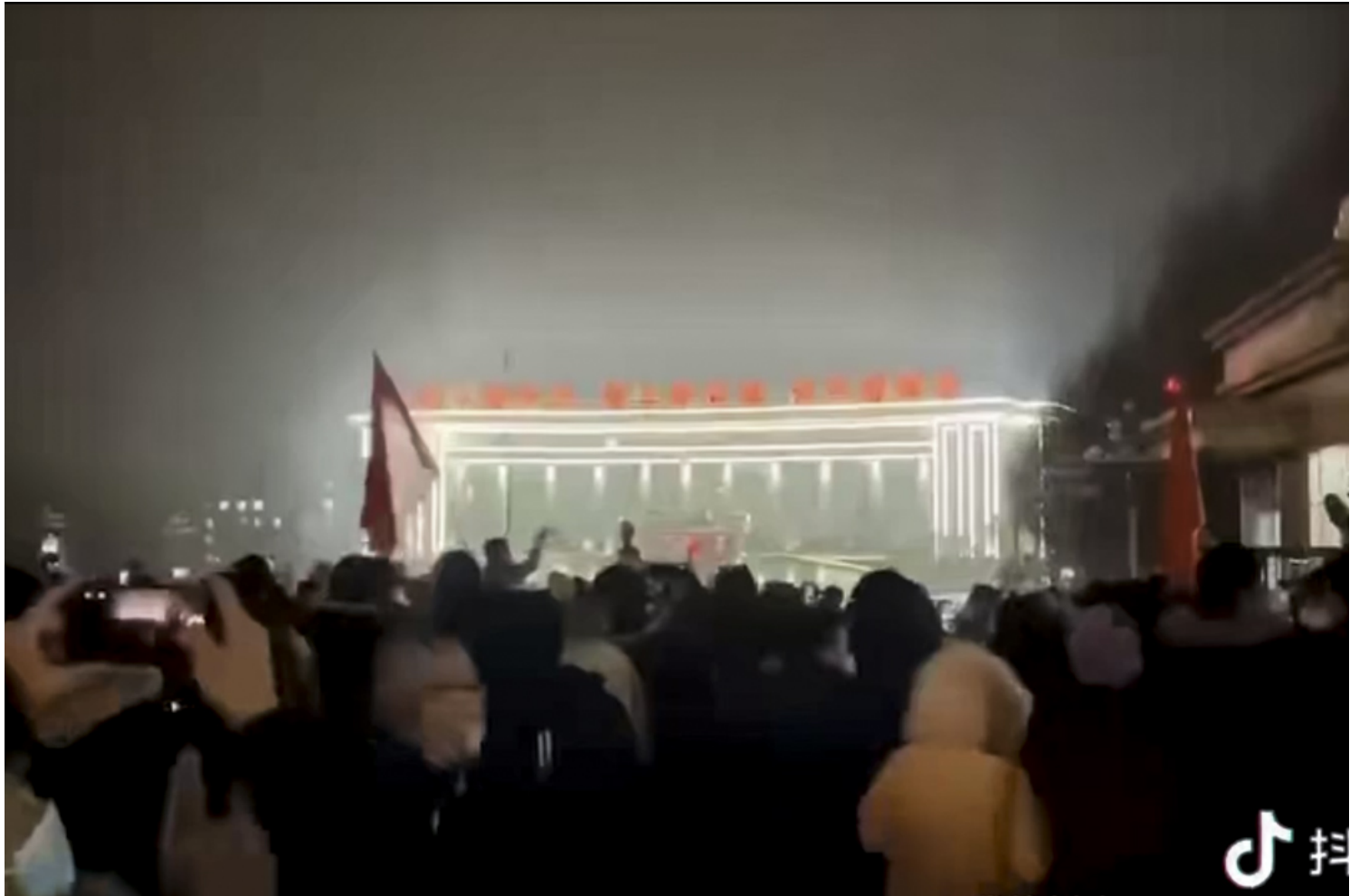
2022年11月25日晚上，微信、抖音等多个短视频平台流传出乌鲁木齐市民集体走上街头要求“解封”的视频。影片截图

深夜，乌鲁木齐民众进入市政府大楼的视频在社交媒体流传。亦有视频显示大批武警面对民众，有民众高声质问，“人民警察为人民，你们镇压人民”，“你们是谁的孩子，又是谁的爸爸，你们良心不疼吗？今天死了多少人？”