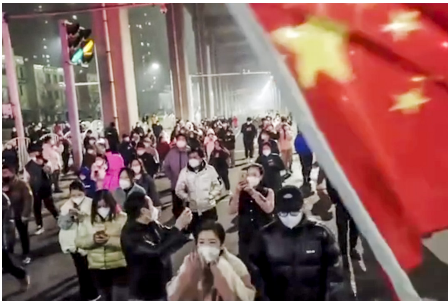
2022年11月25日晚上，微信、抖音等多个短视频平台流传出乌鲁木齐市市民集体走上街头要求“解封”的视频。影片截图

23日，一位九旬老人在方舱隔离的视频在网上热传。因其行动不便，工作人员将塑料板凳横向套在另一塑料桶上，作为简易马桶，并摆在其床尾的过道上。老人在视频中激动且颤颤巍巍地表示，“我就是死也不到医院。”该行为被大量转发和谩骂后，老人住址所属的沙坪坝区土湾街道办事处发布情况说明，称已在当晚将老人转送至沙坪坝区中医院接受治疗。