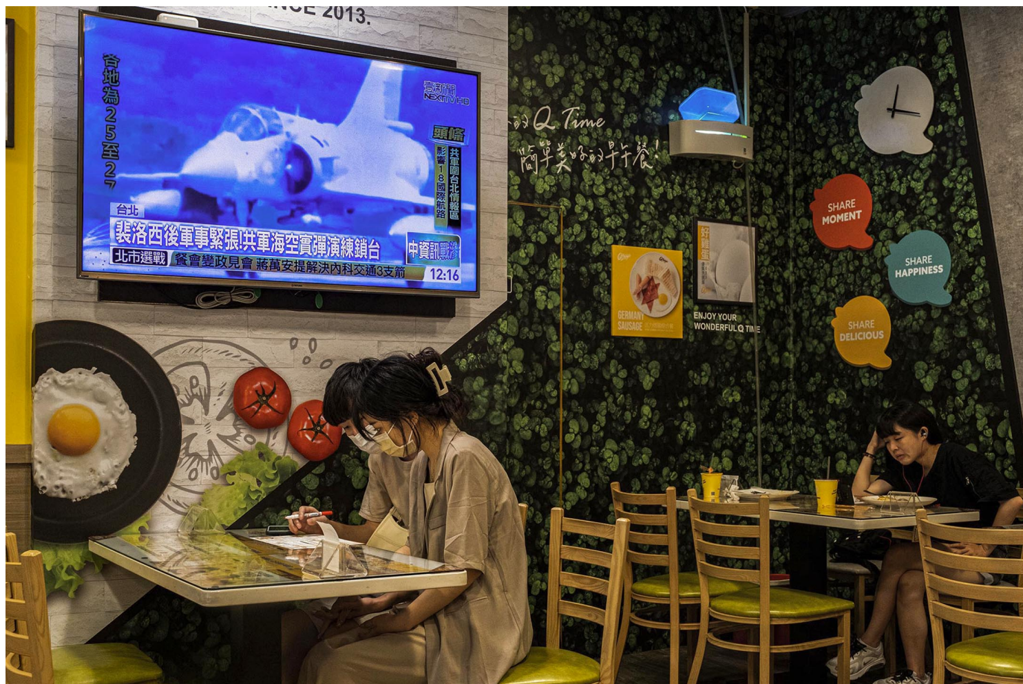
2022年8月4日，台北的一间早餐店，电视新闻播放关于中国在台湾周边进行军事演习的新闻。

此一运动著眼唤醒公民意识，强化台湾捍卫民主的韧性。否定“不投降承诺书”之价值、轻率将之贬抑为选举操作，或认为唤起人民安全意识是在“鼓动战争”、“挑衅敌人”、或“凌驾军人专业”者，其实并未理解“不投降承诺书”签署运动真正的意义。