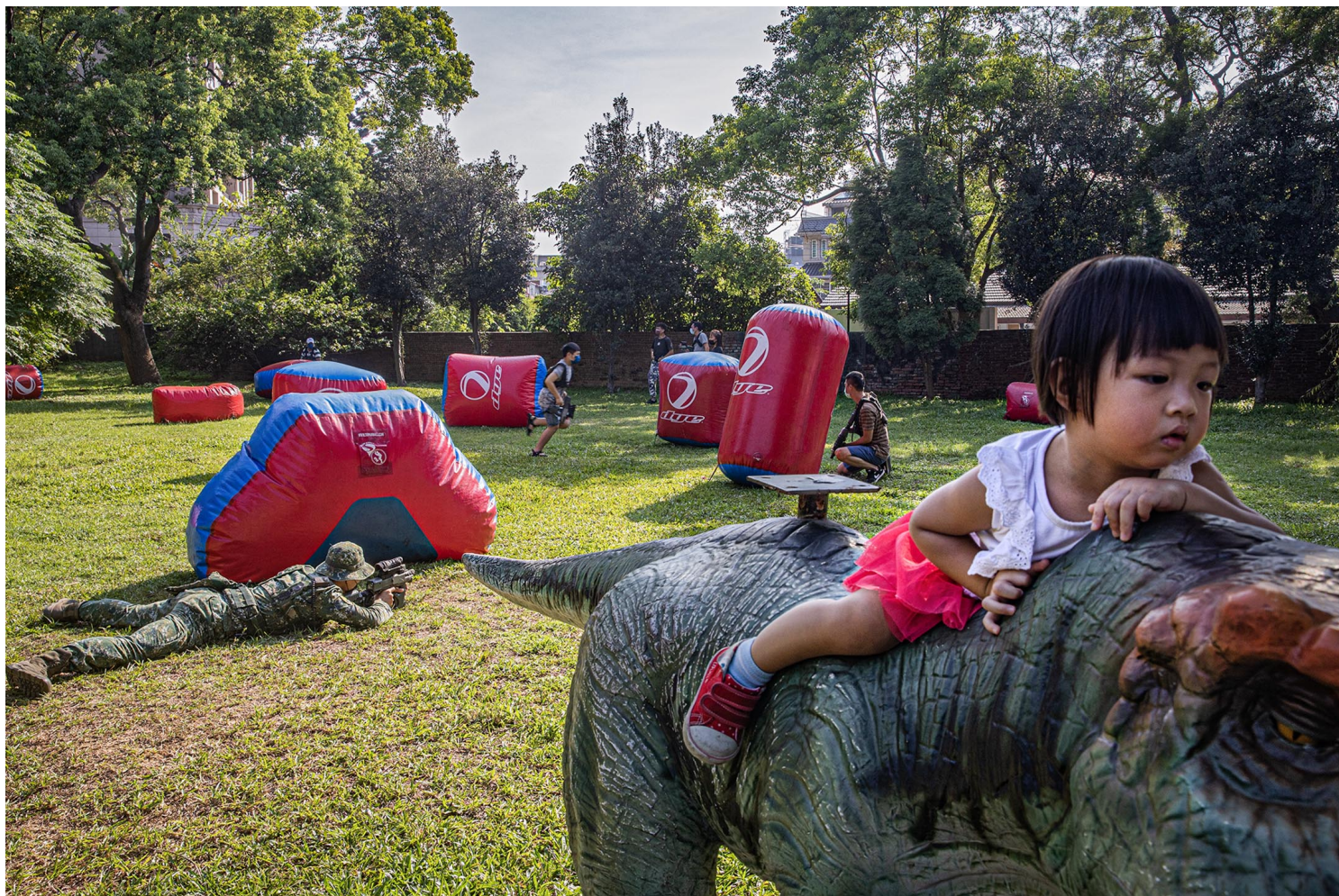
2022年9月17日，为强化全民国防教育，国防部在桃园马祖文创园区举办“进击的迷彩”活动。

现代战争不是只在战场之上，也不是起始于战时。由此观点，中国侵略台湾主权的行动，早就是“无烟硝的战争”。