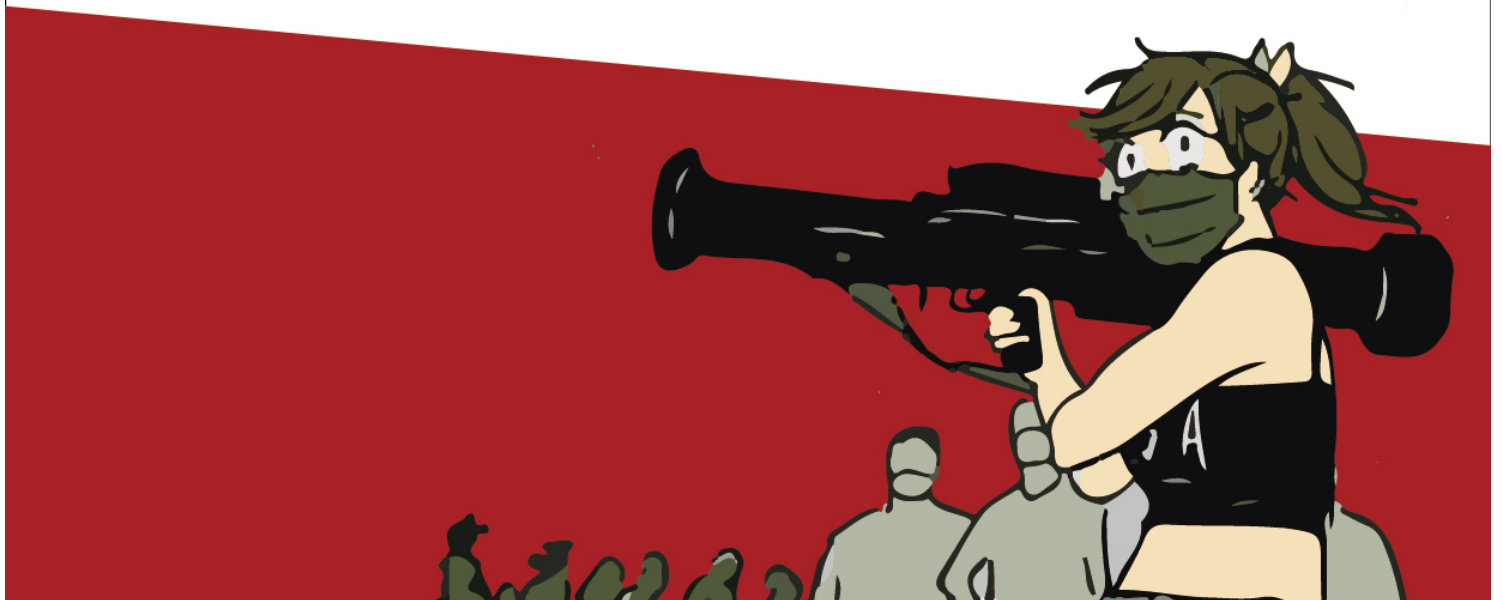
不投降承诺书。