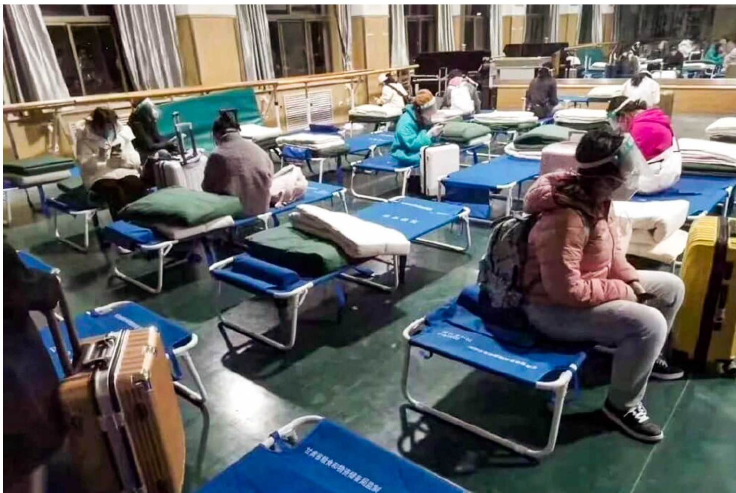
甘肃兰州文理学院爆发疫情，列为高风险区遭封校，学生在教室隔离。

44日的下午7点，都在封校。值得一提的是，兰州及南乡区封校时间，比区十八一十八日外出的。