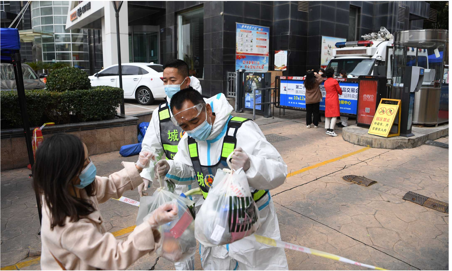
2021年10月20日，甘肃省兰州，因疫情被封锁期间，工作人员在一个社区入口处安排食品。

11月1日，网络消息指，兰州一名三岁幼童突发晕倒，其母煤气中毒，其父不断向急救中心及社区求助，却因地处“高风险区”迟迟未有回应，幼童最终因就医不及时不幸离世。当晚，兰州市七里河有关部门发布通报，称一户居民液化气灶使用不当，2人一氧化碳中毒，送医后儿童抢救无效死亡，另1人生命体征平稳。