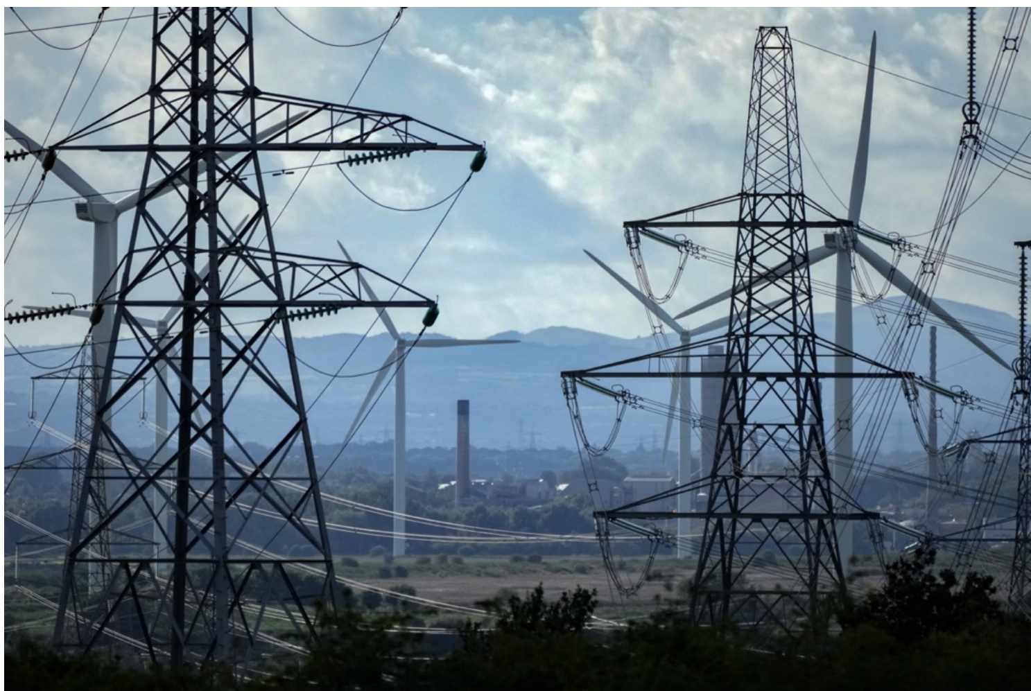
英国利物浦市郊小镇朗科恩（Runcorn），草坪上高压电塔与风力发电机林立。

事实上，自由市场有效令企业控制成本，也会促进竞争，但市场价格却不必然反映成本。在传统经济理论中，自由市场只由供应及需求决定价格，而英国电力市场就正好说明这个情况。