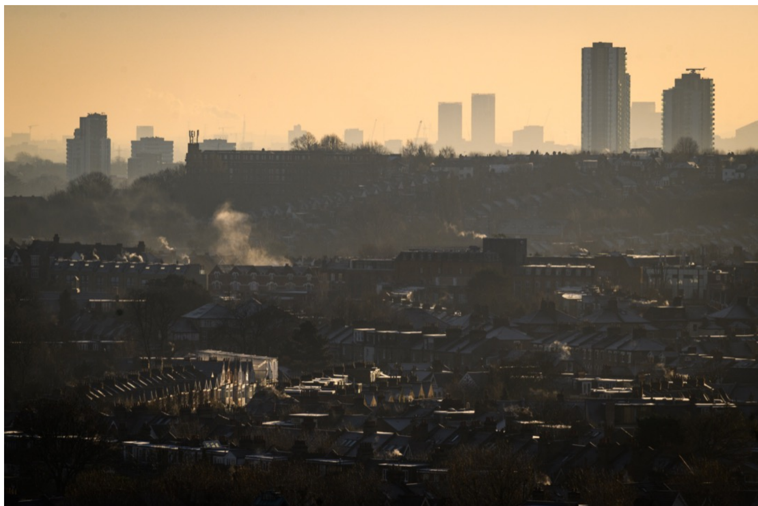
2022年1月6日，英国伦敦，水蒸气从排屋的中央暖气系统的烟囱排出。英国当前的头号难题是高通胀引发的生活成本危机。其中最主要的部分是能源价格飙升。

而对Stone而言，他比较怀念单一电力公司的简单：“在新加坡生活，电力公司的服务没有那么复杂，会主动为客户解决问题。在美国生活，最大的能源支出——暖气，也包括在租金内，不用烦恼太多。但现在因为（英国的）电费争拗，就等电力公司回复，一个星期又一个星期，很浪费时间。”