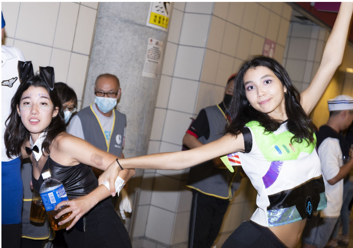
香港國際七人欖球賽的觀眾。