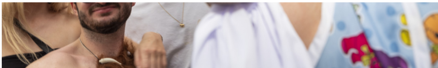
香港國際七人欖球賽的觀眾。