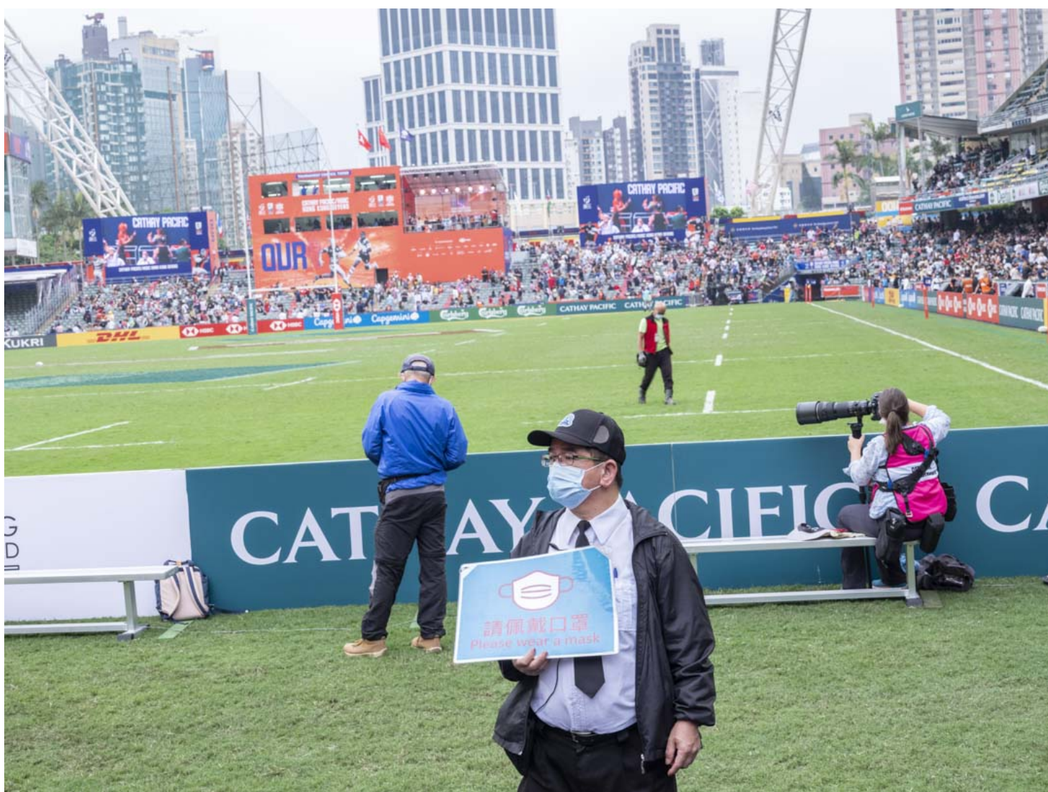
香港國際七人欖球賽的觀眾。