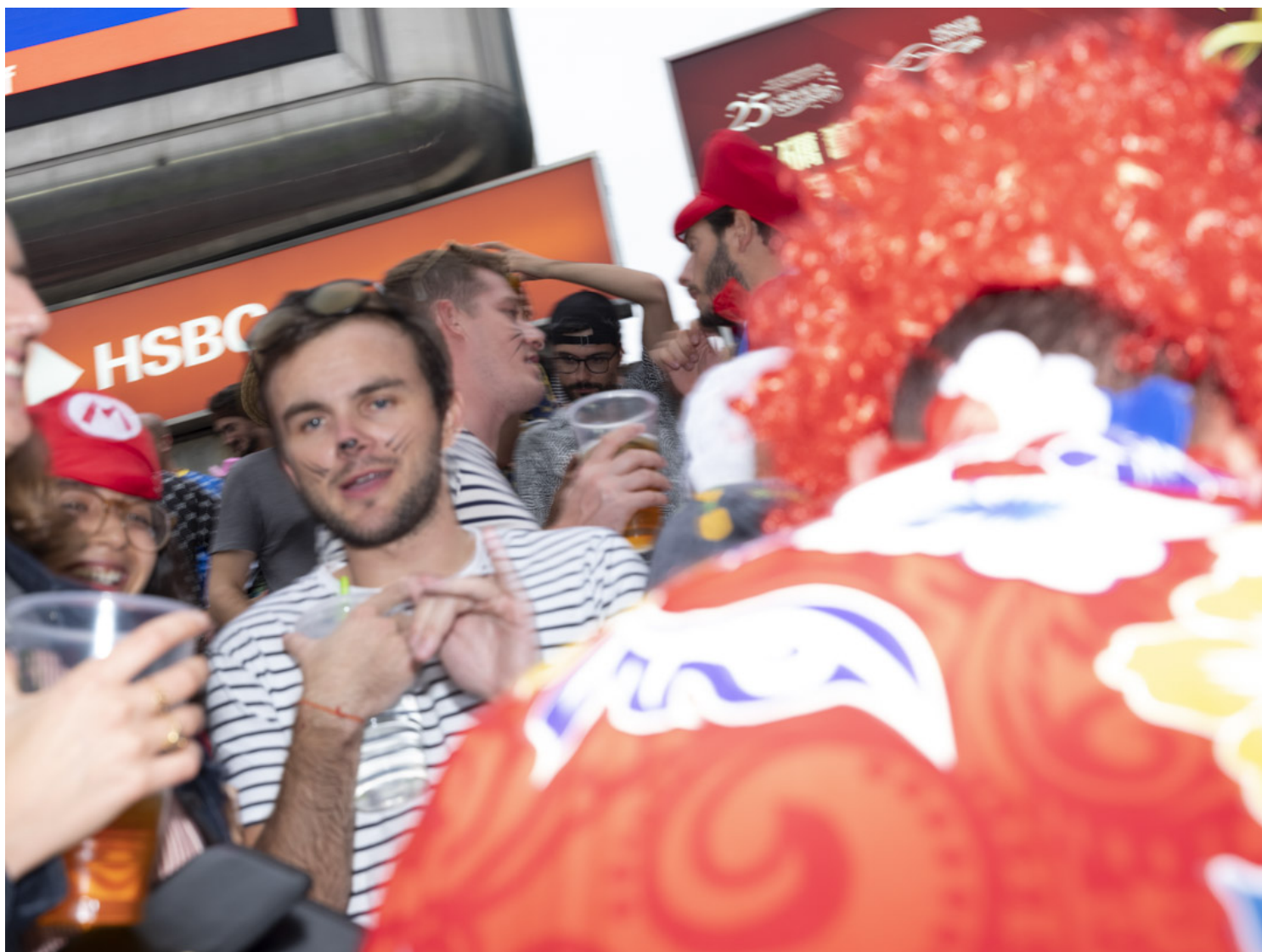
香港國際七人欖球賽的觀眾。