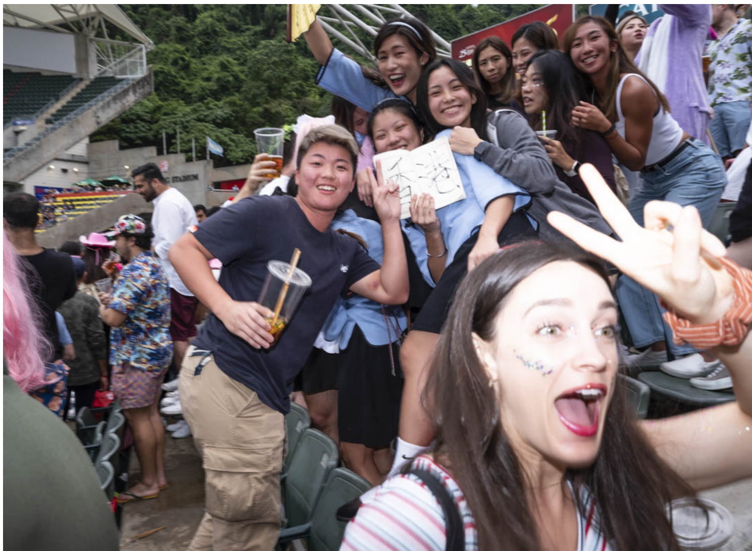
香港國際七人欖球賽的觀眾。