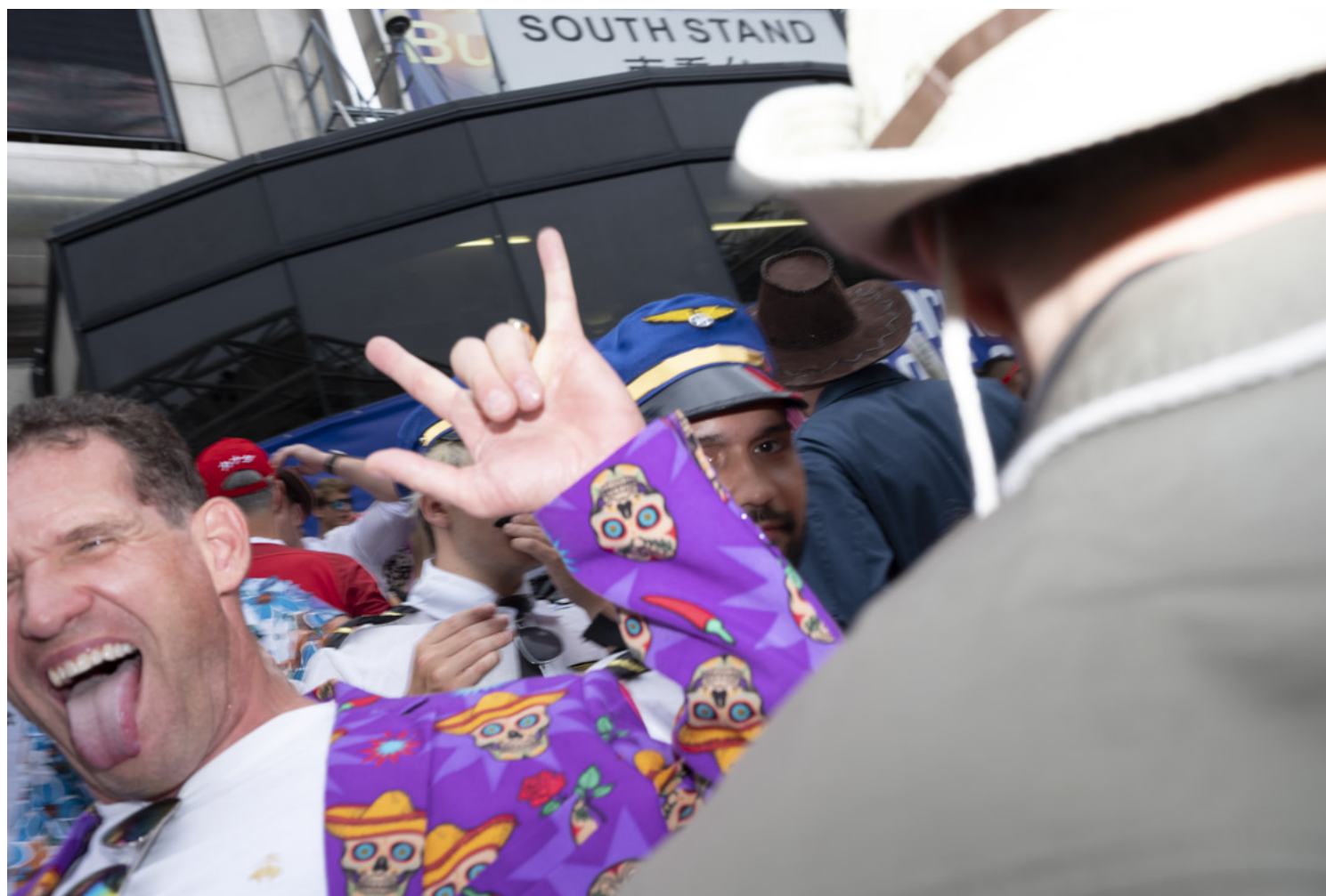
香港國際七人欖球賽的觀眾。