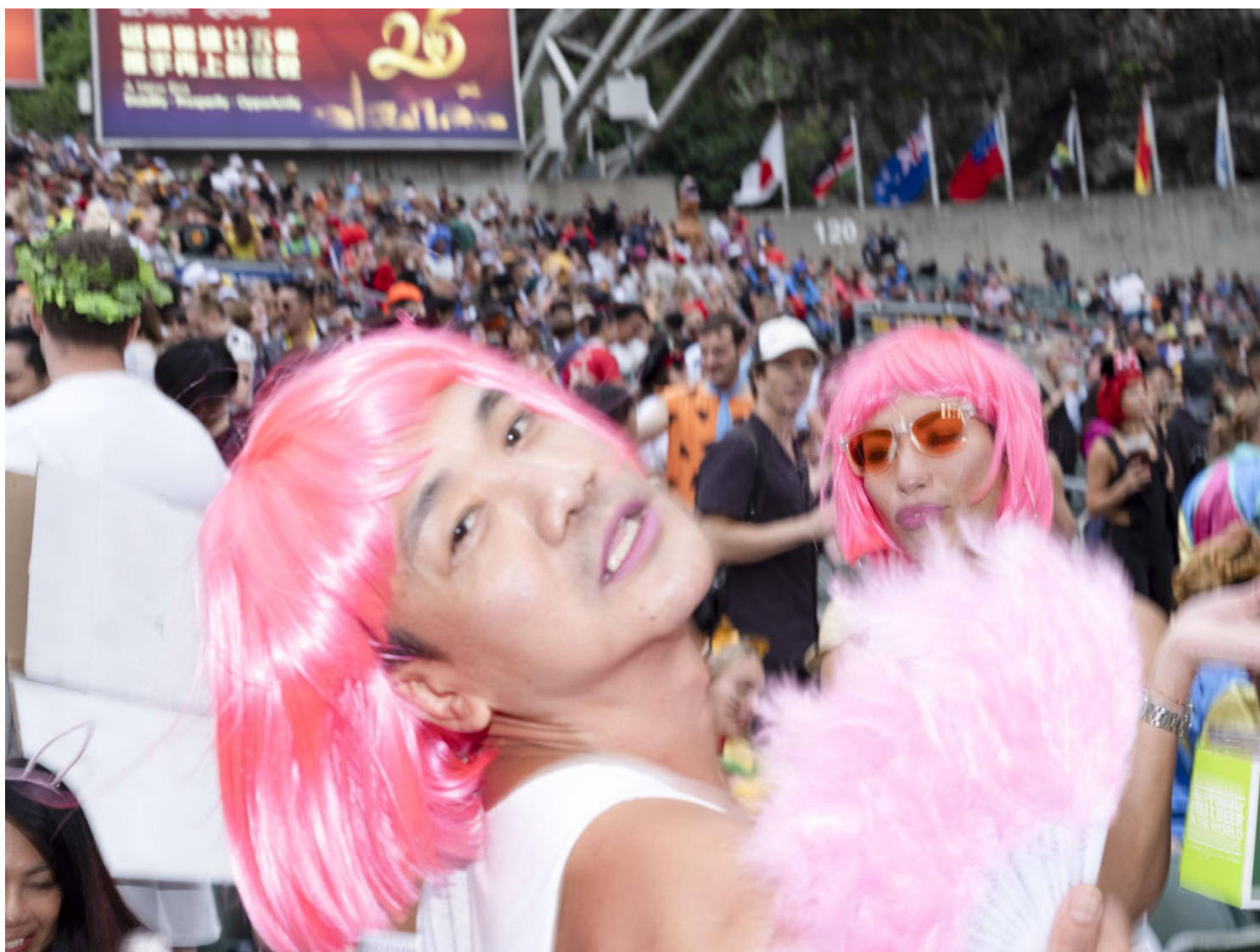
香港國際七人欖球賽的觀眾。