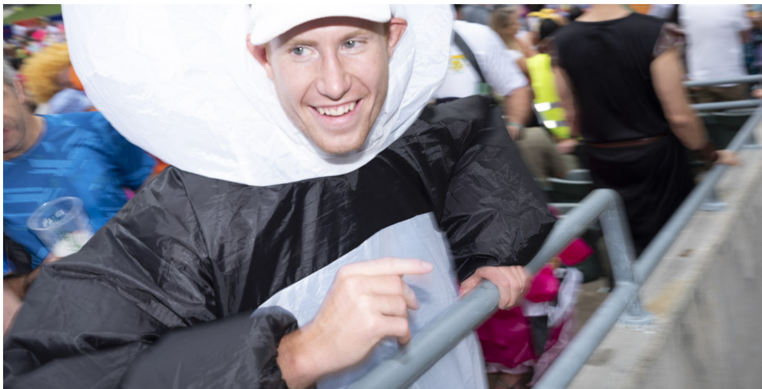
香港國際七人欖球賽的觀眾。