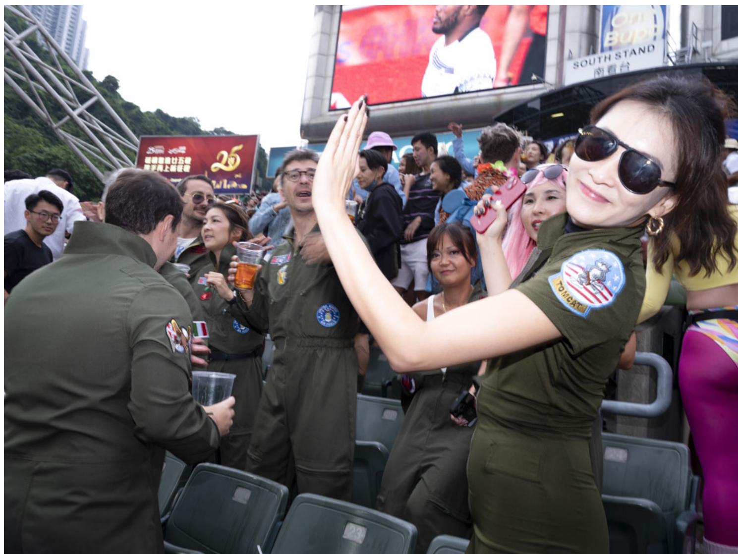
香港國際七人欖球賽的觀眾。