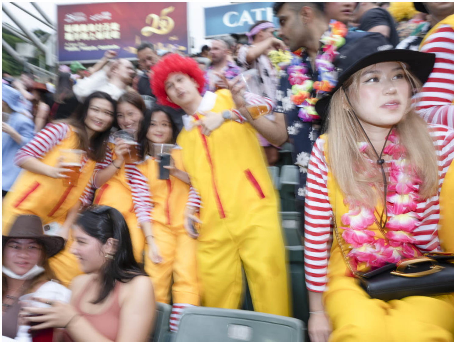
香港國際七人欖球賽的觀眾。