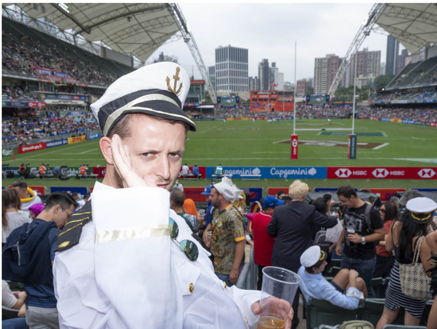
香港國際七人欖球賽的觀眾。