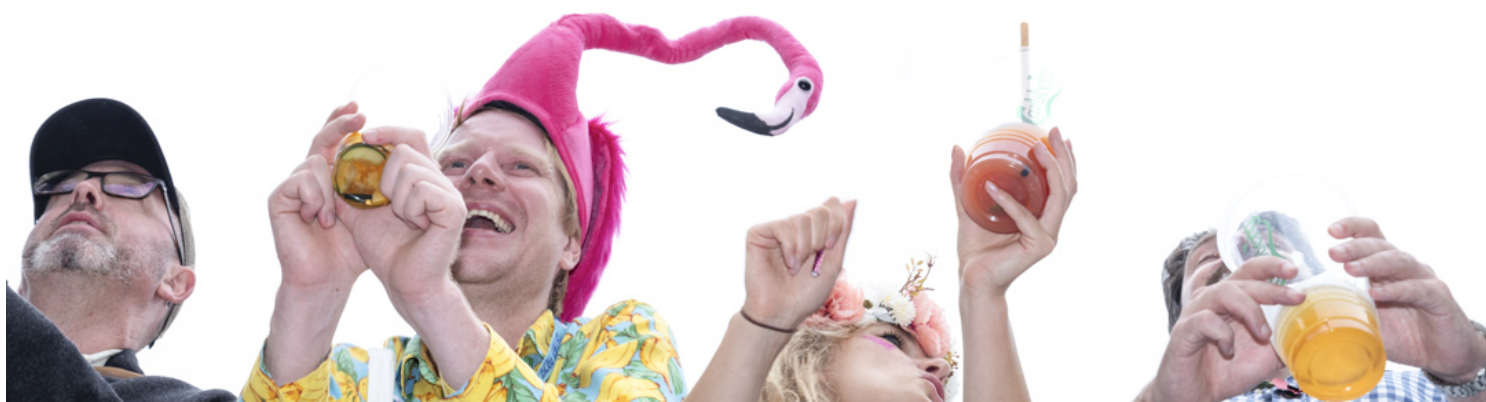
香港國際七人欖球賽的觀眾。