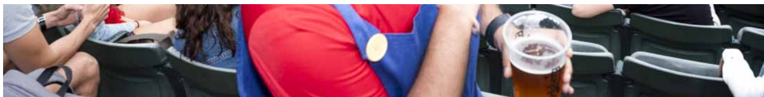
香港國際七人欖球賽的觀眾。