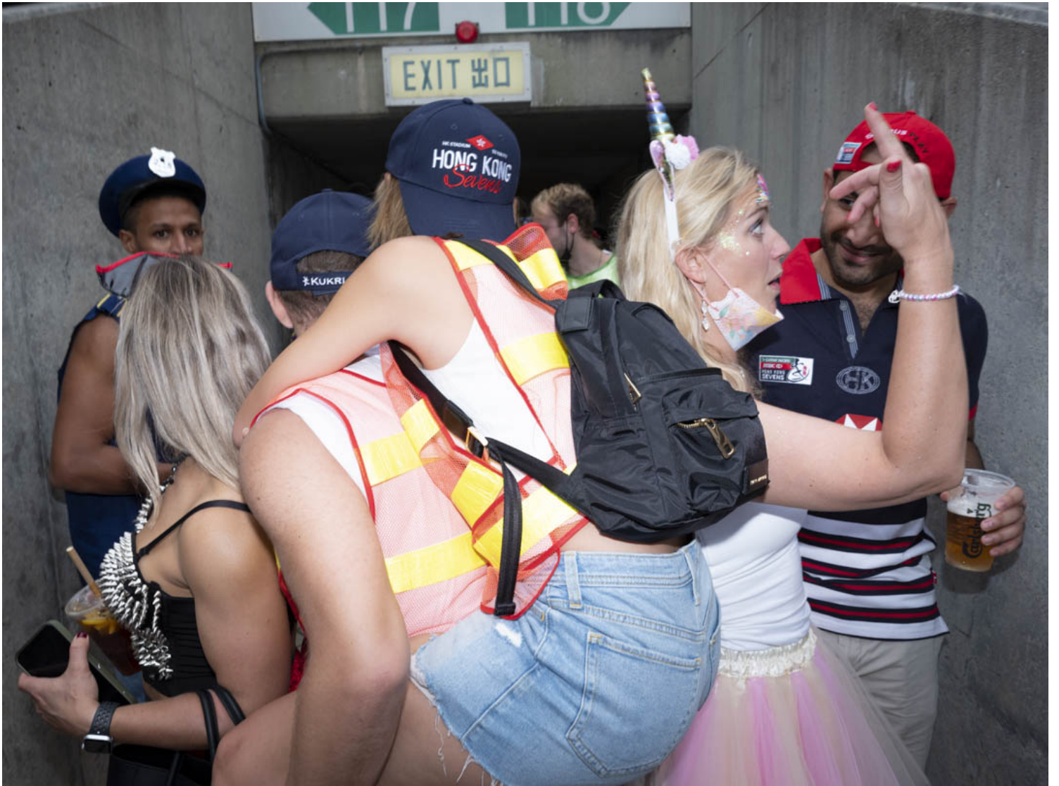
香港國際七人欖球賽的觀眾。