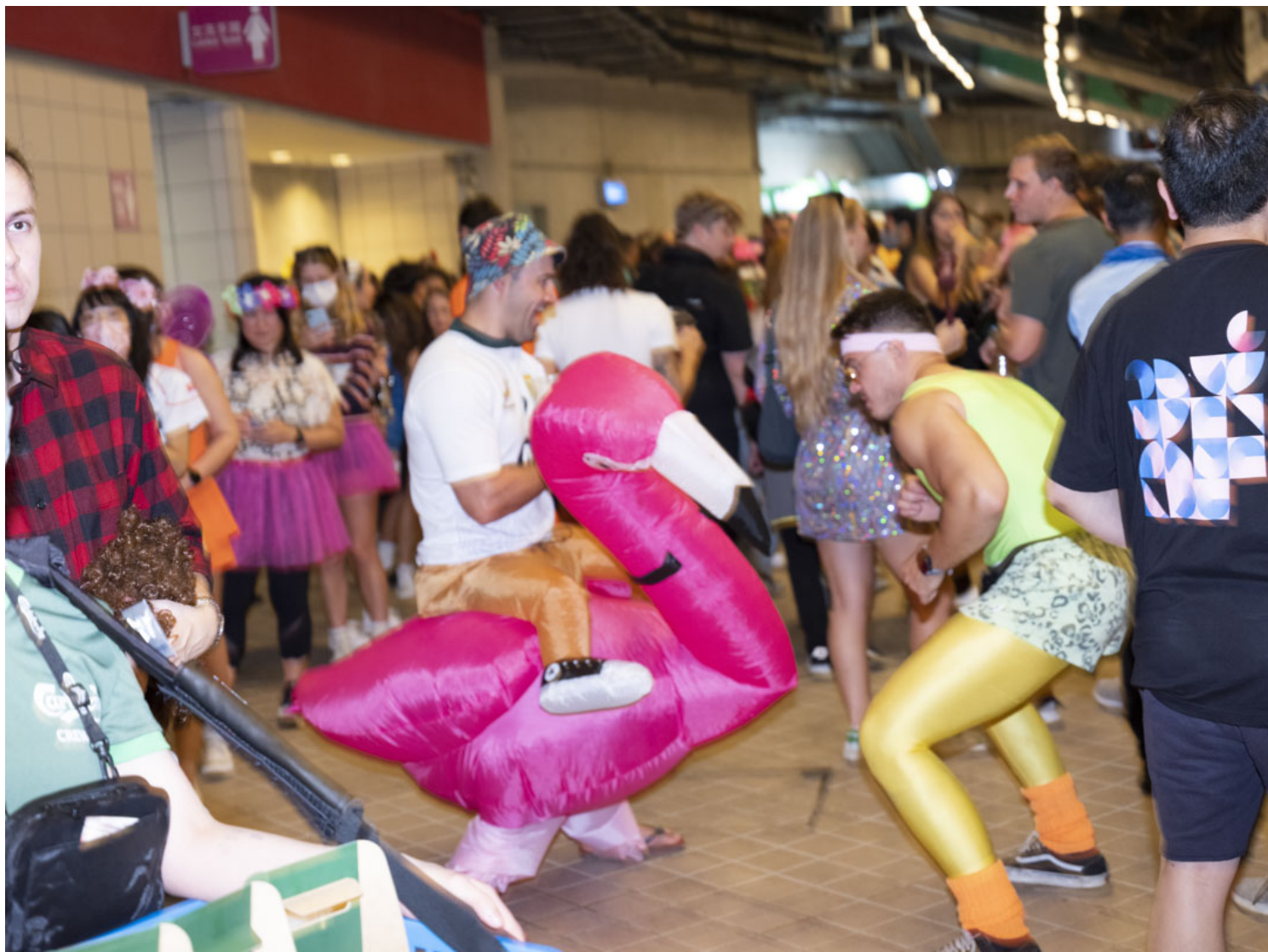
香港國際七人欖球賽的觀眾。