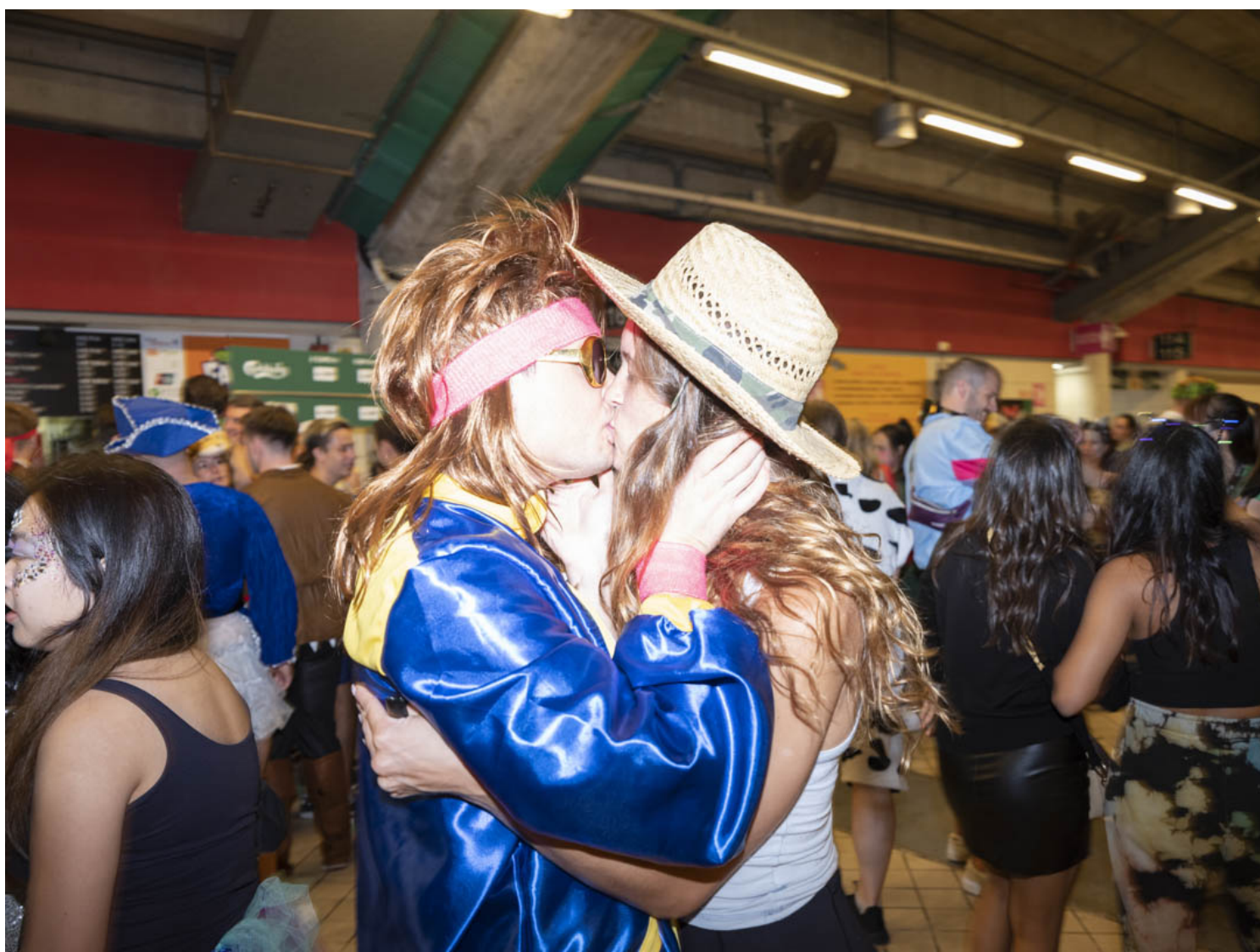
香港國際七人欖球賽的觀眾。