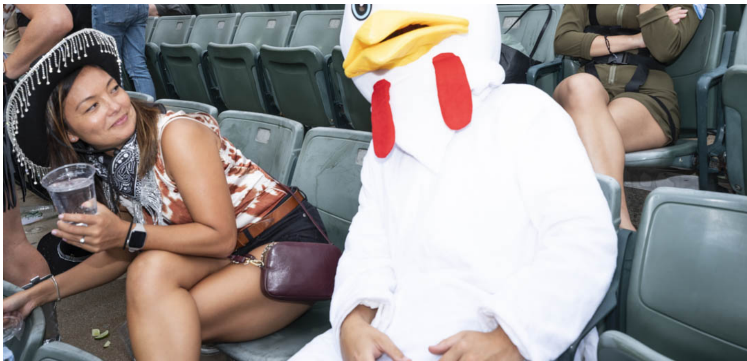
香港國際七人欖球賽的觀眾。