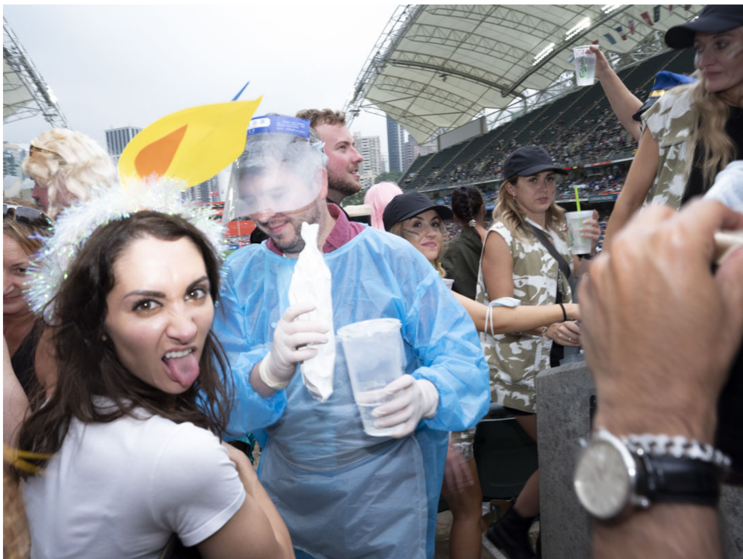
香港國際七人欖球賽的觀眾。