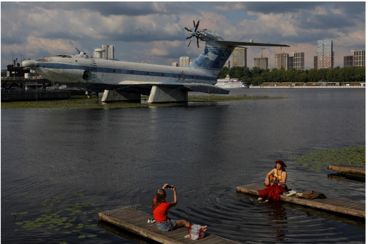
2022年7月25日，俄罗斯莫斯科，两名女子在莫斯科运河畔唱歌，后面的俄罗斯海军历史博物馆摆放著一辆苏联时期的A-90 Orlyonok军用翼地效应机。

“中亚人？哦。欧洲不也有类似的问题吗，移民问题”，L博士轻松地说，“中亚人和我们也差不多的，他们都说俄语。这些国家就是当时的分离主义者……我有时候觉得挺后悔我们当时没有把新疆留下来的，而是给了你们中国。当然，这也许也不是坏事，不然今天就又多了一个分离主义的前苏联共和国。”