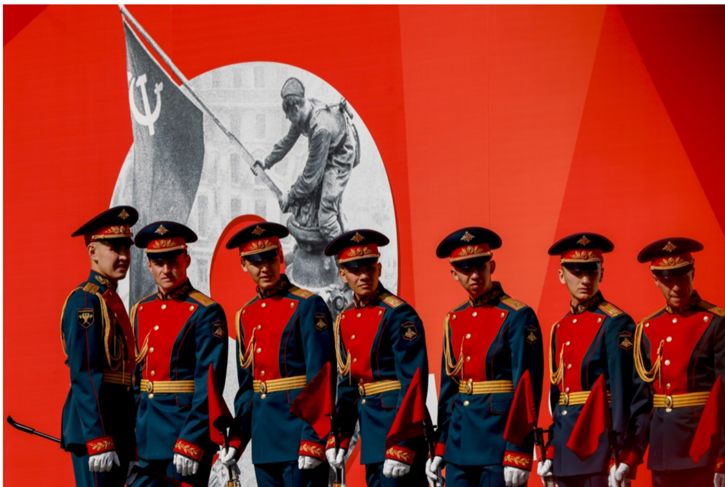
2022年5月7日，俄罗斯莫斯科，士兵在红场为即将举行的胜利日阅兵仪式进行排练。

让生活继续平静下去，当作战争没有发生，要付出什么代价？许多人认为未来的变局会来自于俄罗斯被迫开展总动员，这意味着打破“沉默契约”，人们不再有别的选择，只能站在反对普京的一边。但也许，为了避免这一场面，为了避免想象中的总动员和战时状态，普京还有许多选项——甚至，这其中包括了孤注一掷地在战场上搬出大规模杀伤性武器的选项。