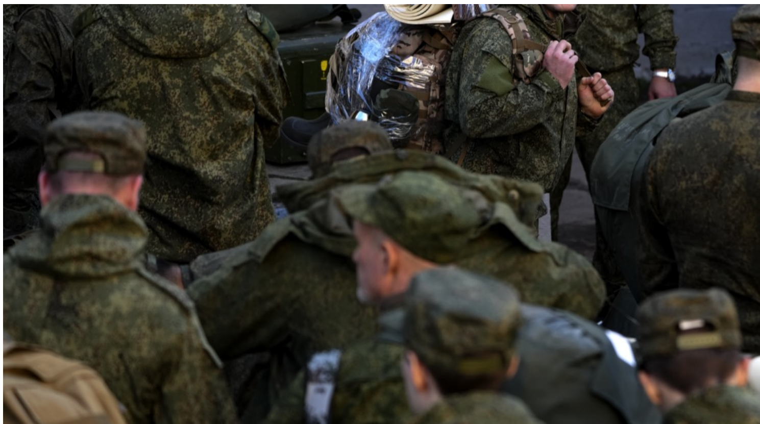
2022年10月10日，俄罗斯莫斯科，部分军事动员令下征召的士兵预备被派往战场。

家乡在西伯利亚一座小城市的V，如今和一群打零工的青年一起住在彼得堡市中心一座上世纪初建成的公寓里。他们要么送外卖，要么在街上贴广告。V做着餐厅厨师的工作，没有签正式合同，多做多得。一个月税后能入账6万卢布，在彼得堡的同龄人中算是不错的水平。