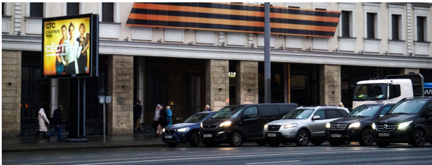
2022年3月29日，俄罗斯莫斯科，塔巴科夫剧院外墙悬挂著象征支持俄罗斯入侵乌克兰的“Z”标志。

城市的物价也没太大变化。制裁开始后，卢布震荡了一段时间，然后归复稳定，兑港币大概在12:1上下。在街头小吃店，一份沙拉150卢布，土豆炖牛肉200卢布，乌兹别克抓饭也是200卢布。在麦当劳变成的“好吃就行了”，鸡腿汉堡160卢布，一杯美式咖啡80卢布，搭配薯条和可乐的汉堡套餐根据品类不同，每份大概在250-400卢布之间。