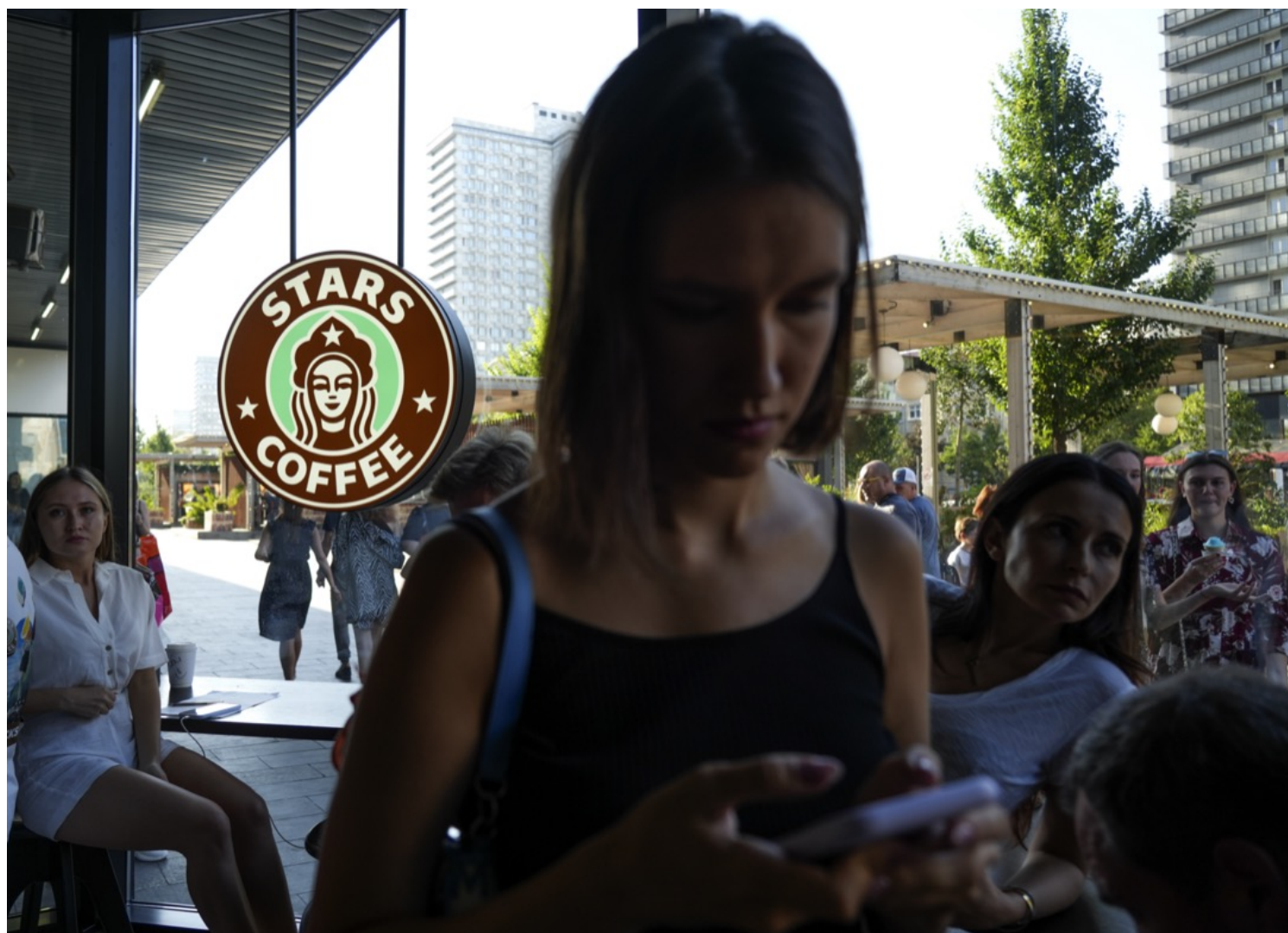
2022年8月18日，俄罗斯莫斯科，自入侵乌克兰后，星巴克等外资企业将业务撤离俄罗斯，当地民众光顾取而代之的“星星咖啡”（Stars Coffee）。

餐厅和咖啡馆里能看见的男士有点少。这是在彼得堡和莫斯科的直观感受。我没有任何数据可以证明这种感受是否符合现实。但一个合理的推测是：中产阶级的男性比别的阶层的男性都更大比例地逃离了俄罗斯。和我聊天的每个人都告诉我，自己有朋友（主要是男性朋友）现在正身处某个前苏联国家——亚美尼亚、格鲁吉亚、哈萨克斯坦、乌兹别克斯坦或吉尔吉斯。相比已经涨价到上万港币一张的直飞土耳其的机票，前往中亚和高加索国家的便宜途径更多。俄罗斯人在那些国家也有超过三个月的免签待遇。很多人看中这些地方仍然能使用俄罗斯的银行支付系统，使得他们就算身在俄罗斯之外也能远程办公，赚俄罗斯的钱，在外面花。