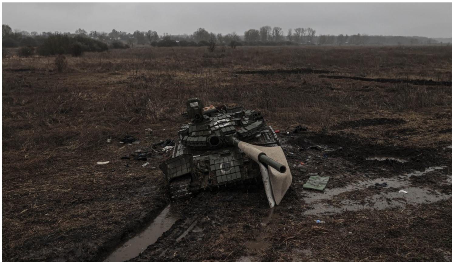
2022年4月2日，乌克兰切尔尼戈夫，一辆被炸毁的俄军坦克车被弃置在平原上。

在见到L之前，我听好几个朋友讲过类似的故事：在俄罗斯，接受过高等教育的知识分子中，有一批人是认可战争的，尽管他们未必会公开表示出来。他们很多都不认同普京，甚至还是普京的反对者。他们也知道一旦自己被征兵，腐败的军需系统将无法提供足够的装备和训练，但是他们仍然选择投入战争。这些人更加深恶痛绝的是社会的无动于衷和“去政治化”。