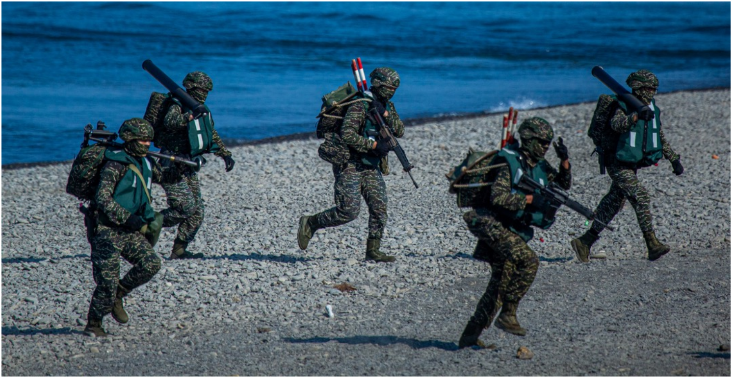
2022年7月28日，台湾屏东举行年度汉光演习，士兵从一辆AAV7两栖突击车登陆上岸。