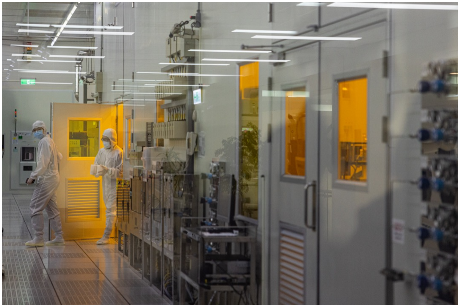
2022年9月16日，台湾新竹市，穿无尘衣的学生在国研院台湾半导体研究中心进行研究工作。

近年全球台湾研究中心 (Global Taiwan Institute)成立，将台湾多元议题，包括艺文及影视产业带入华府讨论圈，但一般而言，在华府的智库圈子里，台湾议题仍被置于美中大国角力的讨论框架之中，例如2049计划研究所 (Project 2049 Institute) 就专注中共威胁及解放军侵台研究。不过，随著美通过晶片法案 (CHIPS Act)，并决定对中共在技术上寻求遥遥领先而不止是相对优势后，台湾在半导体供应链所扮演之关键地位愈来愈明确，华府也出现了许多相关研究及研讨会。例如近期战略暨国际研究中心 (CSIS) 和布鲁金斯研究所与台湾官方合作举办的公开研讨会，内容就著重于台湾于全球经济上扮演之角色，进而呼吁维持印太地区稳定之重要性。