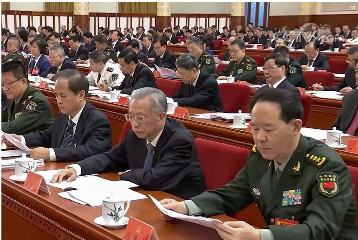
新任联合参谋部司令刘振立(右)。