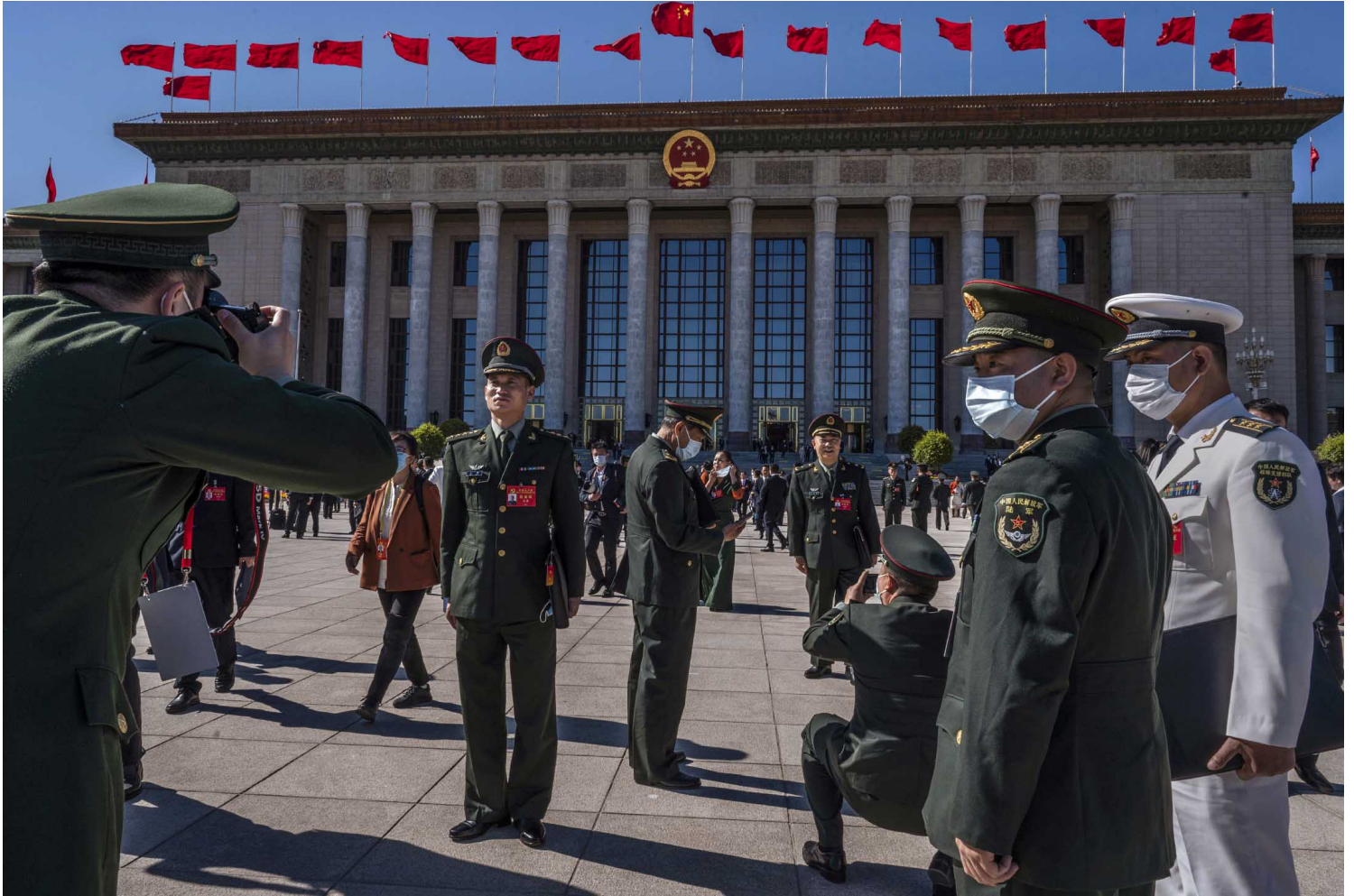
2022年10月22日，北京，中国共产党第二十次全国代表大会闭幕，军方代表于北京人民大会堂外拍照。

都可能会产生最后影响。但许多私人互动关系，便不易在公开资料中寻得，因此在进行分析时，本文尽量以各项人事历练关系与军种专业进行分析。