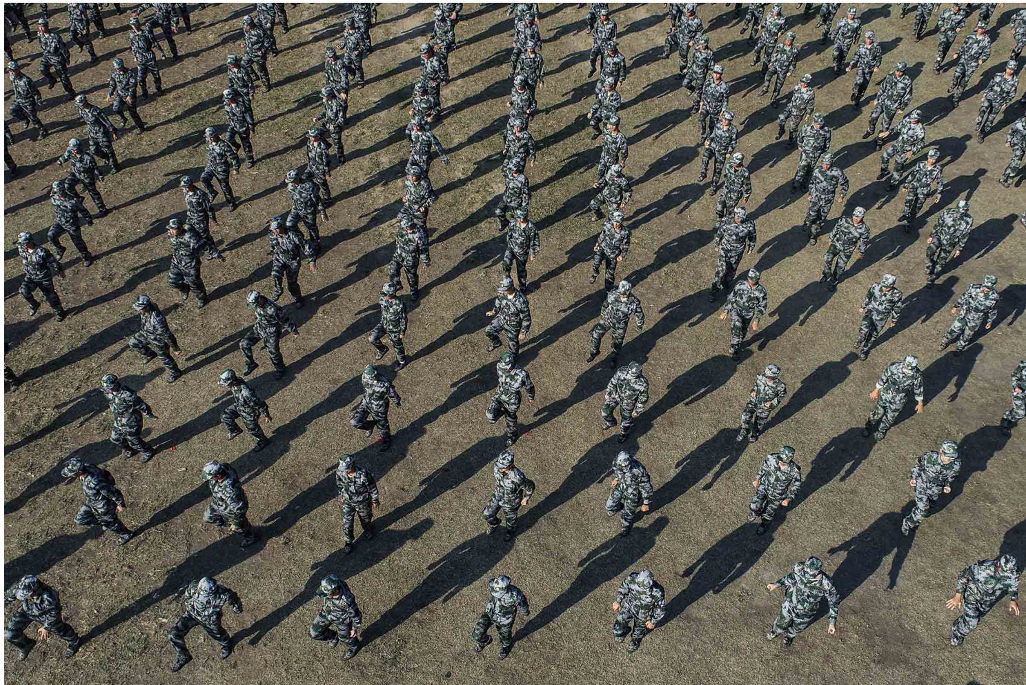
2022年10月22日，江苏省淮安市，大学新生展示他们的军事训练成果。

是在徐才厚、郭伯雄的团体中较受打压的一群。这些与徐郭集团保持距离的将领大多都是后来习近平重用的军事干部，也是当前解放军的骨干。