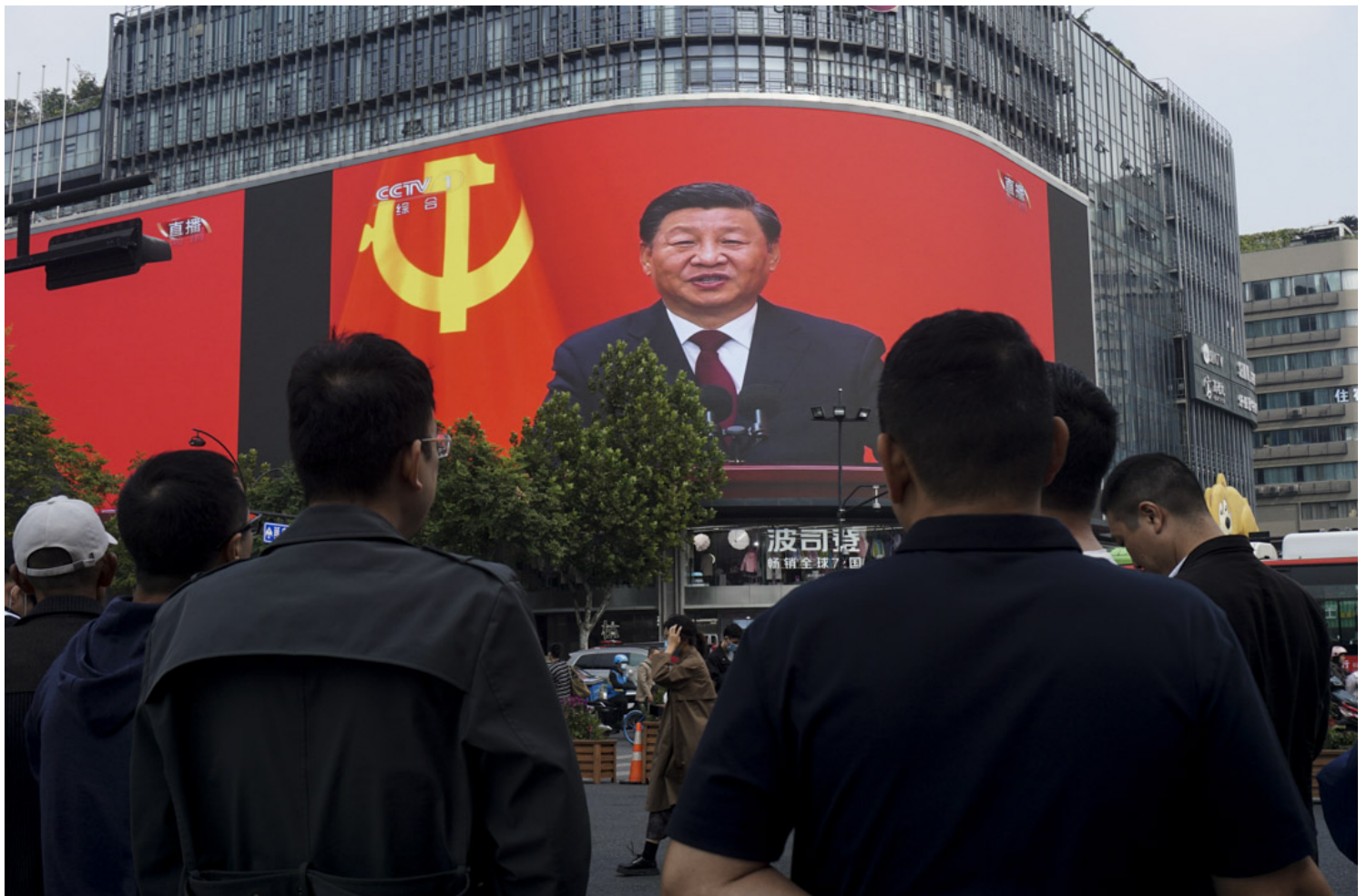
2022年10月23日，中国杭州市，路人在大厦的显示屏上观看中共总书记习近平在中共二十大闭幕礼上发表讲话。

是他还在等待，还是他内心其实根本不认为权力的结构和运作规则是一件重要的事情？笔者更相信是后者。