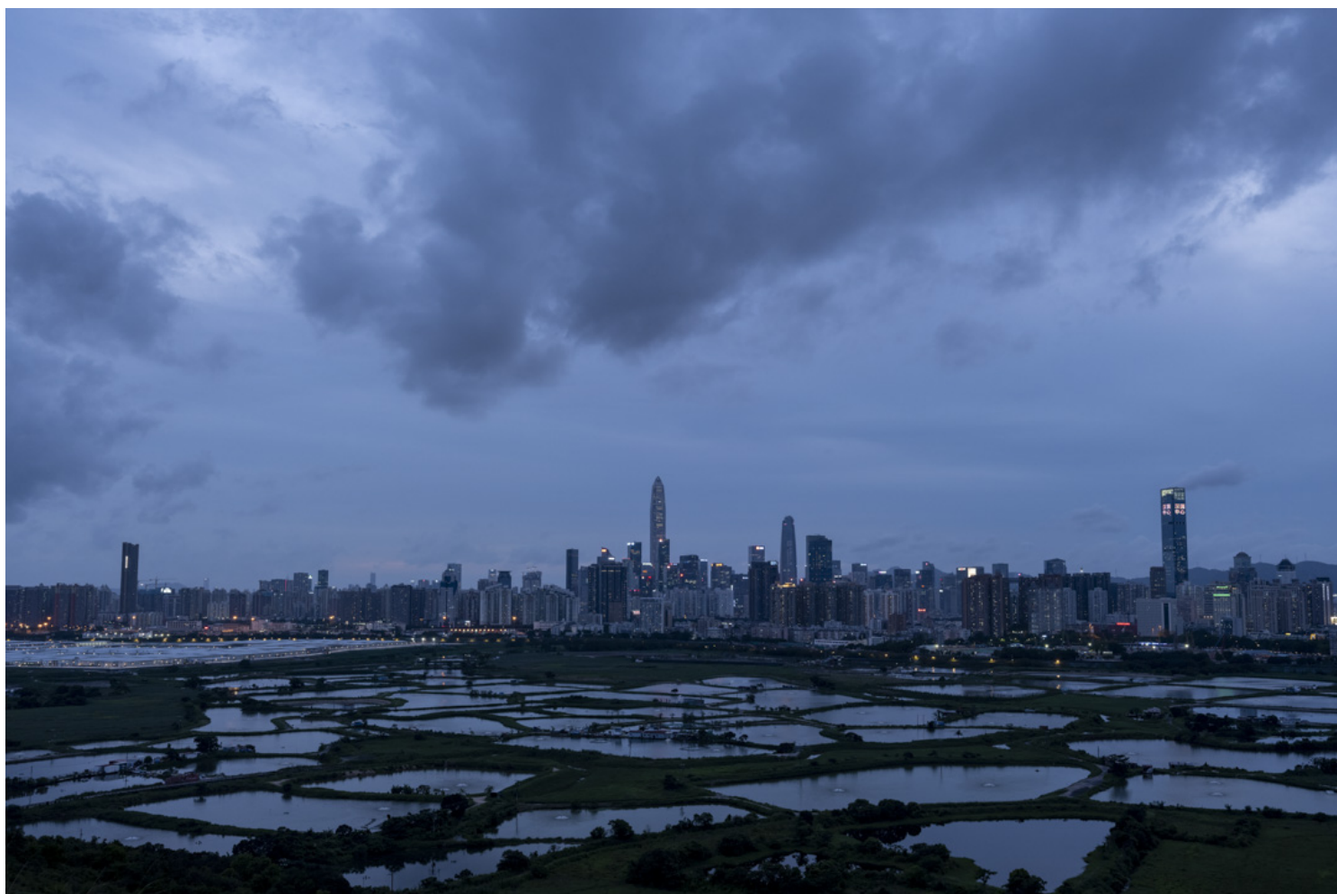
2022年6月，香港的落马州边境遥看深圳。

李家超今进一步将计划具体化，今年内会就填海、土地用途、交通基建及财务安排等作建议，目标明年环评程序，最快在2025年展开填海工程。