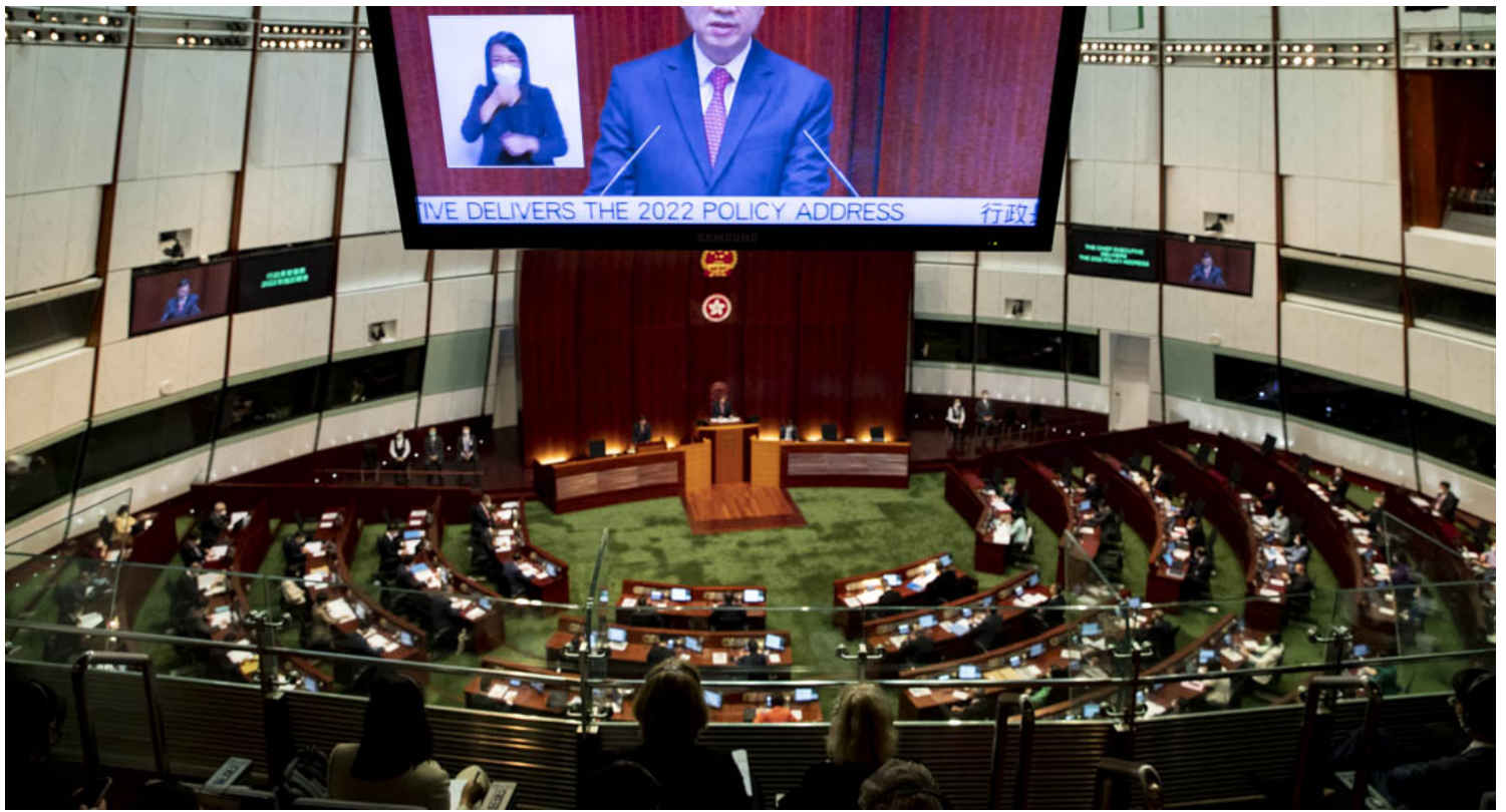
2022年10月19日，特首李家超在立法会宣读上任后首份施政报告。