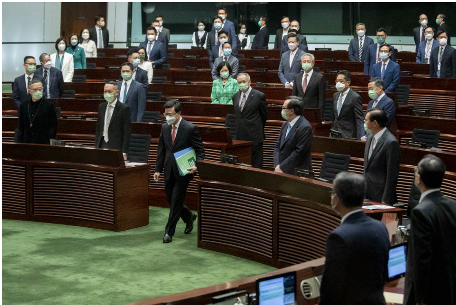
2022年10月19日，特首李家超在立法会宣读上任后首份施政报告。

李家超形容，香港正面对人力短缺问题，并因应行业情况提出解决方案，例如劳工及福利局在保障本地劳工就业前提下，会适度输入安老及残疾人士院舍护理员、简化审批程序。