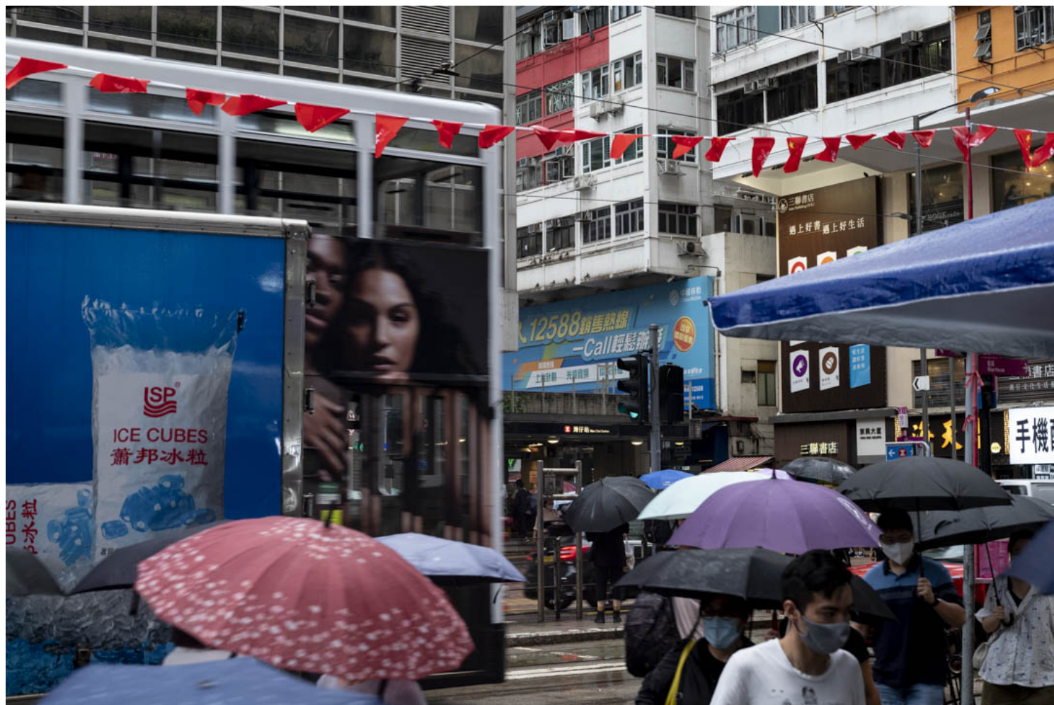
2022年9月，香港湾仔街道上的市民。

亦同时会以自行开发的软件进行自我检测工作，并于下学年启动了例行中期教育评估。《基本法》测试，下学年起扩展至所有直资学校及参加“幼稚园教育计划”的幼稚园，测试内容涵盖《基本法》和港区国安法，及安排教师到参加中国大陆学习团。