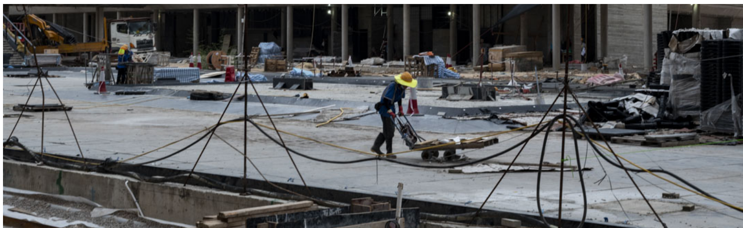
2022年10月，香港九龙的一个建筑地盘。