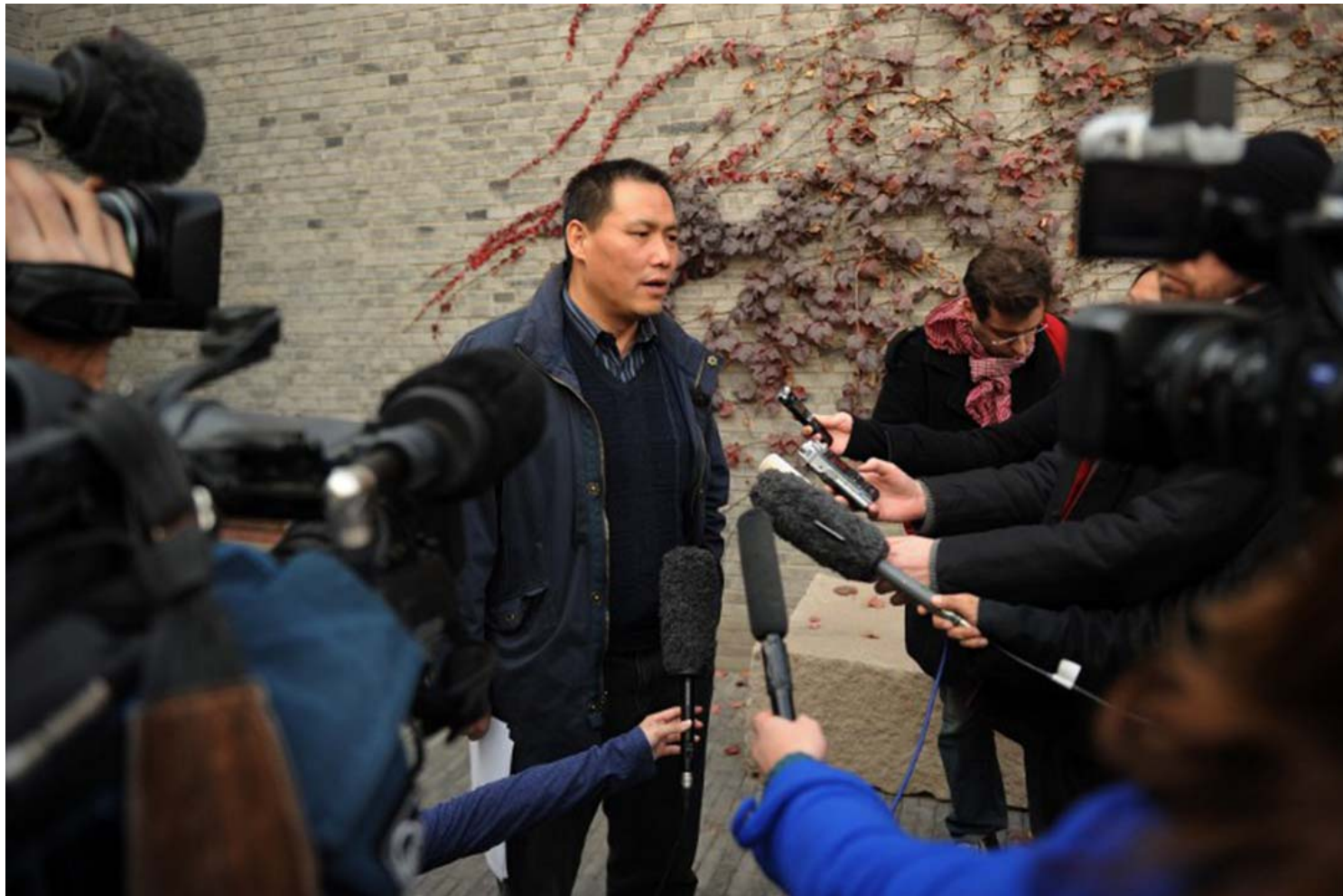
中国维权律师浦志强。

律师，与丁律师委托书给夏霖。所以，夏霖在失去自由后的零口供妥协，开个让人们意外。只是朋友们没想到，最终，夏霖被当局以“赌博”与“诈骗”做污名化指控，在当局大规模打压律师之前，他就先行失去了自由。