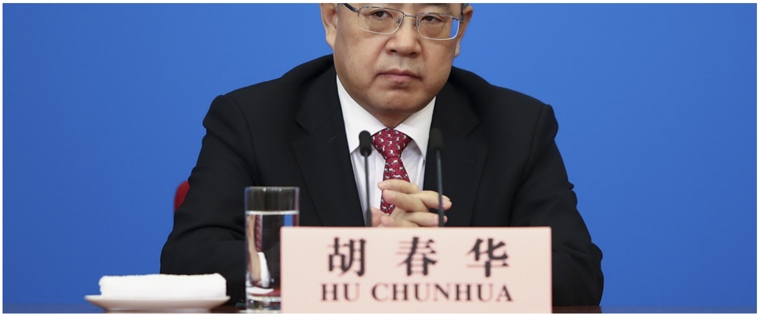
2018年3月20日，十三届全国人大闭幕，中国副总理胡春华出席新闻发布会。