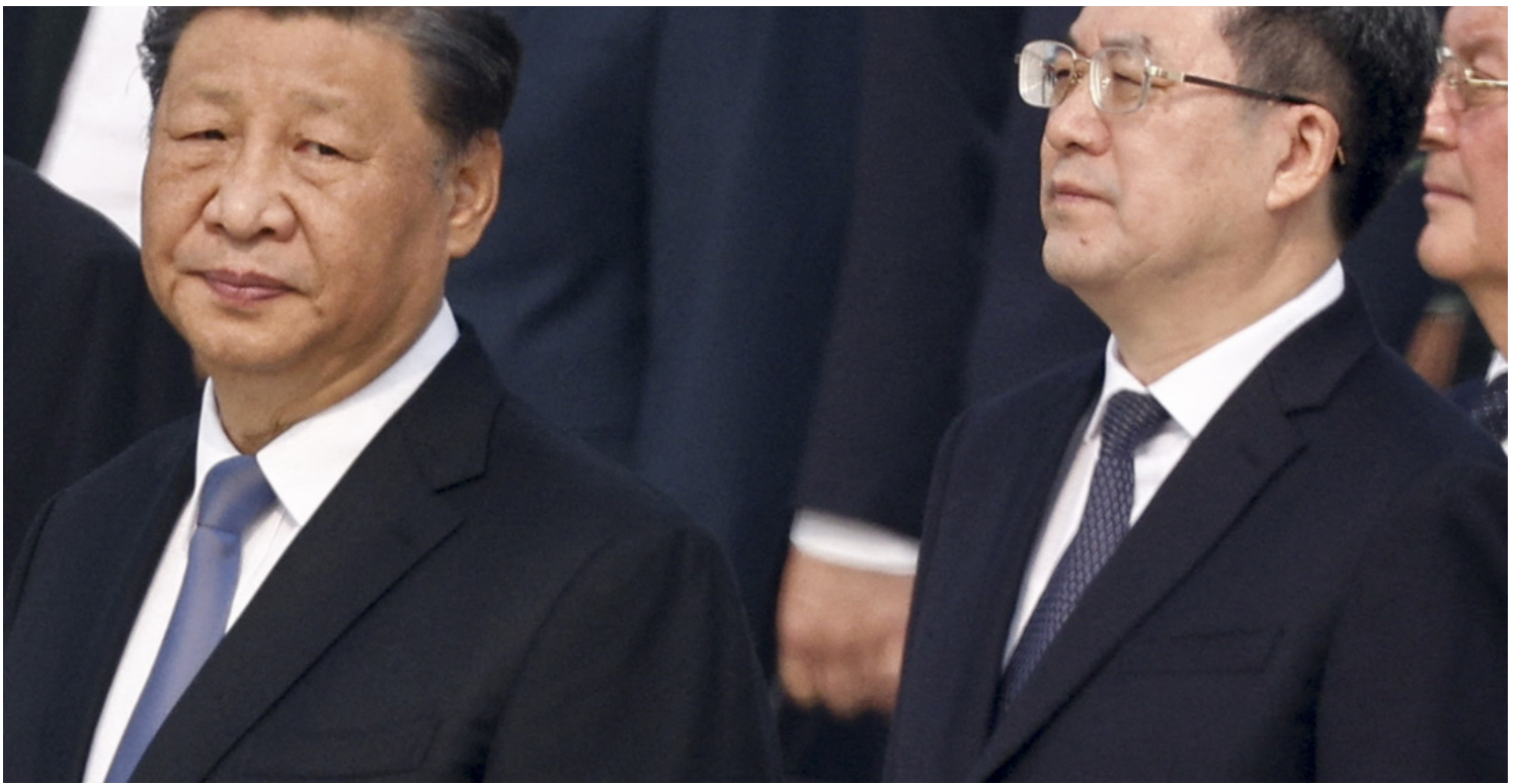
2022年9月30日，国家主席习近平和中央办公厅主任丁薛祥在出席在天安门广场举行的烈士节献花仪式。