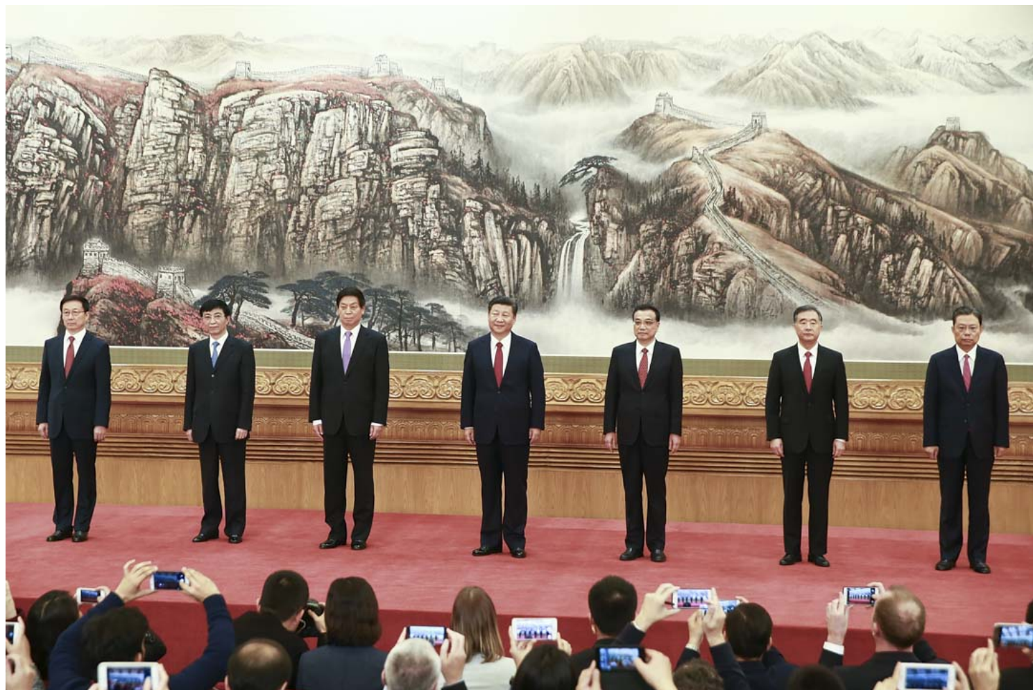
2017年10月25日，十九大公布了新的政治局常委，韩正、王沪宁、栗战书、习近平、李克强、汪洋、赵乐际在人民大会堂会见媒体。

就此而言，过去十年来，党内纵然存在诸多对习的不满，不是已被铲除就是不成气候，故类似反习势力大集结发动政变之说实不符合当前中共政治现实，也无助我们对中国情势进行判断，此类传言真可休矣。