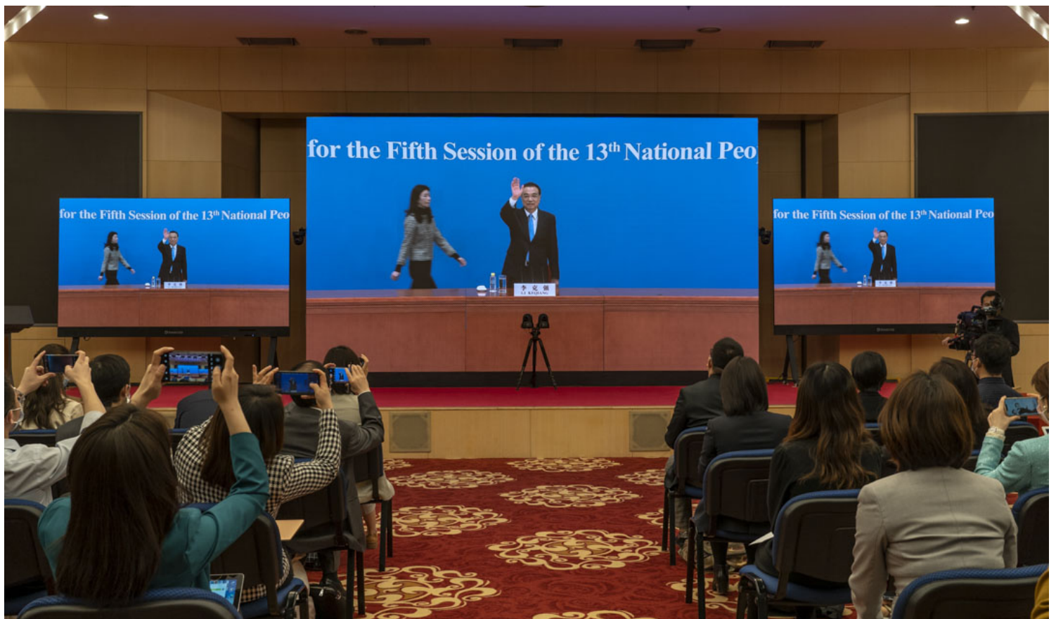
2022年3月11日，国务院总理李克强出席两会结束后的年度新闻发布会。