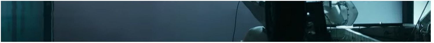
《长空之王》剧照。