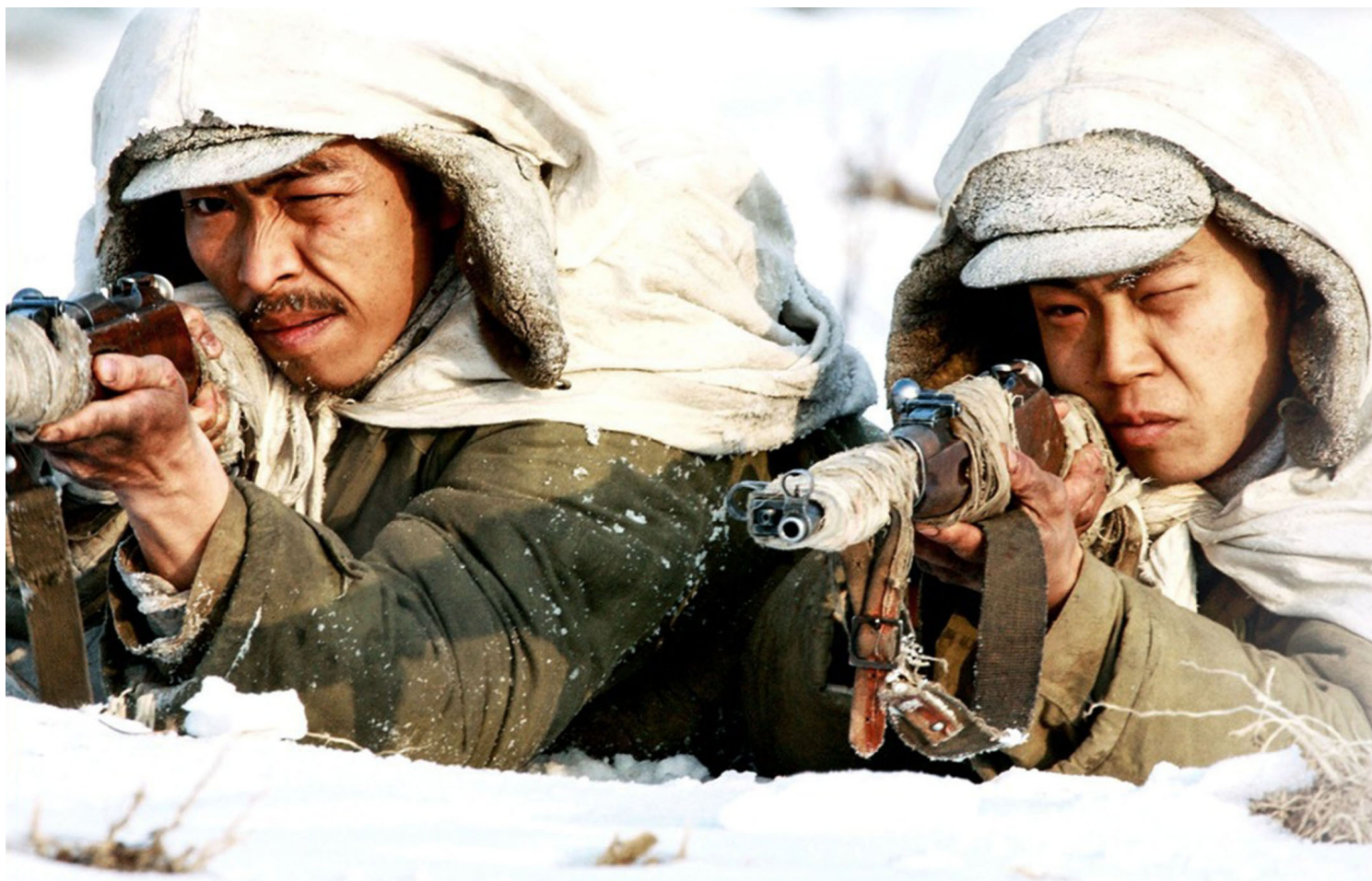
《狙击手》剧照。