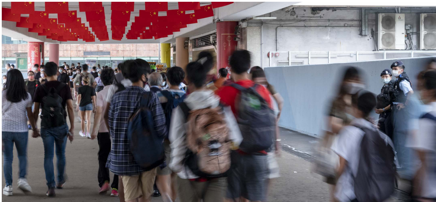
2022年9月30日，沙田港铁站。