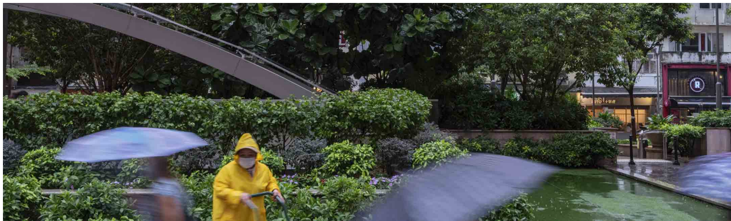
2022年9月30日，湾仔利东街。