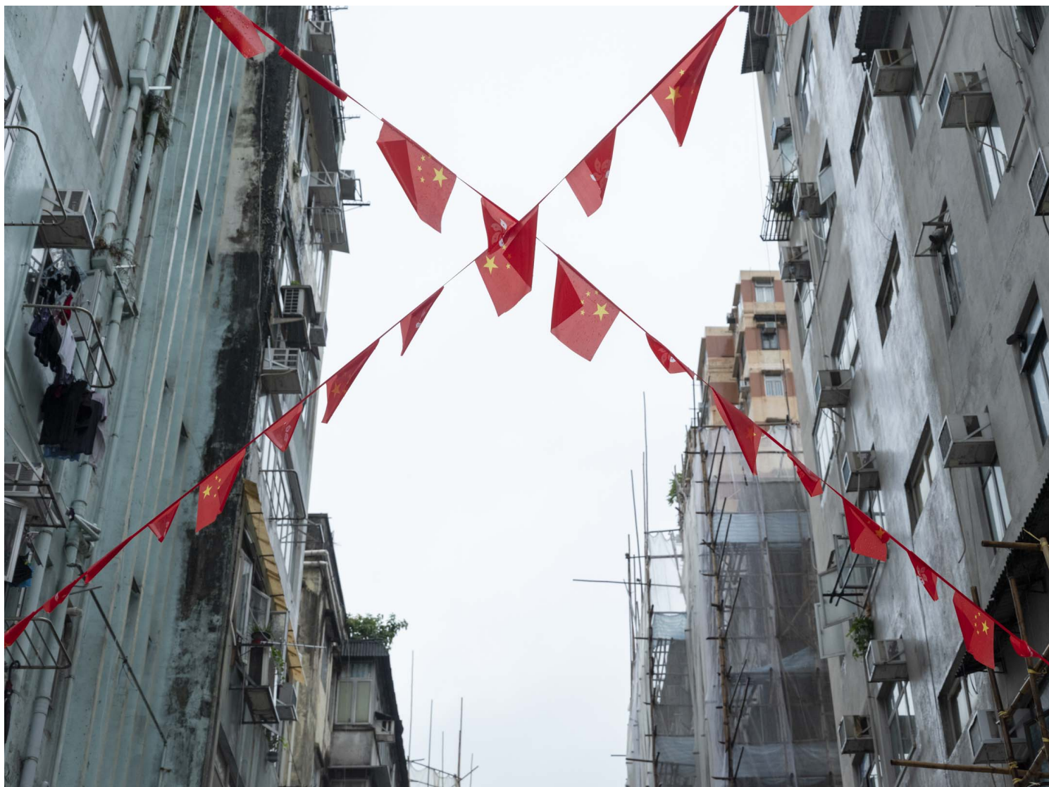
2022年9月30日，佐敦庙街。