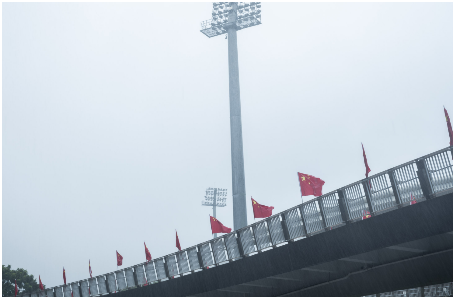
2022年9月30日，将军澳单车馆。摄：林振东/端传媒