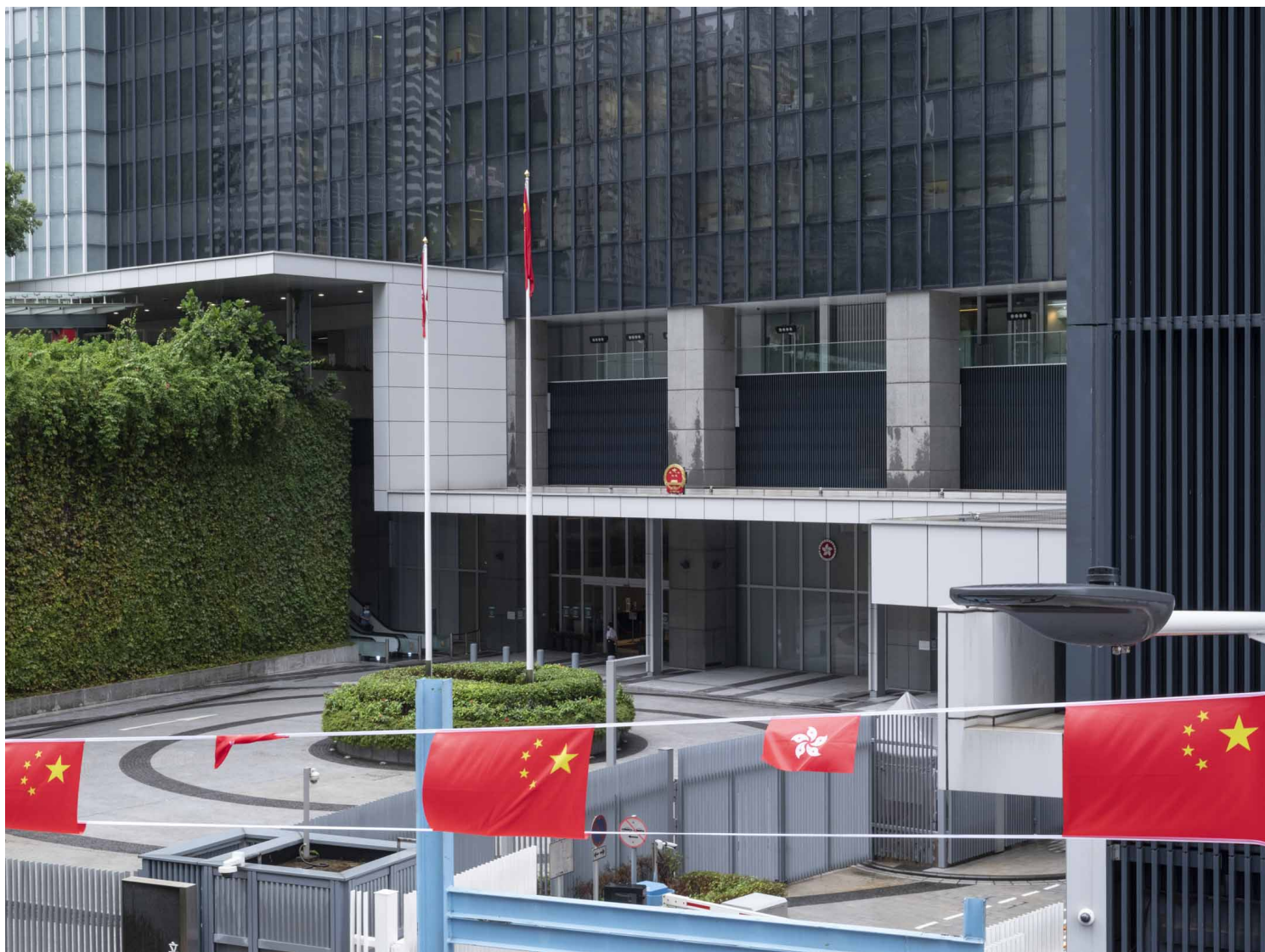
2022年9月30日，金钟政府总部。