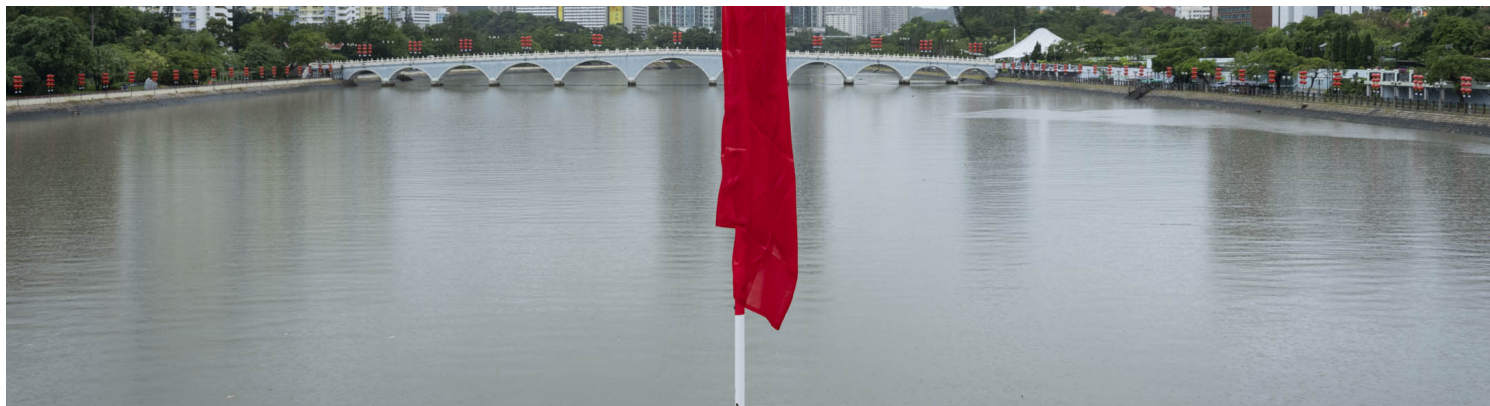
2022年9月30日，沙田城门河。