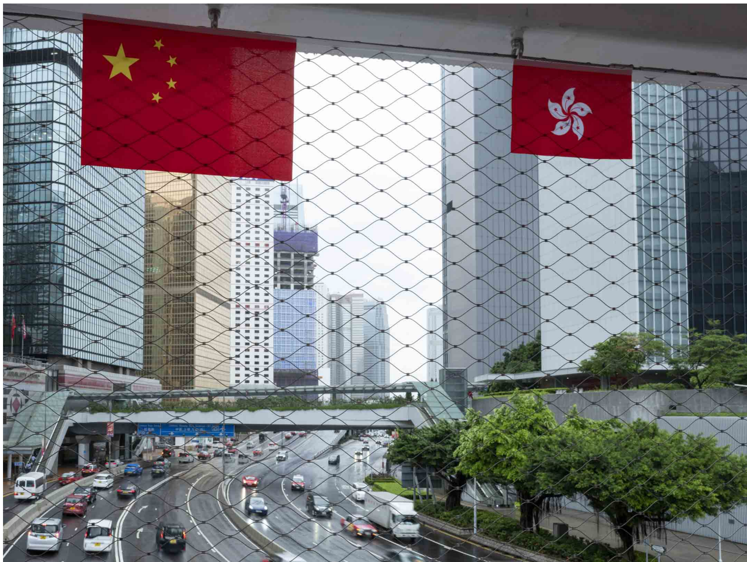
2022年9月30日，夏慤道。摄：林振东/端传媒