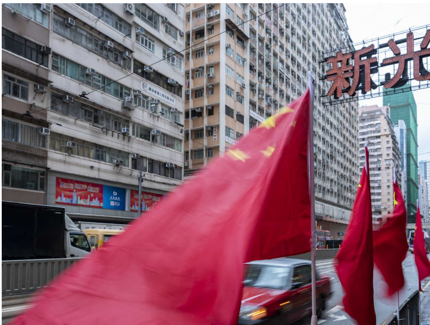
2022年9月30日，北角新光戏院。