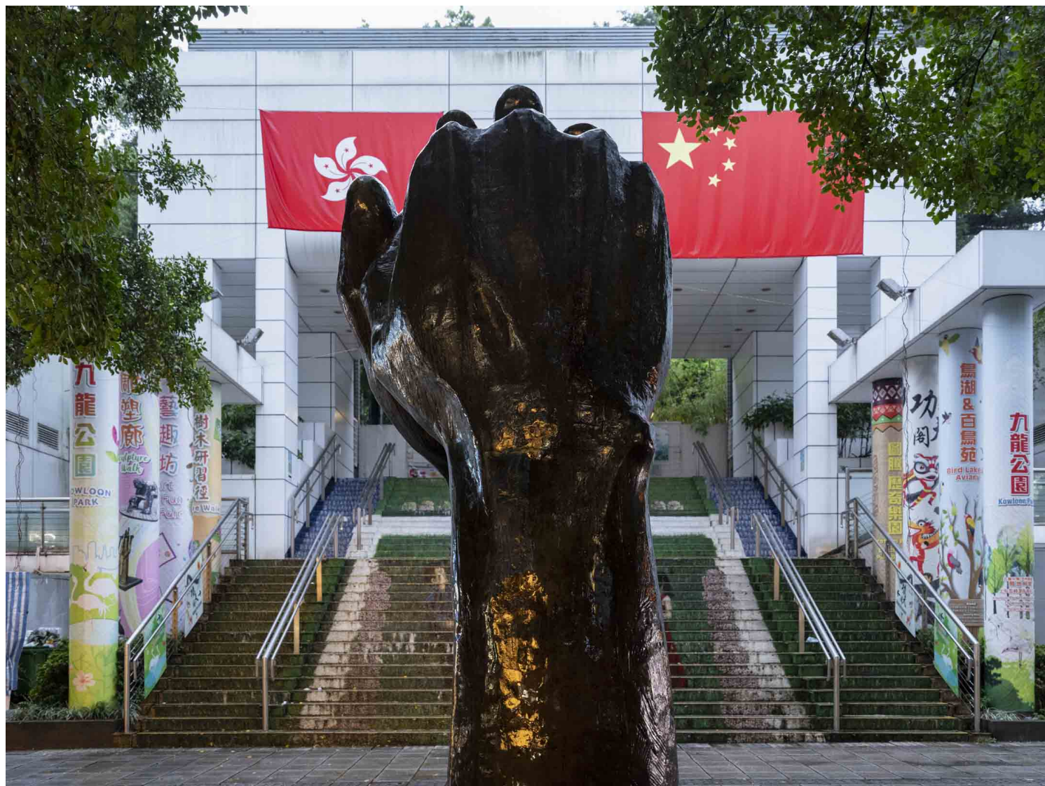
2022年9月30日，尖沙咀柏麗大道。