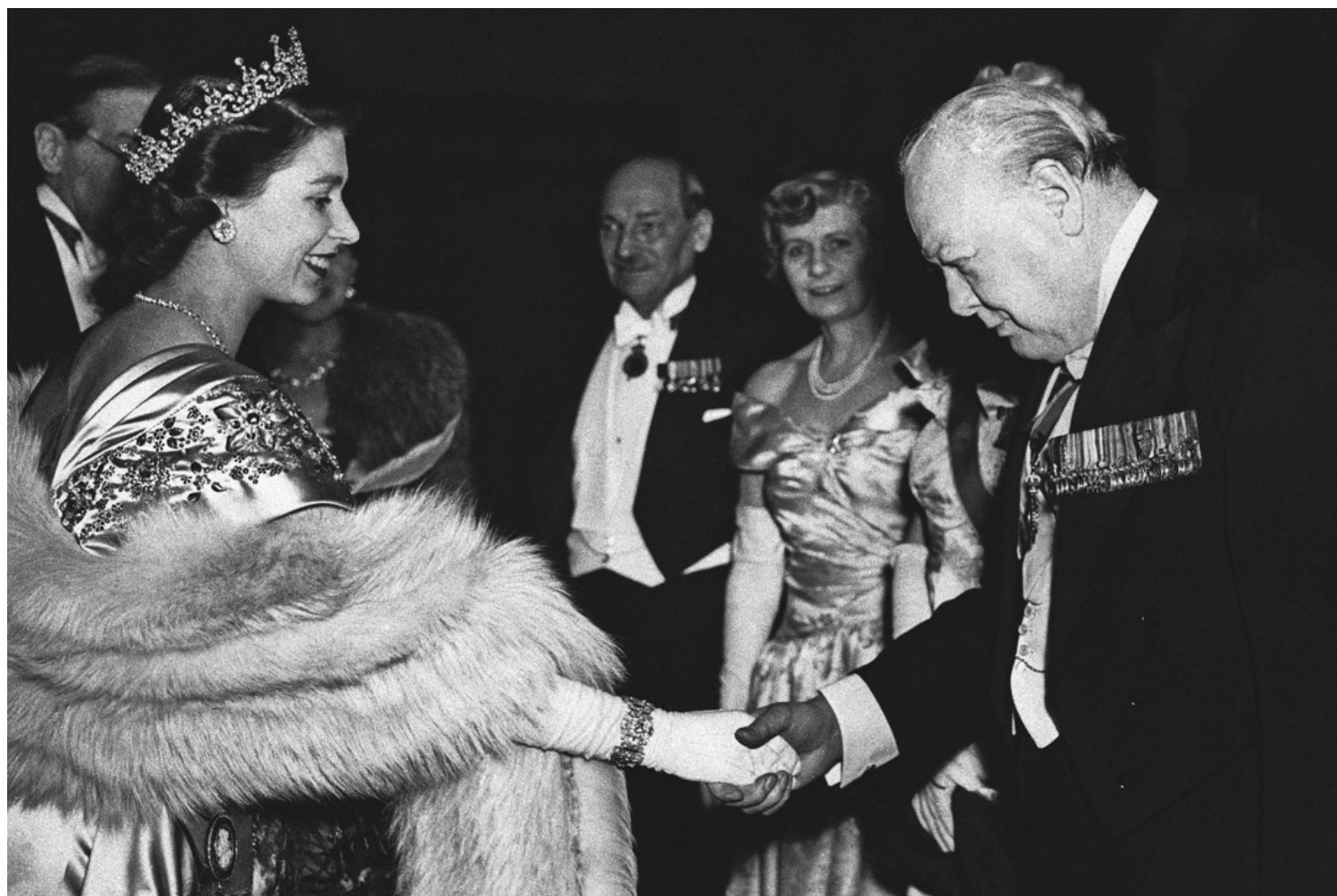
1950年3月22日，英女王伊莉莎白二世与英国前首相丘吉尔在伦敦市长全国感恩节基金会启动晚宴上握手。

家不会希望被迫靠边站，而且中国的贷款通常没有西方或多国经济支持所附加的道德束缚，比较容易获得——也即是说，“英联邦新政”未必能吸引这些国家留在联邦内。