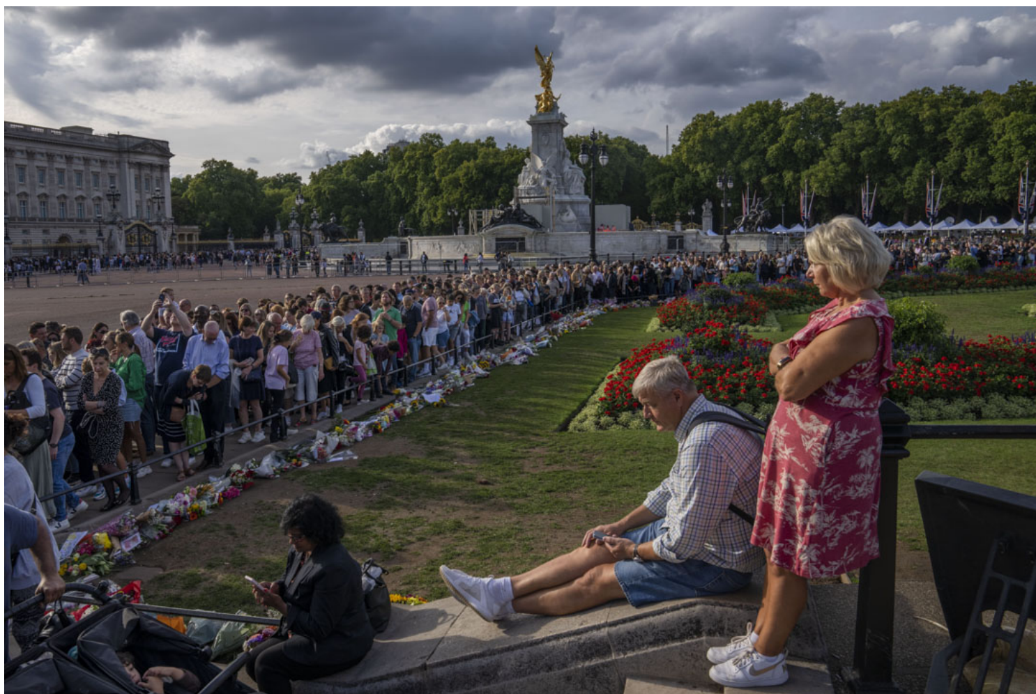
2022年9月11日，人们在伦敦白金汉宫前排队为伊莉莎白二世女王献花。

女王对一个日渐式微的品牌来说是非常有效的营销者。范登阿苏姆亦指：“女王对于保持英国在世界各国的形象非常重要。她是一股强大的软外交力量，对于世界各地的领导人来说，来自白金汉宫的邀请都是非常珍贵的。”