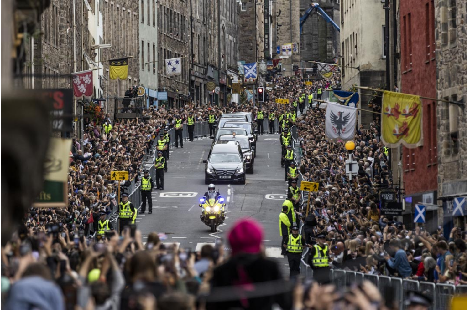
2022年9月11日，已故的英女王伊莉莎白二世的灵柩由黑色车队载往爱丁堡供民众瞻仰悼念，民众在爱丁堡的皇家大道上，夹道送别。

英女王在位70年，于2022年9月8日在她的苏格兰庄园巴尔莫勒尔城堡辞世，夏季的大部份时间，女王都在那里渡过。她的在位时间是英国史上最长、人类史上第二长——见证了15位英国首相，并亲身遇过13位美国总统和4位教宗（她同时是英国国教的领袖。）。她还是澳大利亚、加拿大、纽西兰和其他11个国家的女王，以及英联邦（Commonwealth of Nations；又称作大英国协，但两个中文名称也没有正确反映组织的英文名称，因为1949年组织的头衔中已经去掉了“英国”一词）的领导人。