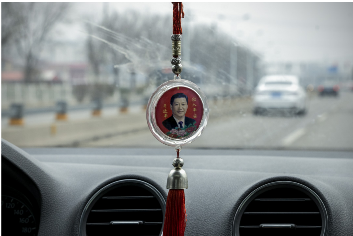
2022年3月24日，北京，中国国家主席习近平的肖像出现在一辆汽车内的幸运符上。

对广大的民众来说，中共二十大虽然精彩或者乏味——看从哪个角度言——但始终只能是看客，尘埃落定后，一切都不会有太大改变。