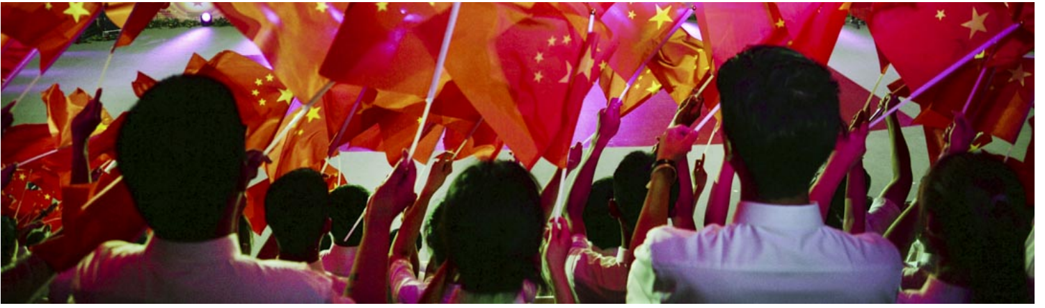
2021年6月26日，天津人民体育馆举行的庆祝中国共产党成立100周年的合唱活动。