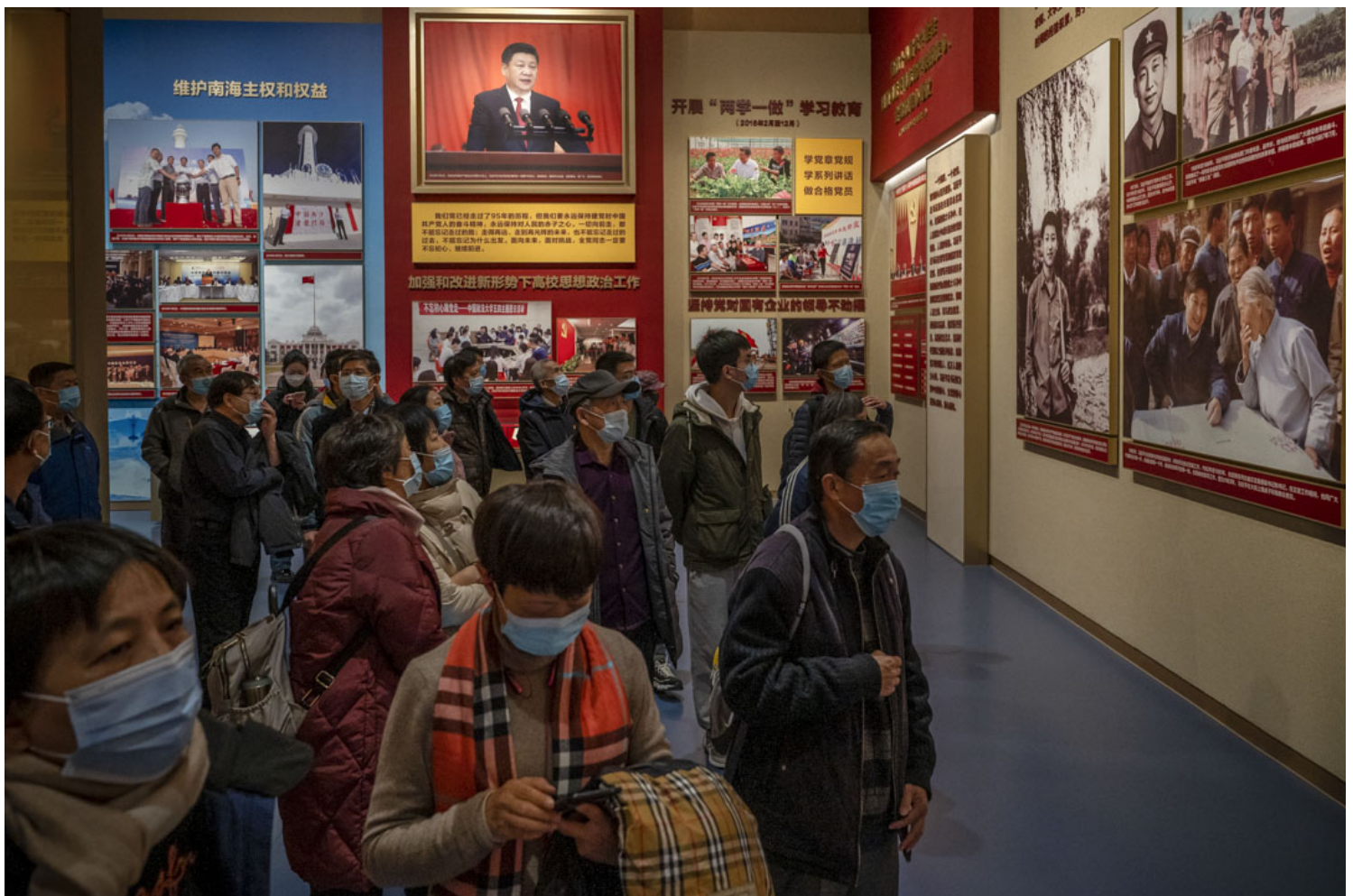
2021年12月16日，北京，中国共产党历史展览馆内有关中国国家主席习近平的展览。

中共党代会每五年举行一次，它规划的是未来五年党和国家的治理路线，按照官方的说法，二十大不仅决定着未来五年的发展蓝图，也管未来十年甚至更长。这实际已经暗示习要连任。虽然习在十九大之后废除国家主席任期制使他连任的意图昭然若揭，可一直以来很多人觉得他连任不了，尤其是今年随着清零而来的自由受限和社交隔绝，以及经济的严重滑坡导致局面的严峻性，更让这些人认为习会遭到党内强大阻力，连任无望。中国今年形势的糟糕确实使习的连任蒙上了一层阴影，但并不构成对他连任的关键牵制。有很多因素和迹象显示习必定连任，只是一些人不愿正视或者认同。