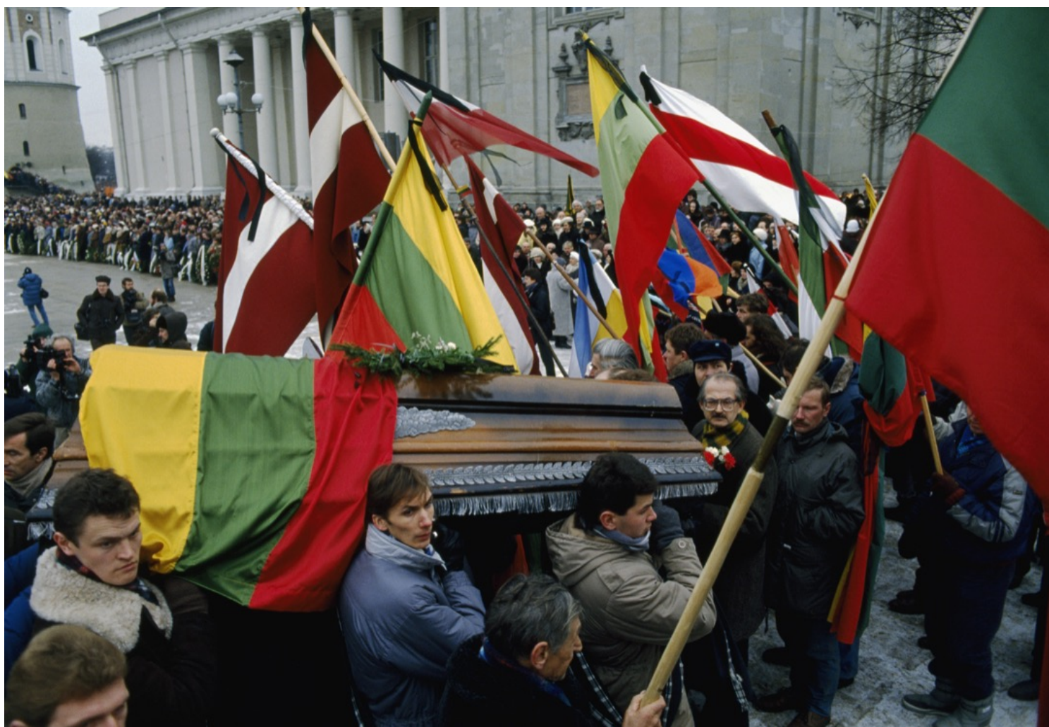
1991年1月16日，立陶宛首都维尔纽斯，市民为反对苏联军队占据电视塔的示威中被苏联军队杀害的示威者举殡。立陶宛在1990年

我觉得他是个典狱长，决定对监狱进行一些局部改革：重刷外墙，允许囚犯读报，允许灯多开一会儿，但无非就是这种改革。而囚犯想的是出去。他们做到了，尽管违背了戈尔巴乔夫的意愿。