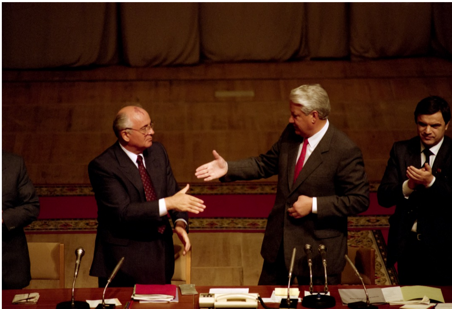
1991年8月23日，八月政变失败后，苏联领袖戈尔巴乔夫与新任俄罗斯总统叶利钦握手。