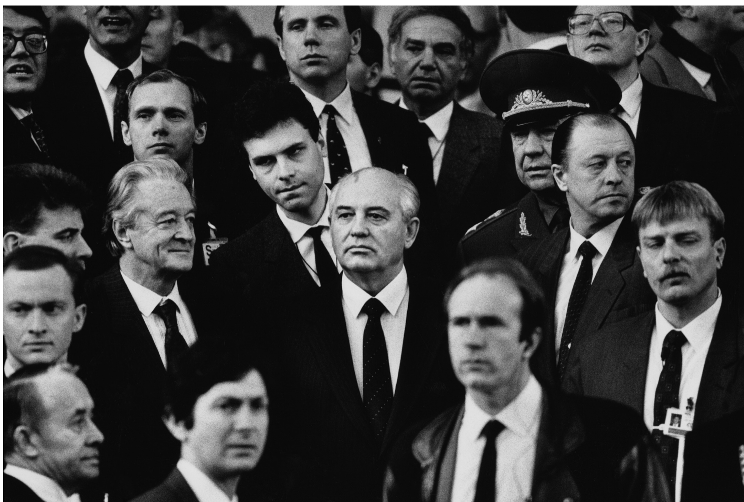
苏联最后一任领袖戈尔巴乔夫。

无论怀念、感激，还是批判乃至咒骂，评论者的视角都是从本国国情出发，往往明显不同于西方或俄罗斯人士。