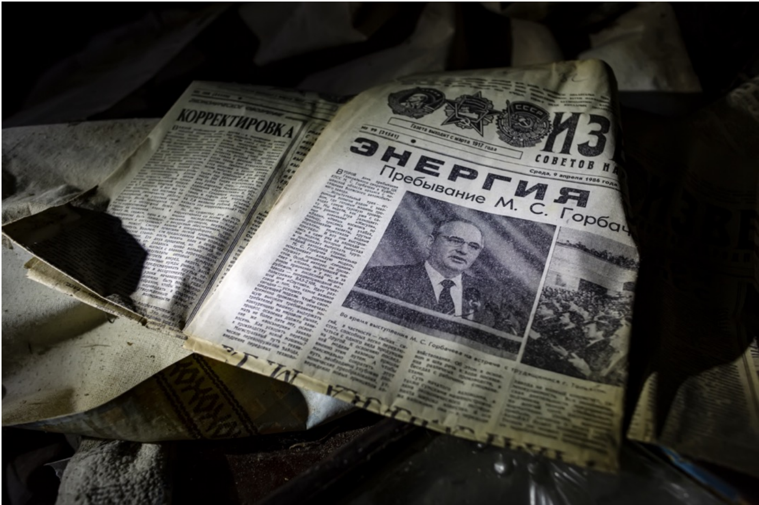
2019年6月17日，乌克兰切尔诺贝尔核电厂隔离区，一份1986年4月9日的报纸头版印有时任苏共中央总书记戈尔巴乔夫的照片。

“自由派”戈尔巴乔夫想保住帝国。改良、自由化，但是要保住。今天的俄罗斯自由派渴望的也是同样的东西。