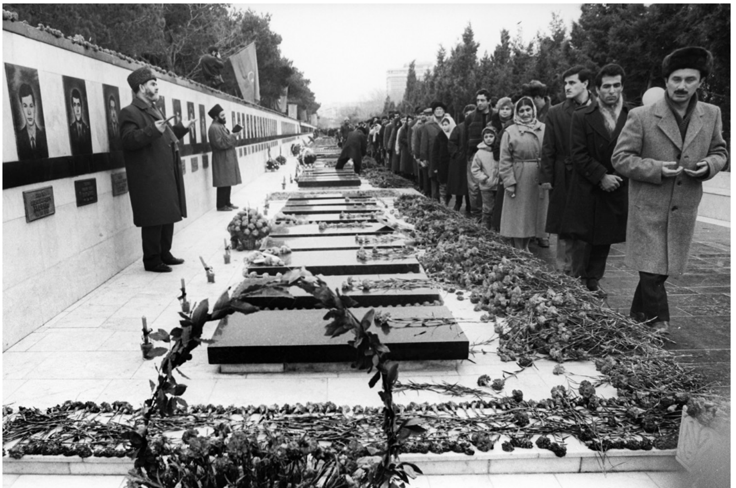
1992年1月20日，阿塞拜疆首都巴库，民众到烈士长廊悼念“黑色一月”事件中的遇害者。

当时的阿塞拜疆有了巨大的机遇，也受到巨大的威胁。由于这些改革，阿塞拜疆得以重新获得独立。这并非事出偶然，因为阿塞拜疆人民也一直在为此奋斗。但与此同时，阿塞拜疆受到了可怕的打击。不应忘记1月20日对阿塞拜疆人民犯下罪行的决定者是戈尔巴乔夫及其手下随从。