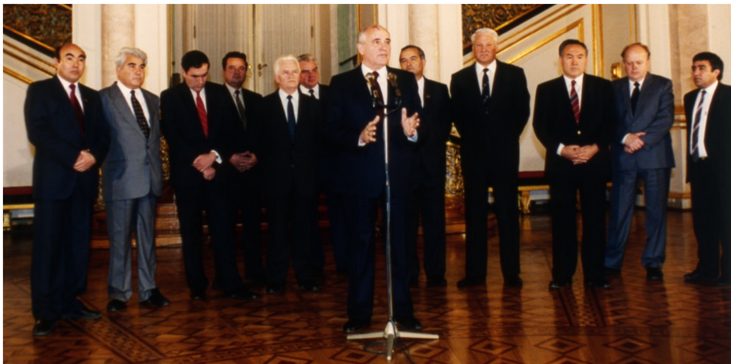
1991年10月18日，俄罗斯首都莫斯科，苏联总统戈尔巴乔夫与中亚领袖签署经济联盟协议后见记者。