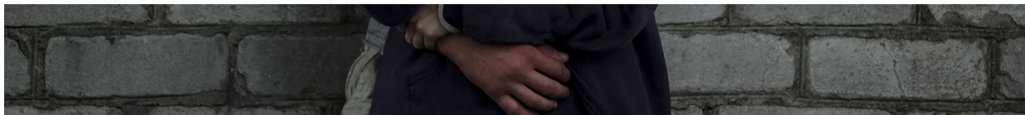
2022年7月10日，乌克兰顿涅茨克地区，当地居民等待他们亲人的消息。