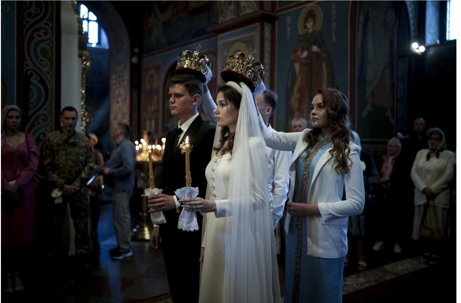
2022年5月29日，乌克兰基辅，一对夫妇在大教堂结婚。