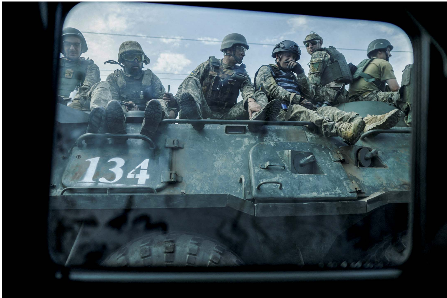
2022年8月22日，乌克兰顿涅茨克地区，俄罗斯与乌克兰的战事期间，乌克兰士兵乘坐战车。