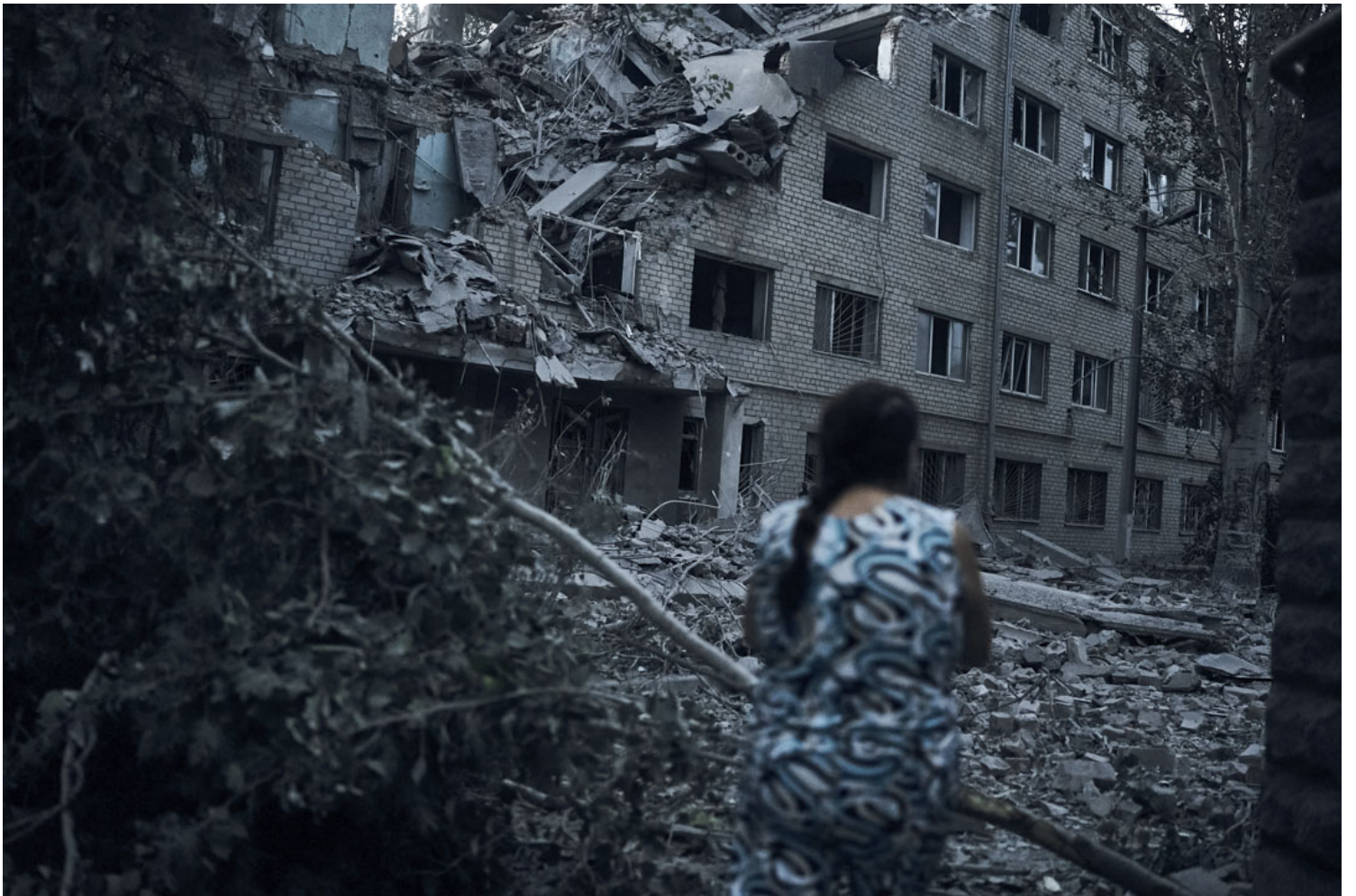
2022年8月2日，乌克兰 Mykolaiv 发生夜间砲击后，一名妇女走在住宅楼的废墟中。