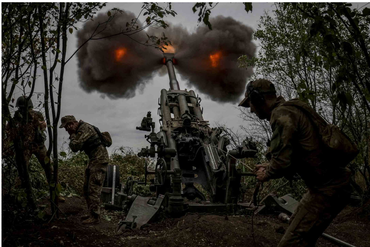
2022年7月21日，乌克兰哈尔科夫地区，乌克兰前线的军人发射M777榴弹炮。