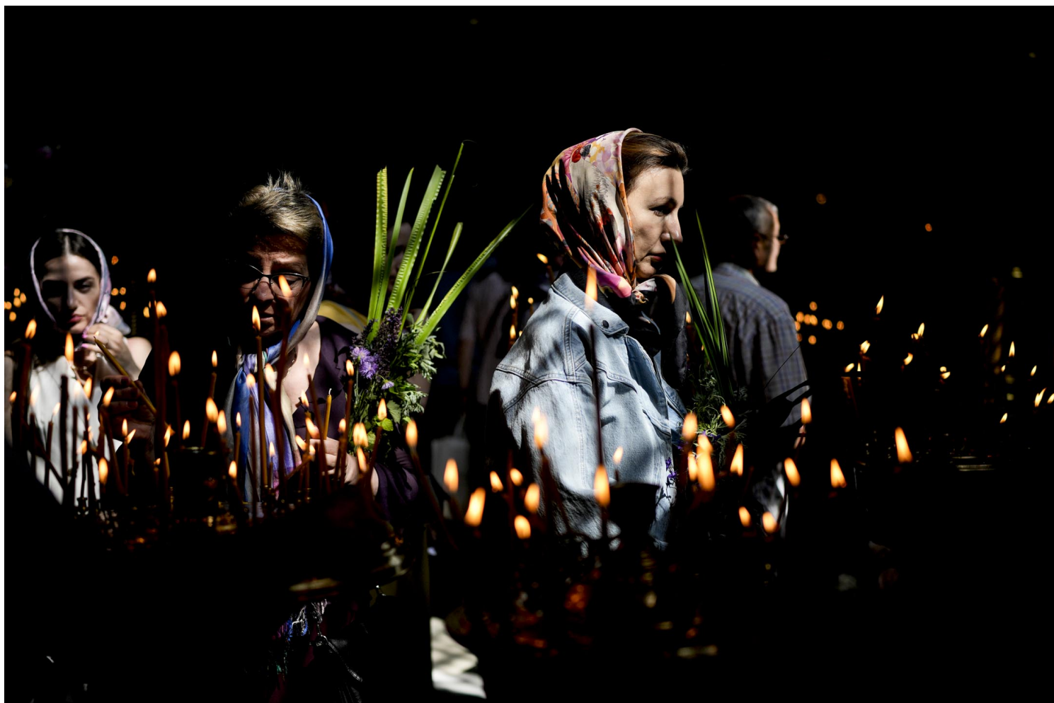
2022年6月12日，乌克兰基辅，东正教五旬节期间，妇女在圣沃拉迪米尔大教堂参加弥撒。