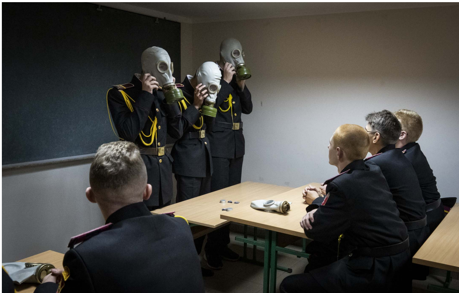
2022年9月1日，乌克兰基辅的一所学校，学生在上学的第一天，在防空洞中学习紧急求生应变技巧。