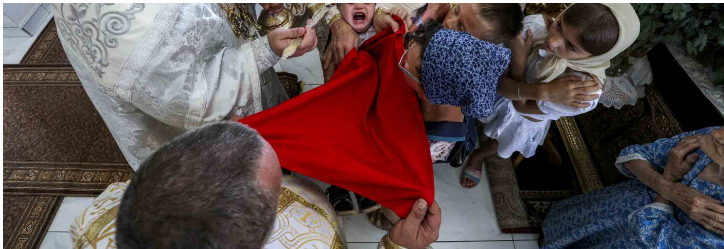
2022年8月19日，乌克兰克里米亚，信徒在一座教堂参加庆典。