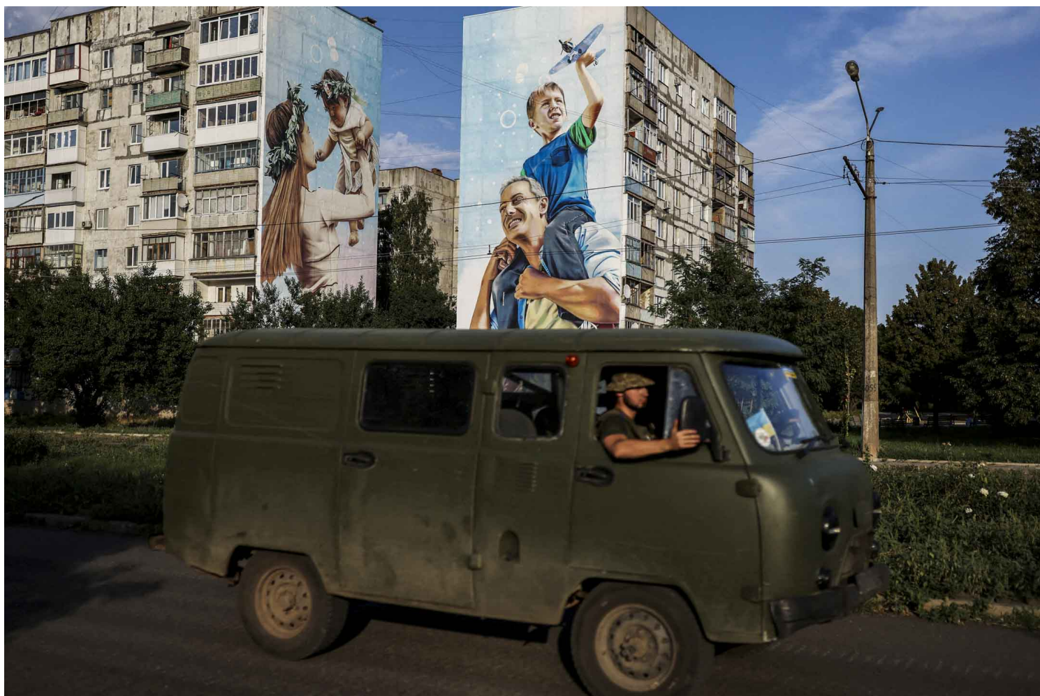
2022年8月14日，乌克兰顿涅茨克地区，乌克兰军人开车经过巴赫穆特受损的建筑物。