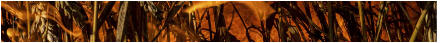
2022年7月29日，俄罗斯军在乌克兰哈尔科夫距离乌俄边境几公里处发动砲击，一片麦田被烧毁。