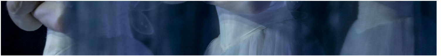
2022年6月10日，乌克兰利沃夫，利沃夫国家歌剧院内芭蕾舞演员在舞台上恢复演出。