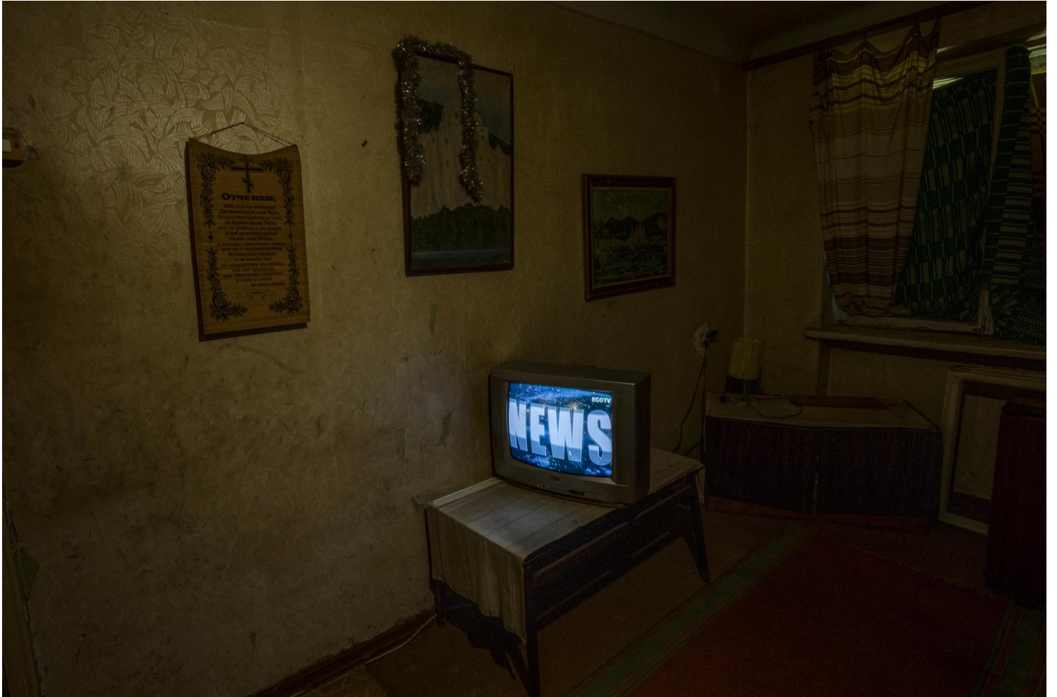
2022年7月6日，乌克兰东部克拉马托尔斯克，独居并拒绝撤离的 70 岁老人在公寓里看电视新闻。