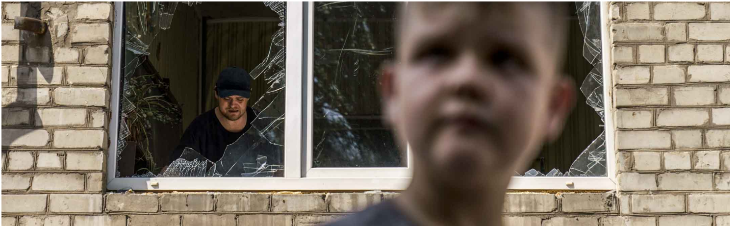
2022年8月19日，乌克兰顿涅茨克地区，清晨遭俄罗斯砲击后，一名工作人员在克拉马托尔斯克技术与设计学院清理内部。摄：David Goldman/AP/达志影像