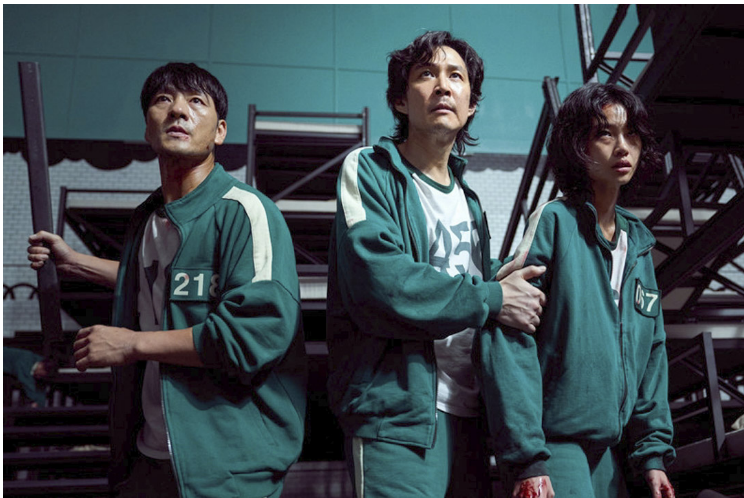
《鱿鱼游戏》剧照。

2016年的“限韩令”之后，韩流失去了几乎所有的中国市场，很多韩流明星来中国拍的合拍电视剧和电影，直到今天都没有上映。但这几年中，韩国的影视作品却成功打开了欧美市场。讲述韩国底层人民生活的电影《寄生上流》（Parasite；港译《上流寄生族》）于2020年横扫奥斯卡四项大奖，成为首部拿下奥斯卡最佳影片的外语电影。讲述韩裔美国人家故事的电影《米纳里》（Minari；港译《农情家园》）让韩国女演员尹汝贞获得了奥斯卡最佳女配角。