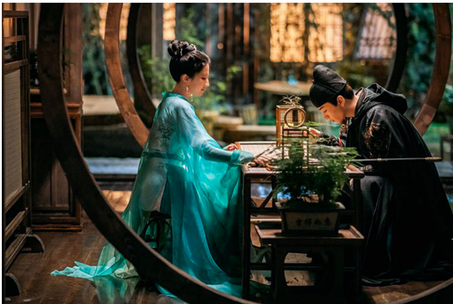
《梦华录》剧照。

大的败笔》一文中表示，“双洁”是一种“强加于风尘女子的洁”。如果真止尊重女性，不应该“搞什么贱籍鄙视链，好似偏要一个肉体上的清白，才配得起一个体面生活”。这篇文章很快获得10万+阅读量。