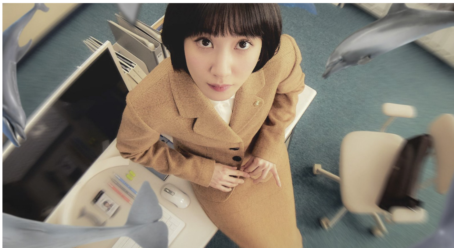
《奇怪律师禹英禑》剧照。

另外一个让我思考的案件则是与身心障碍人士恋爱的案件。因为受害人的智力只相当于小学生，所以人们认为她不明白什么是爱，什么是性，什么是普通的性行为，什么是性侵犯，并制定了法律条例保护这些弱势群体。即使她在法庭上清楚地表达了自己爱着与她发生性关系的被告，但被告依然被判处了两年的监禁。