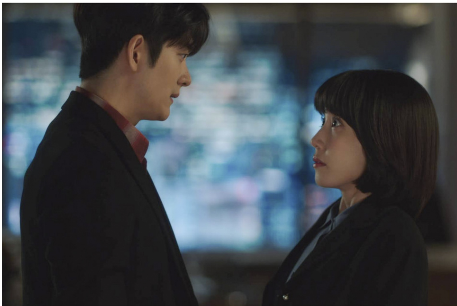
《奇怪律师禹英禑》剧照。网上图片

但自始至终，她都是紧紧地把命运掌握在自己手中的。在意识到自己的自闭症可能对委托人不利后，她选择了辞职，而又因为想要帮助好友而回去工作。在因为帮助委托人撒谎而良心不安后，她把具有警示作用的信件钉在墙上，并且在之后的案件中反对委托人撒谎或者伪造证据。她因为不喜欢父亲瞒着自己去托人而想要放弃这份工作，在接到更好的律师事务所的薪酬更高的合约之后，又在深思熟虑后拒绝了。她明明有可以利用的关系，但却主动和特权阶级划清界限，更没有把这些关系当做是可以拿出来炫耀的资本。自始至终，她都是独立并且自由的。