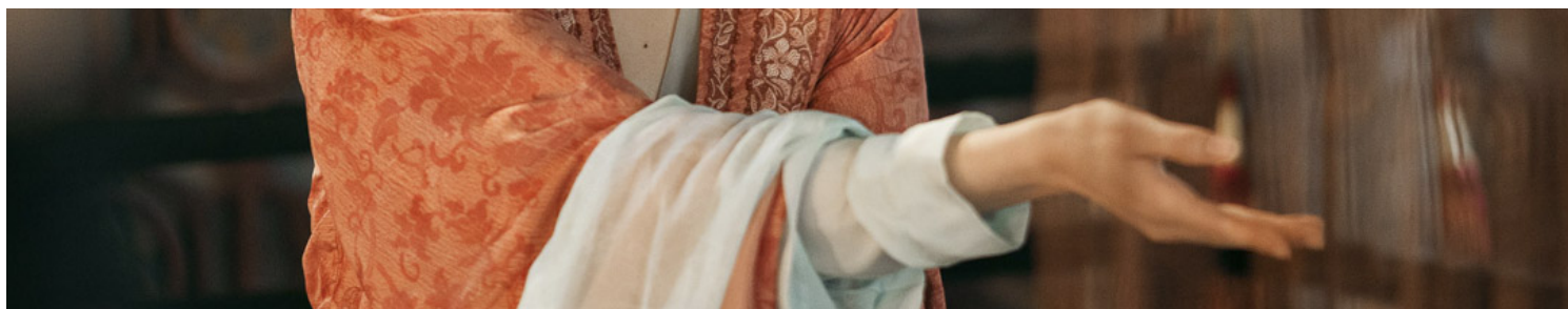
《梦华录》剧照。

纵观全剧，虽然台词中多次出现“女子贵自立”这样的口号，但女性角色却不得不依附喜欢自己的男性。而男性角色却都拥有特权，他们可以用自己的特权让女主买不到冰，也可以用自己的特权让女主用到冰，他们可以用自己的特权把女主赶出京城，也可以用自己的特权让女主在京城风生水起。女性们拼尽全力赚到的银钱，在一个个出手阔绰的男性角色面前，显得那么地微不足道。