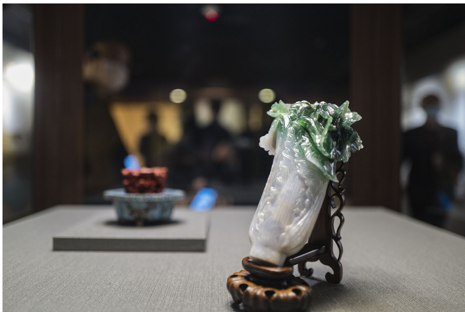
2022年8月28日，台北，国立故宫博物院內展示清朝的翠玉白菜。

至于称病推辞来台、“护宝有功”的马衡，在中华人民共和国建国后续任北京故宫院长，新的业务则是“利用文物为教育人民之工具，以启发其反帝反封建的革命思想，并协助国家建设事业”。台湾媒体时常强调故宫文物倘若不随国府来台，恐怕早于文化大革命中灰飞烟灭。不过比起被砸碑砍树、摘匾刨坟的曲阜孔庙，北京故宫在“破四旧”中几乎可说是全身而退。因为中共总理周恩来的特别照顾，故宫获得额外军事保护，深锁大门长达5年，可见故宫场址的特殊性，纵然是马列主义亦多所看重。