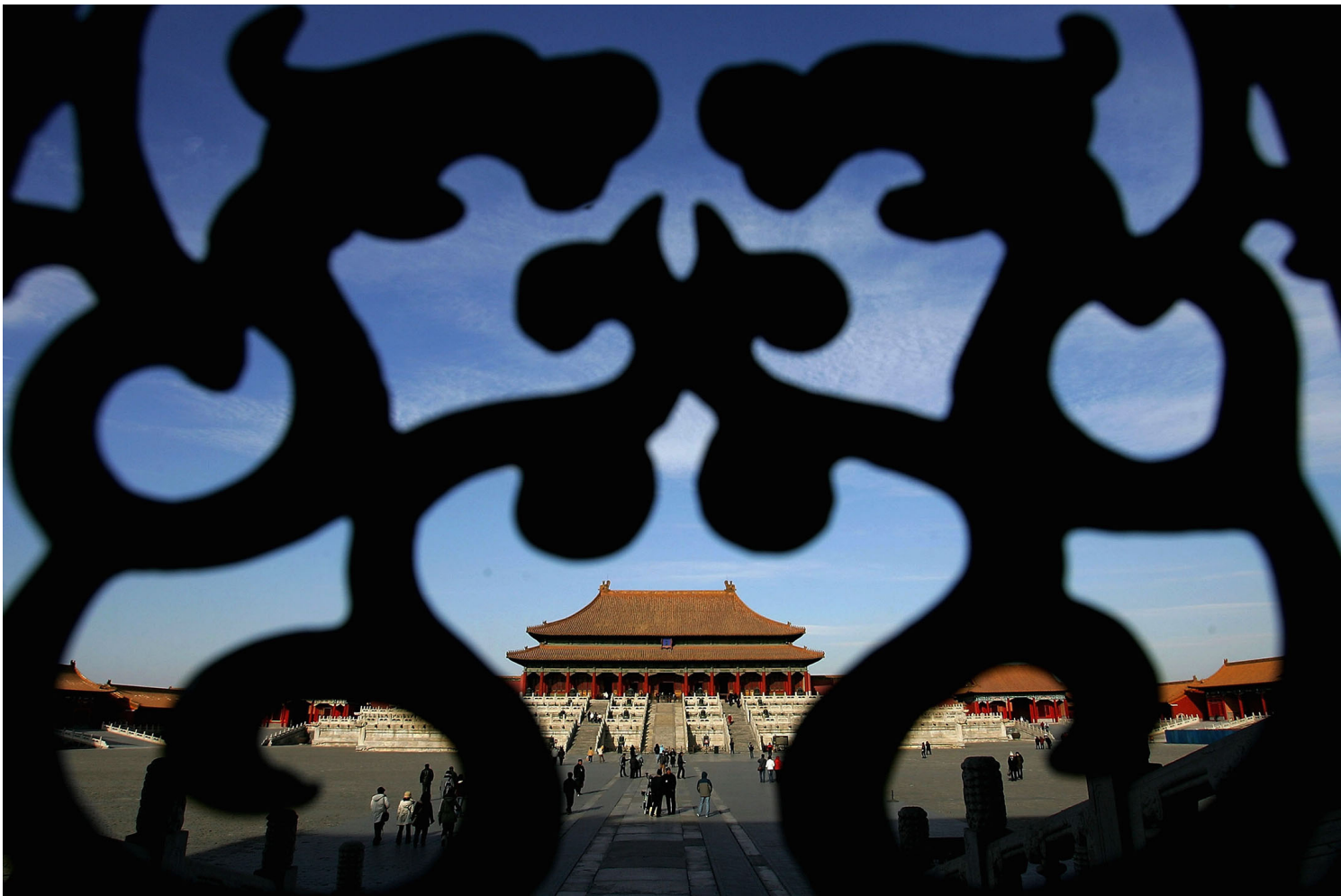
2006年1月5日，北京紫禁城。

回顾历史，每一次有关故宫文物可能“出门”的传闻总能挑起两极观点，事实上，故宫文物虽已是累积可观哩程数的资深旅客，却从来没有一次是在朝野上下均有共识的情况中上路的。