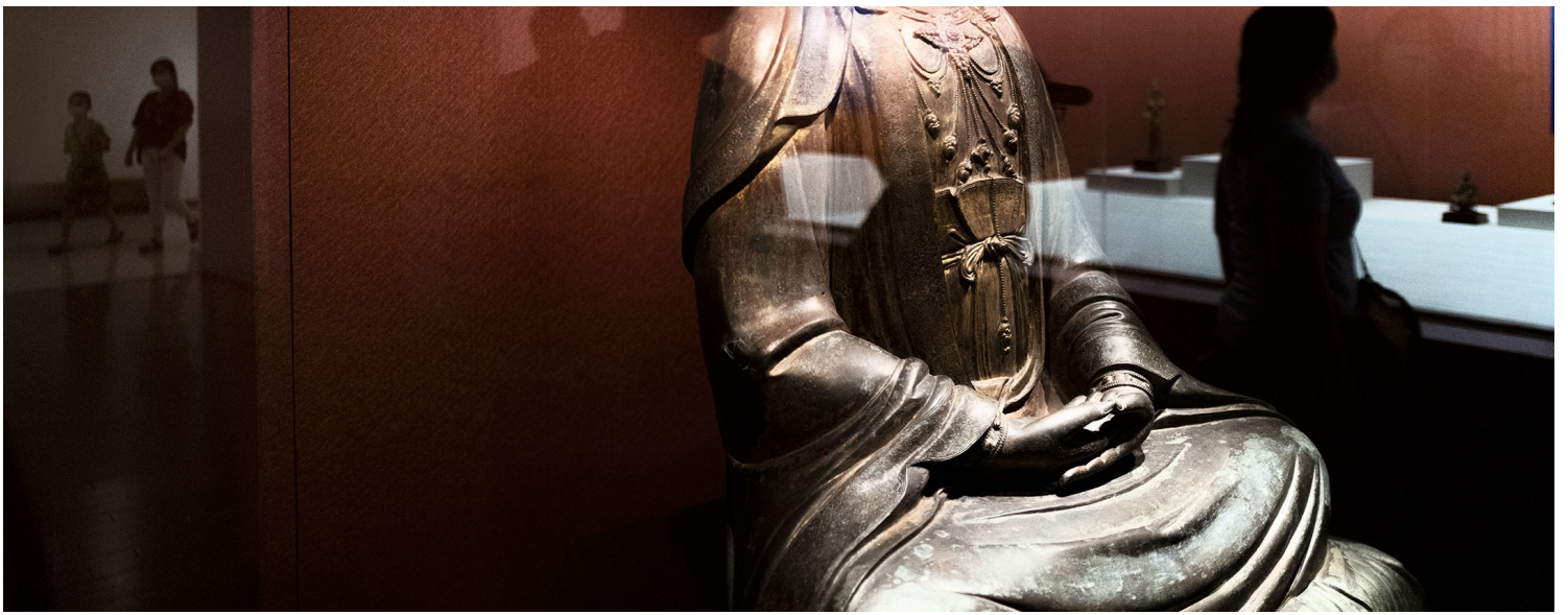
2022年8月28日，台北，国立故宫博物院。

所以网路上绘声绘影的故宫文物撤离台湾终极策略，究竟有几分真实性？文物迁运有其内含危险，只有在能超前部署且具一定把握时才会成行，如抗日时的重庆虽然频受空袭，却因日军陆军无法大规模推进西南地区，得以偏安；而打游击出身的中共，初期对空军、海军掌握很慢，一水之隔的台湾有其天然优势，两次迁运也都不涉及他国。但中国早非吴下阿蒙，其号称全球覆盖的自制东风飞弹更以“东风快递，使命必达”为宣传语，故宫或其他文化资产要在资讯封锁的前提下低调转移他国，且不引发骚动或突袭，可行性实在太低，估计并不会是政府或馆方的选项。