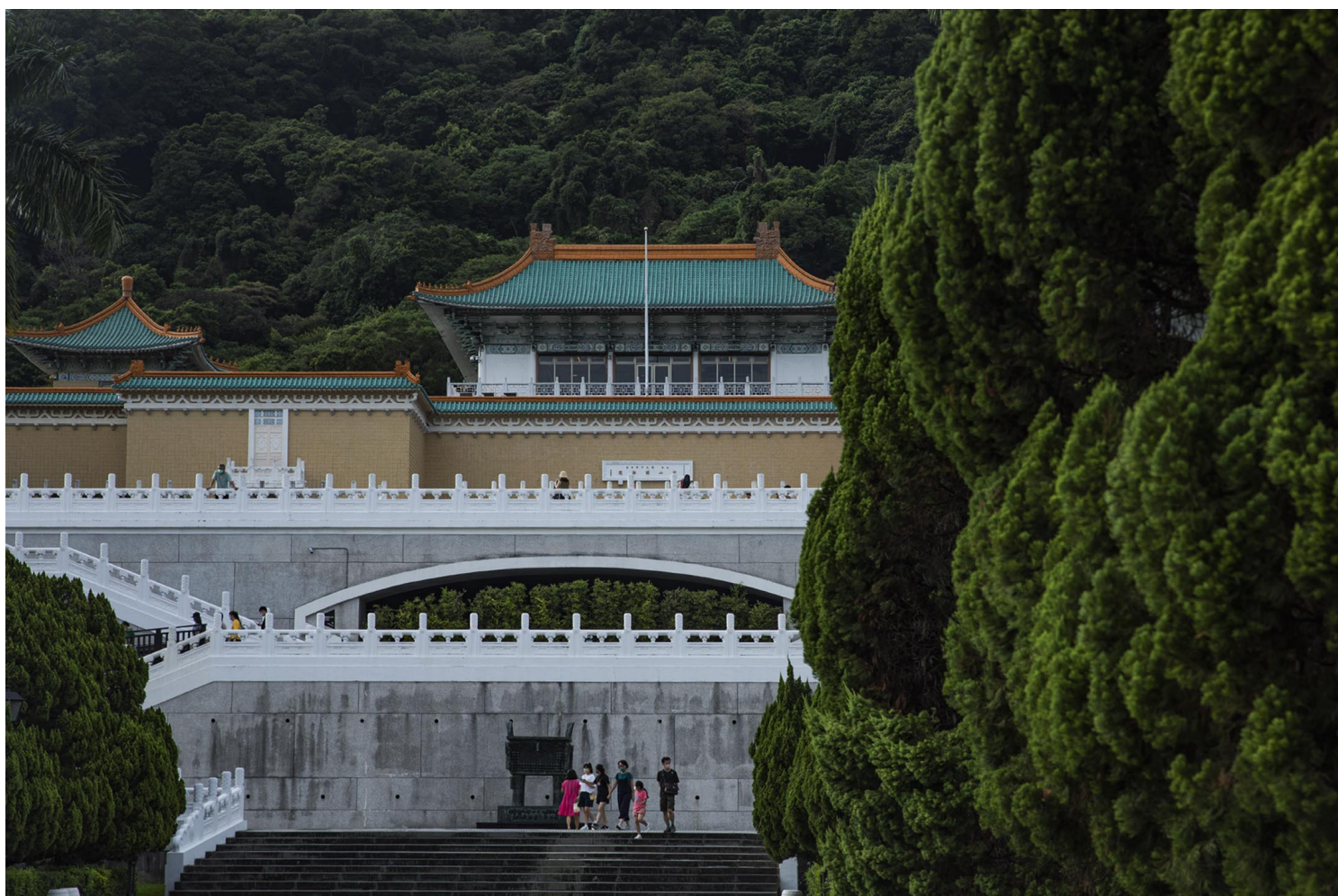
2022年8月28日，台北，国立故宫博物院。

蒋介石政府原是1954年海牙公约的签署者，联合国及联合国教科文组织基于联合国第2758号决议所承认的中华人民共和国则是在2000年加入（accession）公约。因中国称台湾为“叛乱省份”，“台湾问题纯属中国内政”，一旦台海开战，中国按理应援引公约第19条有关缔约国内非国际性武装冲突，采取一切可能措施保护对民族文化遗产具有极大重要性的动产及不动产，所以博物馆、图书馆、文献库，特别是故宫或标记蓝盾标章的馆舍，应该都是挂保证的非战区域，更不用提对岸民众受访时纷纷指路台南延平郡王祠和台北故宫为战时最佳藏身之处。毕竟郑成功是中国官方认可的民族英雄，在认同塑造上举足轻重，岂能轻易以战机或导弹打扰。