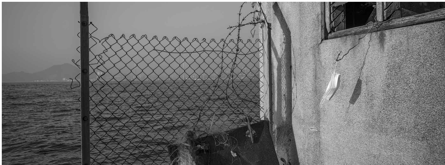
《香港 西环》2021。摄影：余伟建