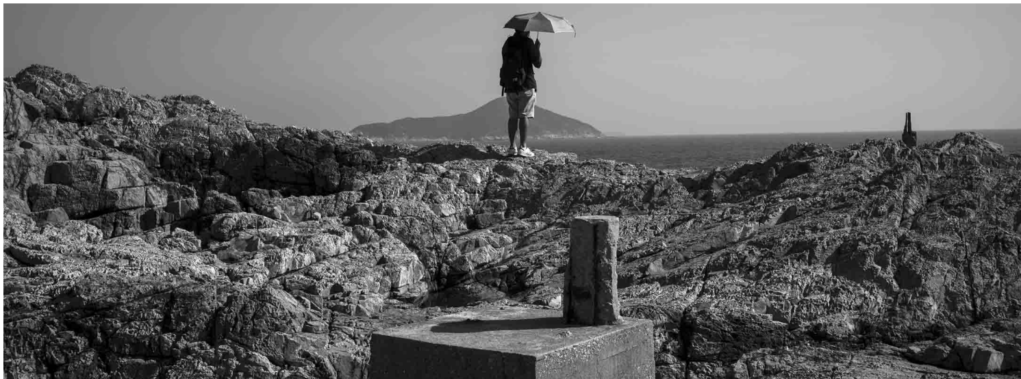
《香港 石澳》2020。摄影：余伟建