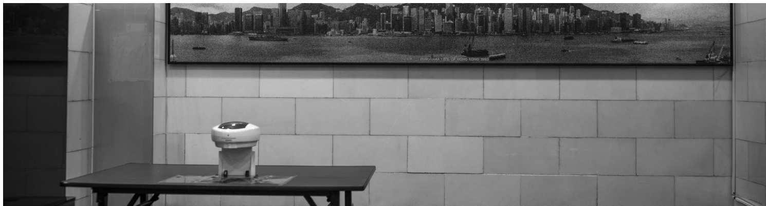
《香港 大会堂》2020。