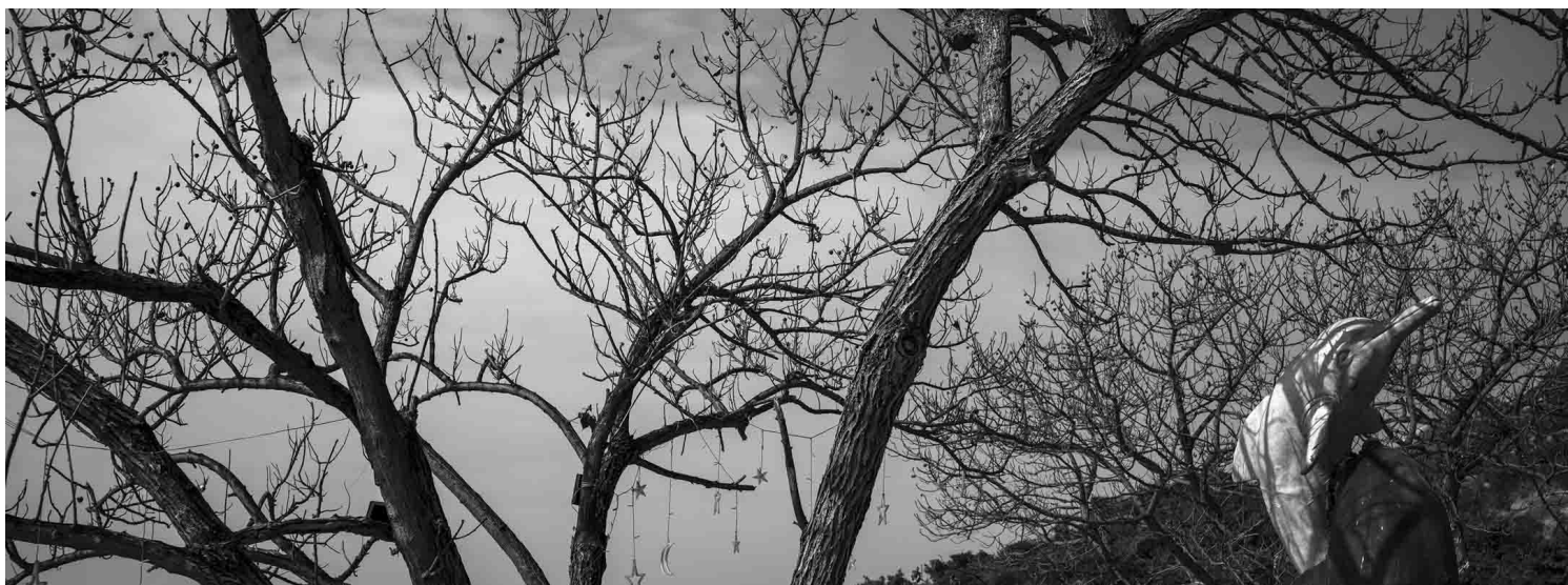
《香港 龙鼓滩》2020。摄影：余伟建