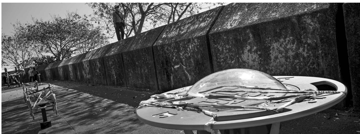
《香港 华富邨》2021。摄影：余伟建

策展人黎健强形容照片令这些景物既捕捉了真实，也像是一首首情感丰富而具表现主义风格的诗篇。