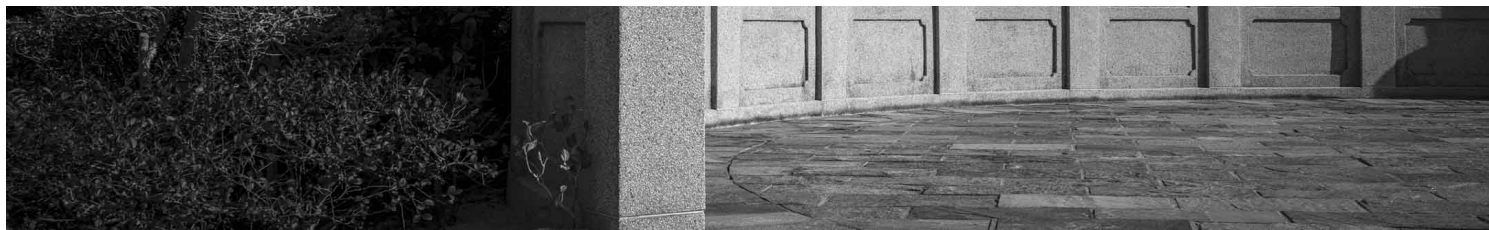
《香港 大屿山》2021。摄影：余伟建