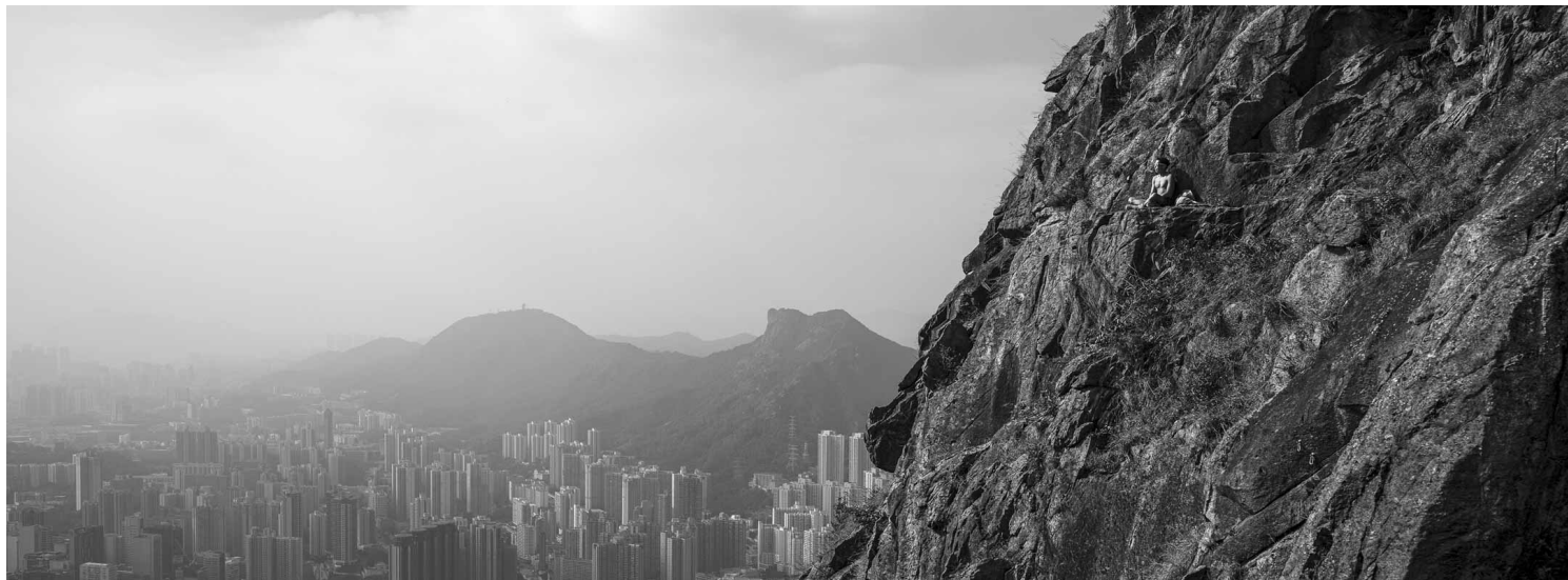
《香港 狮子山》2020。摄影：余伟建