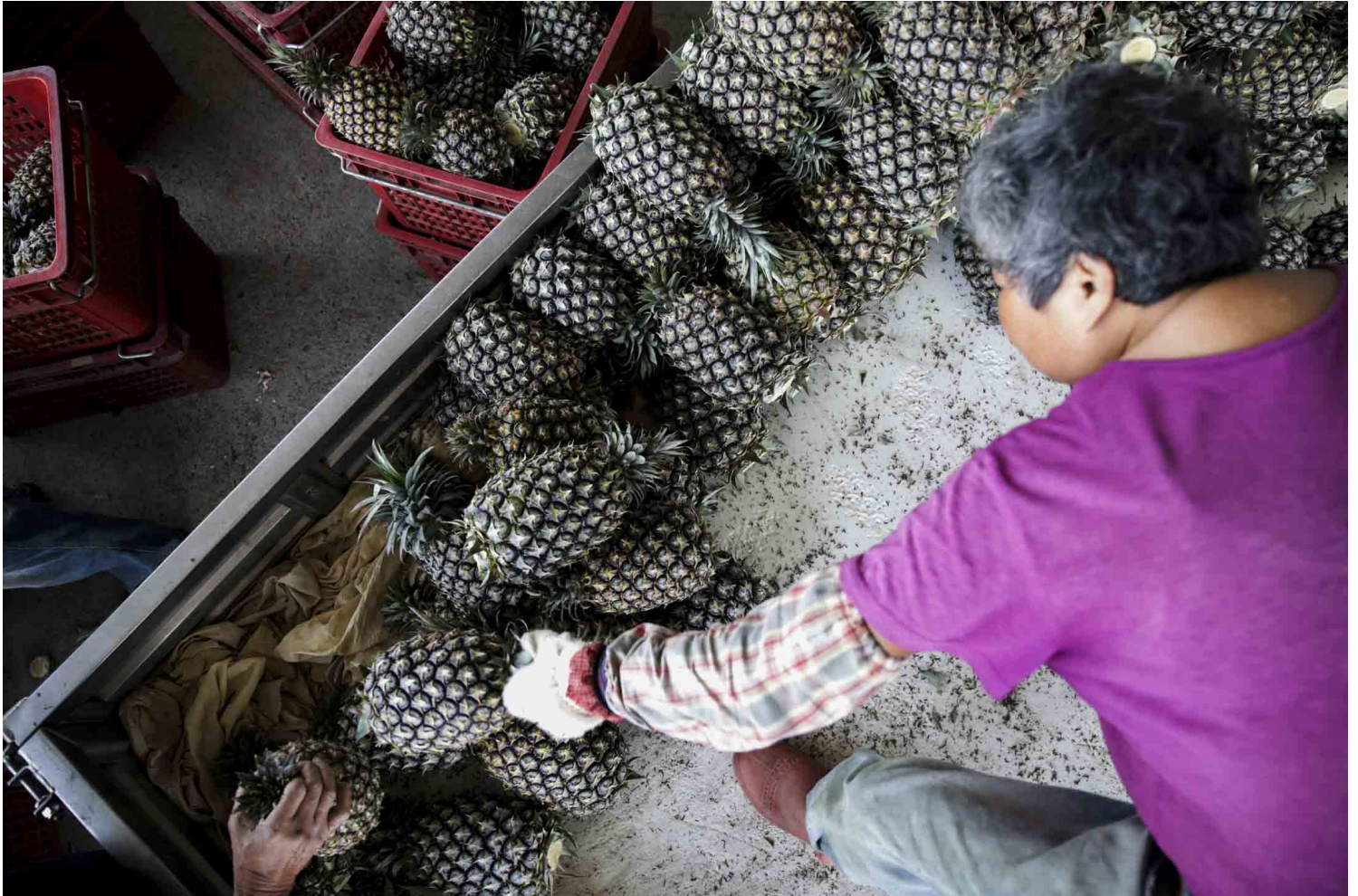
2021年3月4日，台湾南投县的一个配送中心，农民从卡车上卸下收获的风梨。

是以，面对两岸情势的变化，农业部份要调整出口导向思维，转变为“进口替代”；也就是说，台湾首要厘清有哪些农产品需求过度仰赖进口，而哪些生产量又低于安全警戒值——答案很清楚，就是黄小玉当中的玉米、大豆，绝对要优先以国家战略高度的层级审慎看待，把农业资源适度拨补到杂粮的品种研发、单位产量提高、冷链仓储与加工运用；并从国土防卫与国土保安的角度，重新检讨国有农地与林地的使用。