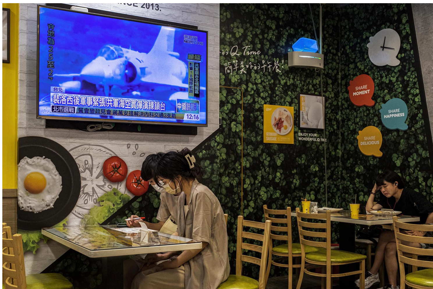
2022年8月4日，台北的一间早餐店，电视新闻播放关于中国在台湾周边进行军事演习的新闻。

在中共祭出这一系列制裁手段后，其背后的政治意涵以及对两岸经济交流，会产生什么样的冲击与影响，以及台湾将如何自处，特别是农业部门要有什么样的战略布局，实有必要深入爬梳与探讨。