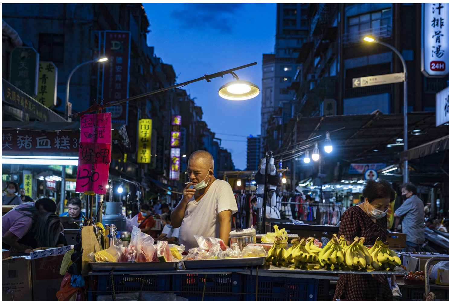
2022年8月17日，台北龙山寺，一个街头的水果摊。

最后，台湾农业部门除了要面对内部产业结构的调整，也要积极地长远布局，一旦国内出现不可预期的战争风险，民生食物的供给，是否有全盘的掌握与了解，这部分更有赖跨部会的资源整合，让战时的食品供应能够更臻完善，将战争对一般民众的冲击降到最低。譬如，食物供应站的开设、食品物资的调度等，这些恐怕都得放在日后的万安演习中加强演练，以提升台湾人民居安思危的意识，方能共同面对战争危机的到来。