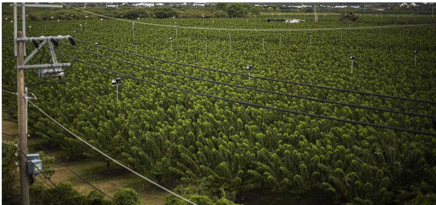
2021年11月18日台东，一个释迦果园。