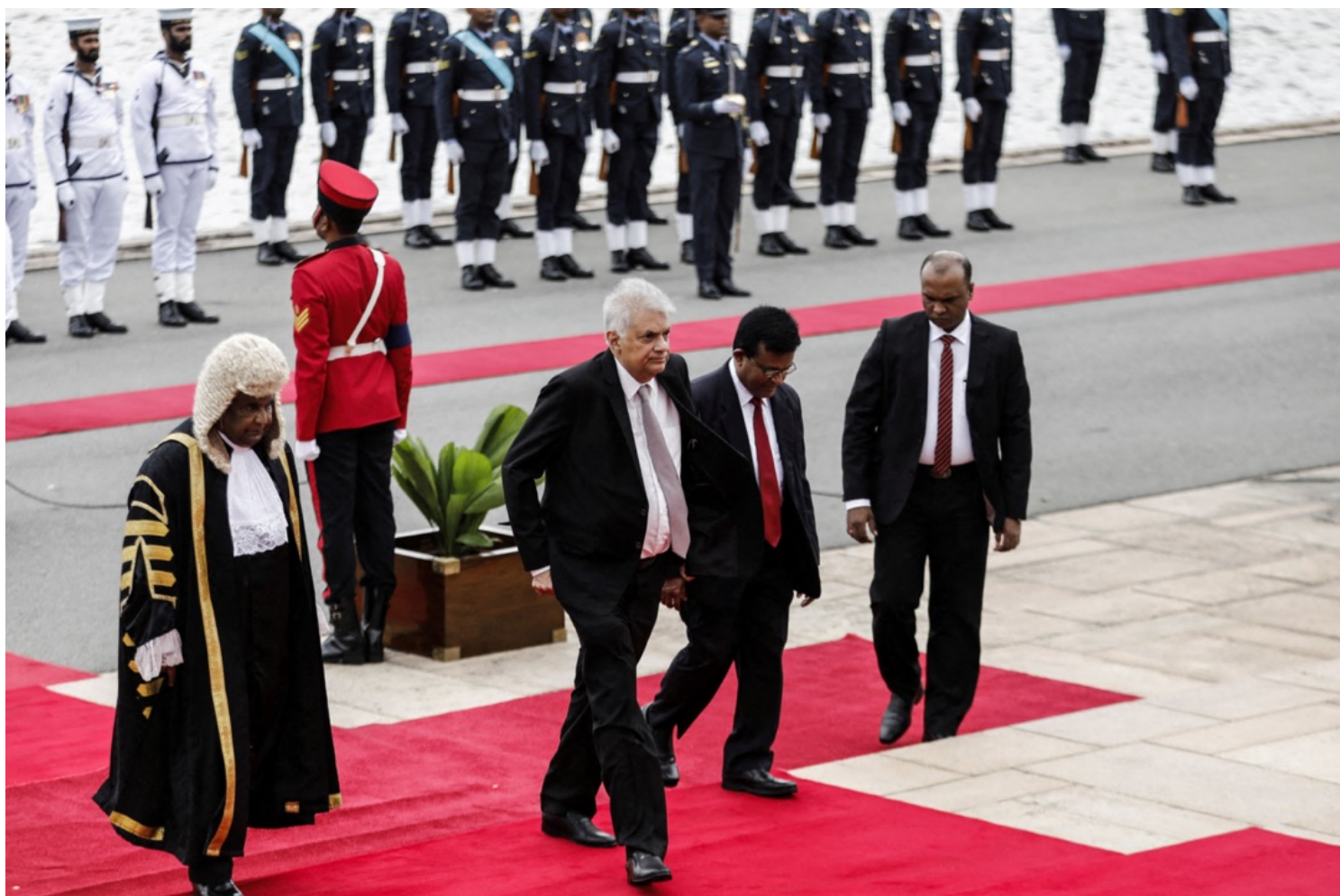
2022年8月3日，斯里兰卡城市科伦坡，新任总统维克拉马辛哈前往就职典礼。