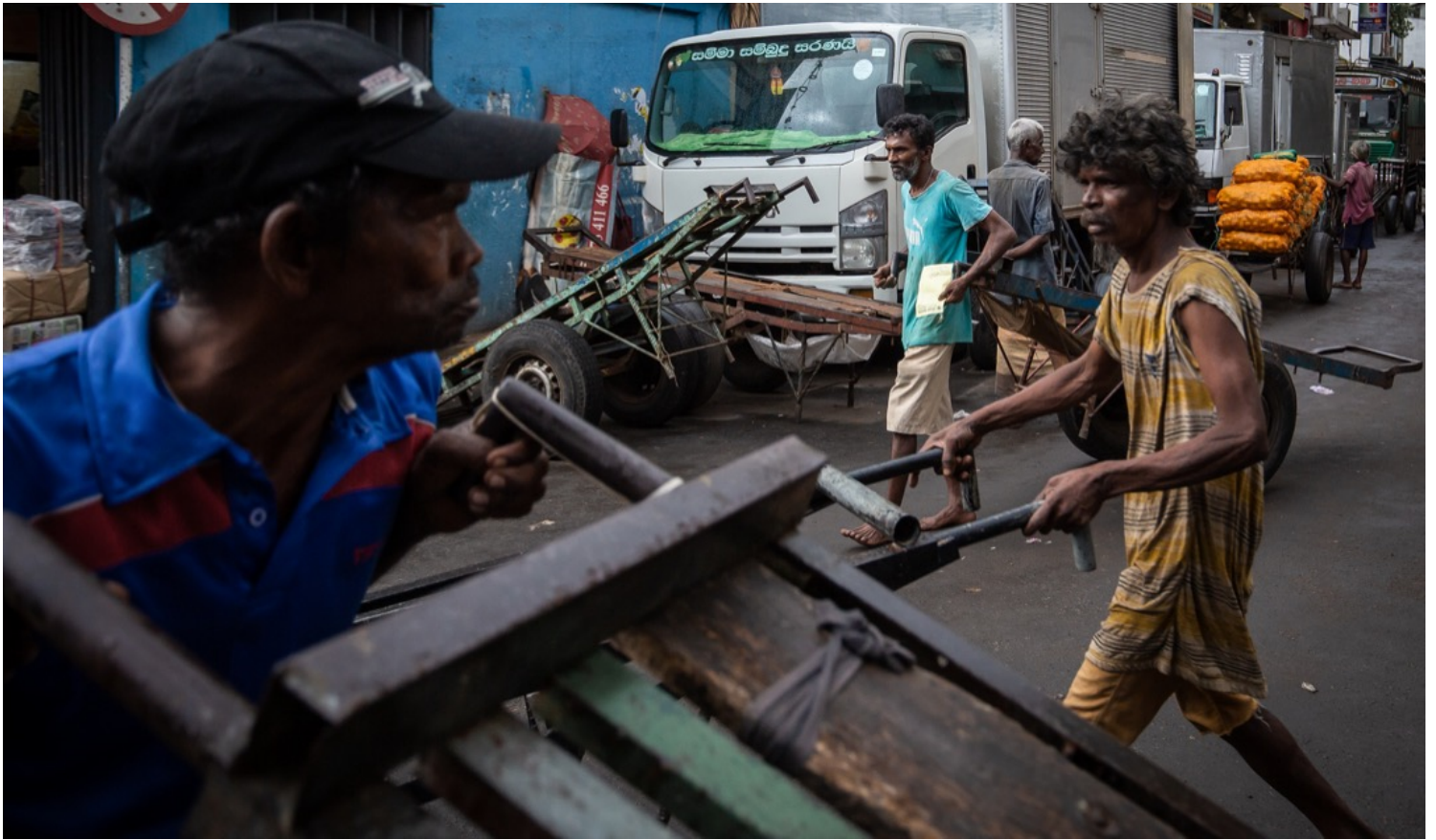
2022年7月18日，斯里兰卡城市科伦坡，市民在市场推著手推车找工作。

这也是维克拉马辛哈政府所面临的最紧要的难题。几乎是在政府镇压抗议的同时，世界银行和国际货币基金组织表示，将不会于短期内对斯里兰卡提供援助。