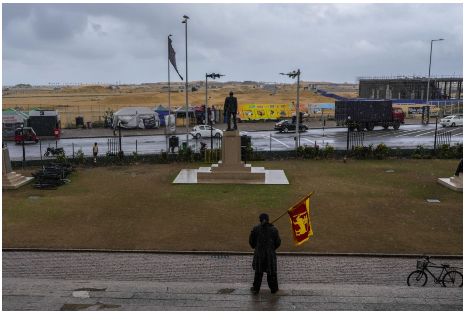
2022年7月21日，斯里兰卡城市科伦坡，一名示威者在总统府前手持斯里兰卡国旗。

德杜瓦格也有同样的感受。“不同于世界上其他国家的人民抗议，斯里兰卡的中产阶级、甚至是上层阶级在一定程度上都在运动中发挥了较大的作用，”他说，致命的经济危机影响到了每一个人的日常生活，城市中产阶级罕见地参与到了运动中来。