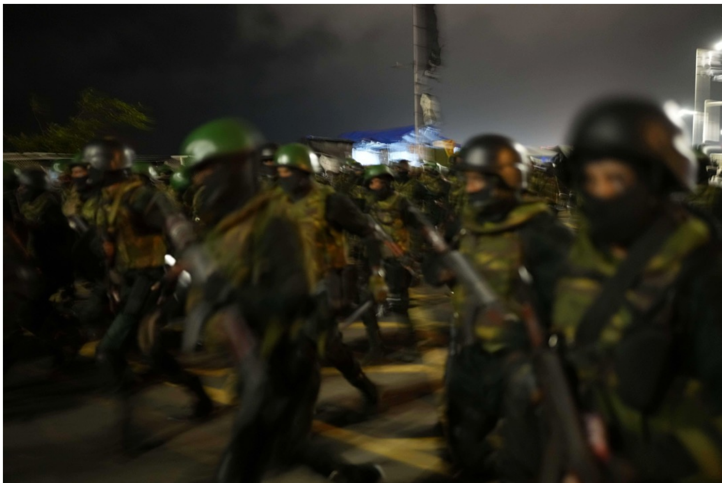
2022年7月22日，斯里兰卡城市科伦坡，军队深夜到“抗议村”移除帐幕并拘捕示威者。

虽然维克拉马辛哈也曾在7月13日承诺将辞去总理职位，但在前总统拉贾帕克萨离开斯里兰卡后，他很快被任命为代理总统，作为代理总统，他立即宣布国家进入紧急状态，并命令警察和军队采取必要的措施来恢复和平，允许军队拘留民众，限制公众集会和搜查私人财产。