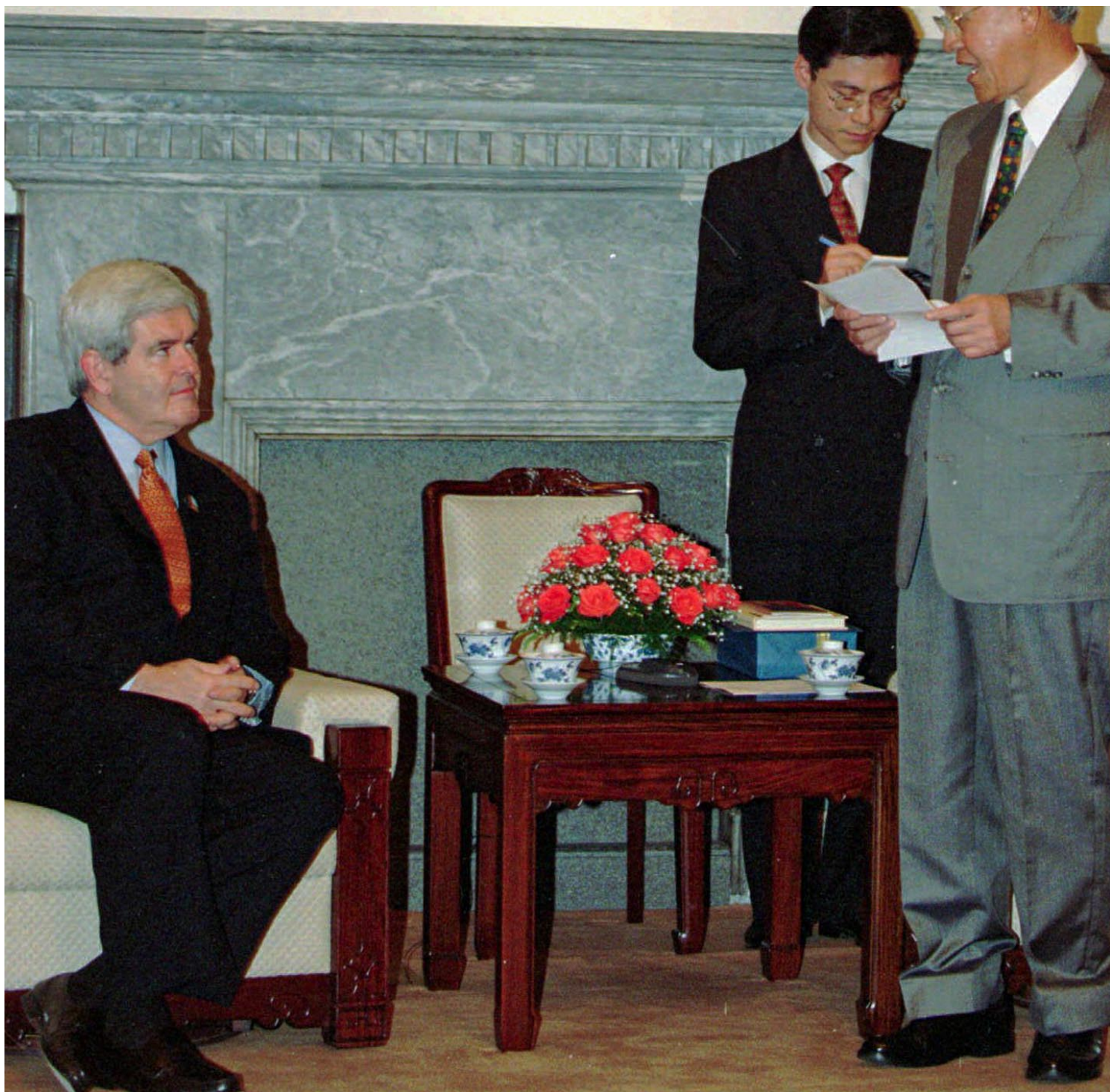
1997年4月2日，美国众议院议长金瑞契（左）听取台湾总统李登辉（右）的欢迎辞。