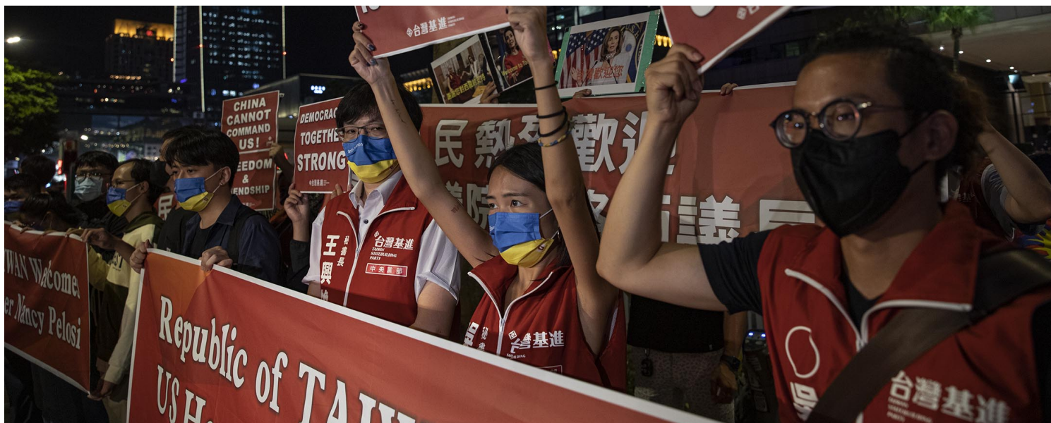
2022年8月2日，台北君悦酒店外，基进党欢迎佩洛西访台。