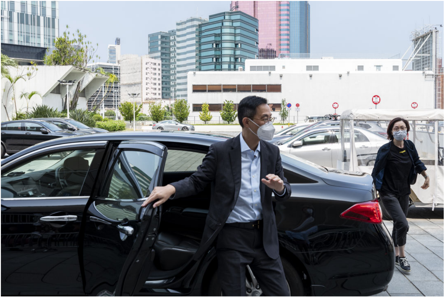
文化体育及旅游局局长杨润雄于MIRROR演唱会巨型LED荧幕坠下严重意外后翌日，到红馆视察。

Libby说安全报告一般由康文署经理接收。她质疑报告有否考虑到装置在活动状态下是否安全，亦不知道接收报告和进行实地考察的政府人员对舞台有多了解：“东西都挂到天花版上了，他们能看到多少？”