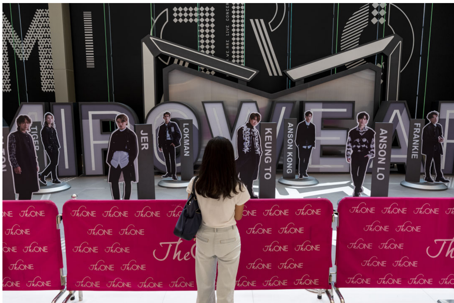
2022年7月29日，MIRROR演唱会巨型显示屏高处跌下意外后，有关MIRROR的活动全部取消。

陈颖业说外国有法例规管，工作台超过某个高度就必须设有扶手。但他警告，这可能会变相限制创作自由，认为任何规管都应该具有弹性。比如美国加州规定，离地30吋以上的开放式工作台而必须配有栏杆，但舞台装置可豁免。美国国家标准协会指出，栏杆可能会影响舞台观感，但建议可在公开演出以外时间使用，减低表演者跌伤风险。