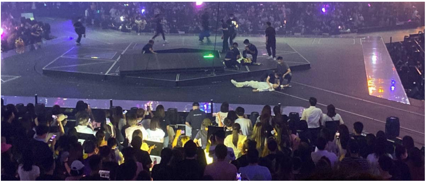
2022年7月28日，香港，MIRROR演唱会进行期间，巨型显示屏突然从高处跌下，击中台上的舞蹈员。网上图片