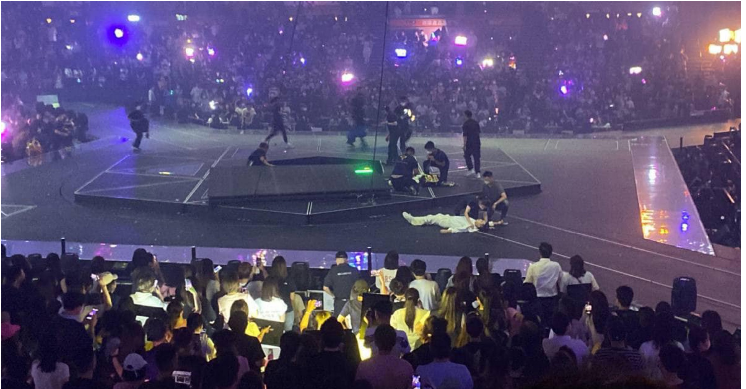
2022年7月28日，香港，MIRROR演唱会进行期间，巨型显示屏突然从高处跌下，击中台上的舞蹈员。