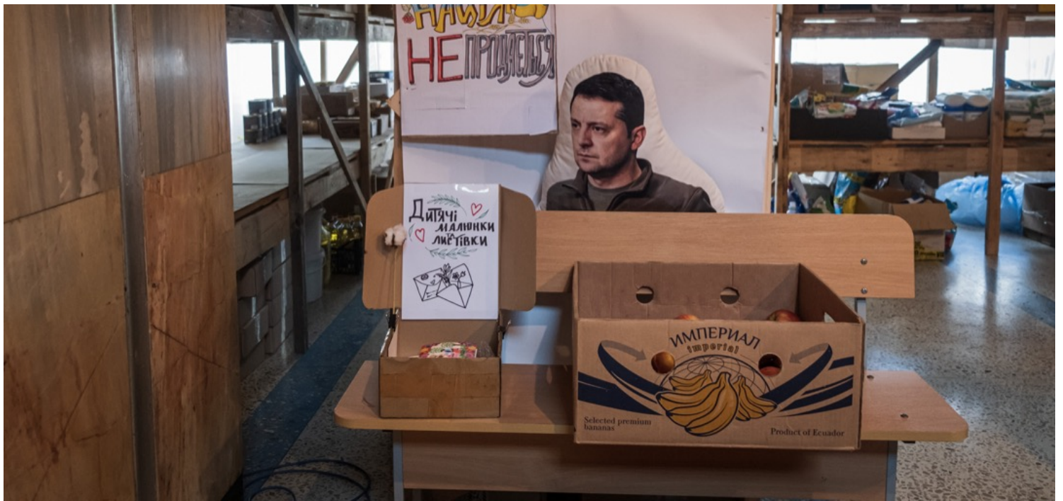
2022年5月19日，乌克兰港口城市敖德萨，一个物资中心内摆放著一个总统泽连斯基的公仔。