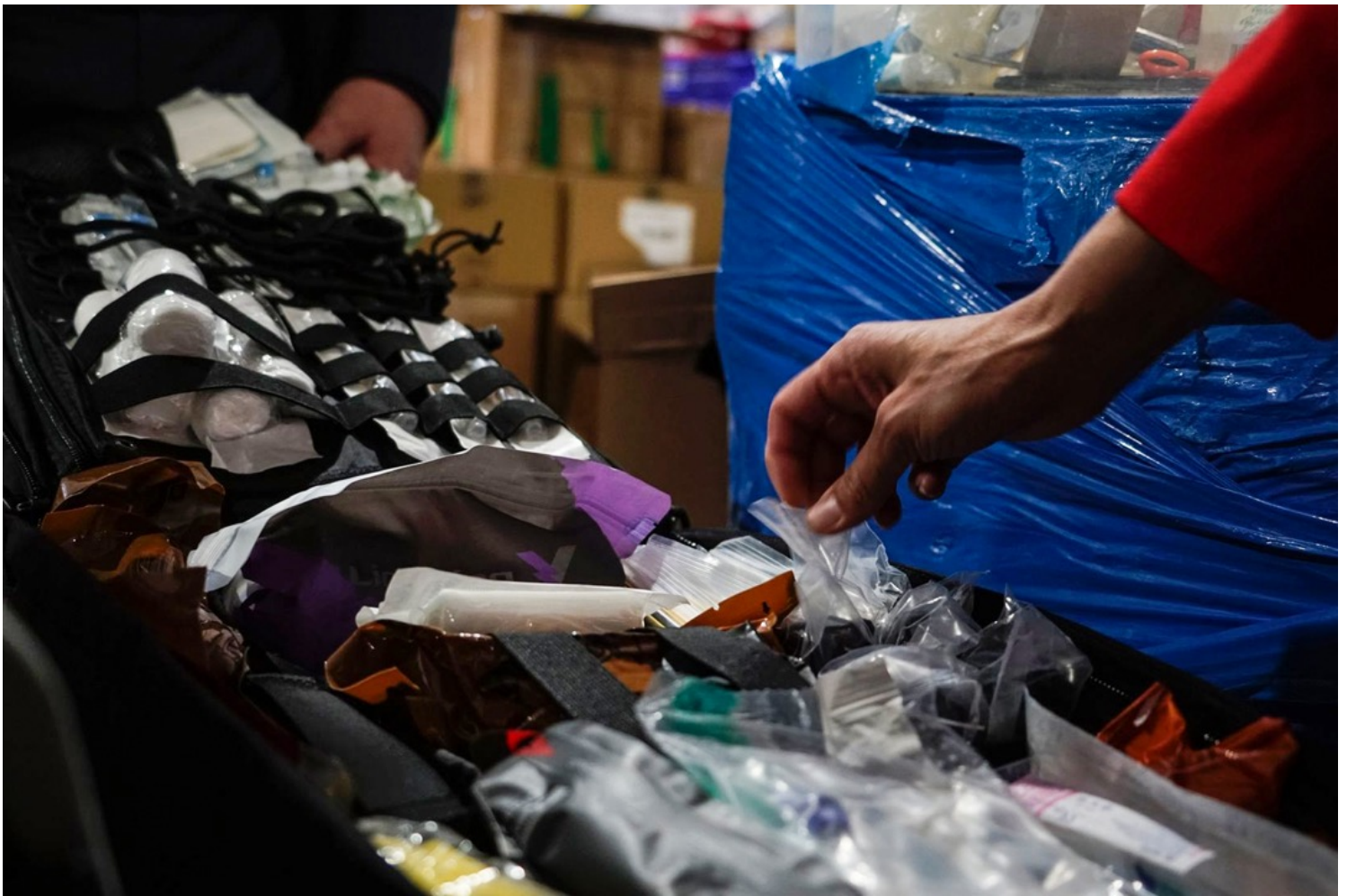
Olena（化名）在仓库里提供给前线军人的物资区，展示送往前线的创伤急救箱，包括止血带和创伤绷带等。