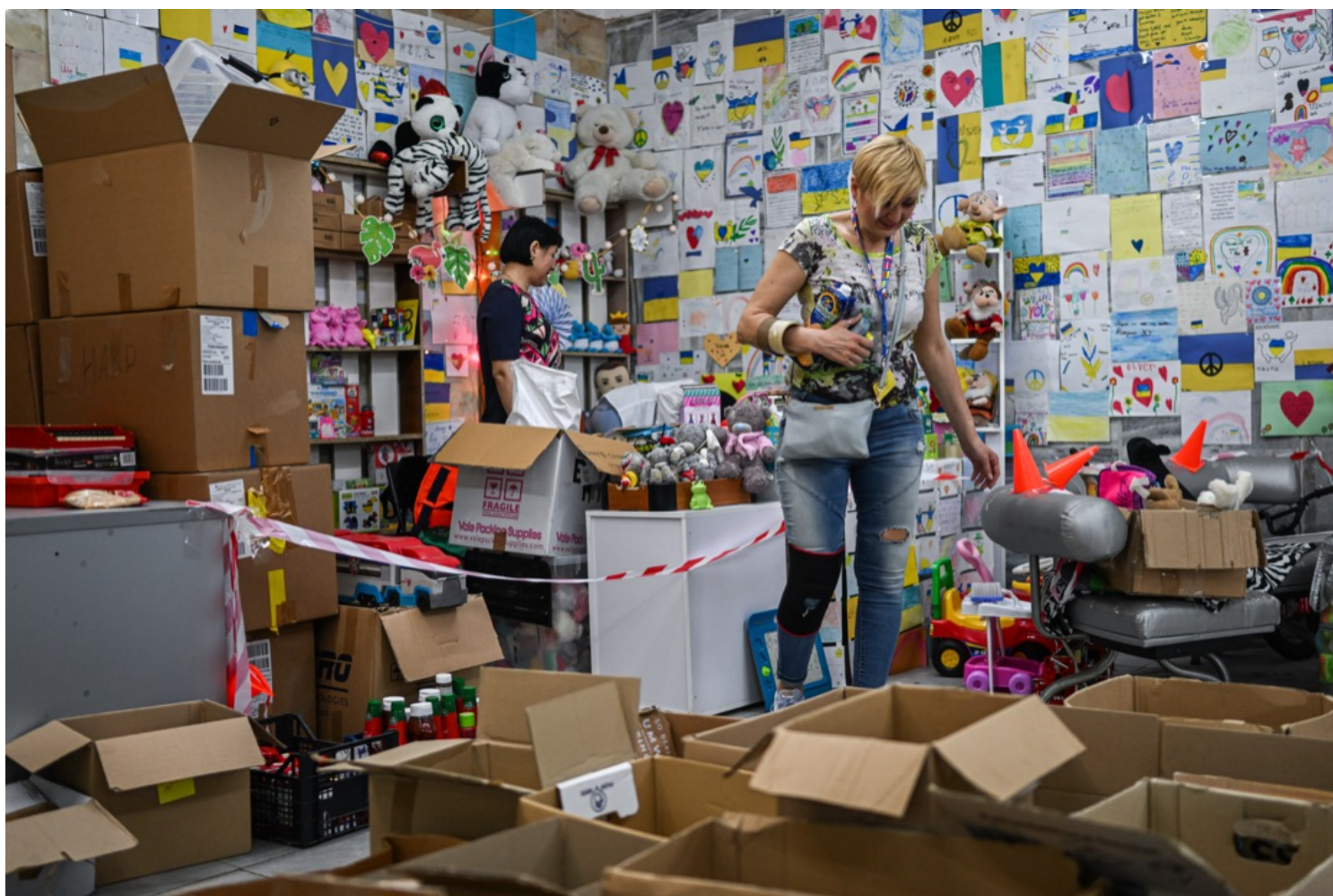
2022年5月12日，乌克兰西部城市利沃夫，义工在物资分配站内工作，墙上贴满为乌克兰打气的心意卡。