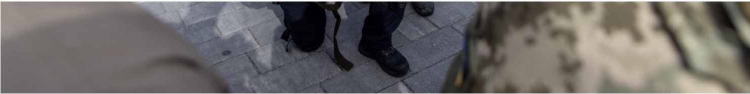
2022年3月9日，乌克兰首都基辅，当地领土防卫队成员学习使用一次性手持反坦克导弹。

“这可以从二战后的历史来看，德国和同样是战败国的日本，一直以来努力和过去的军事历史划清界线，对于运送军武到冲突地区都相对保守严谨。”特雷贝施解释，二战后许多当时主要的参战国家，对输出军武、介入战争都有非常严谨的规范。例如德国就因各党派部会在提供乌国重型武器难以达成共识。