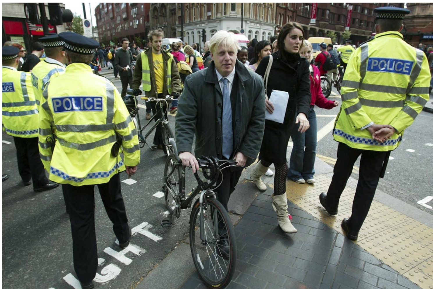
2003年5月1日，英国保守党议员约翰逊在伦敦街上。

在约翰逊的笔下，欧盟的官僚是贪婪和不负责任的。欧盟将禁止英国商店出售虾味的薯片、将蜗牛定义为一种鱼、禁止牛津大学雇佣宗教学者。这是英国小报的一项传统，这些报道在细节上无可挑剔，但这些细节所构成的事实是错的。无论如何，约翰逊把欧盟描述为一个让法国和德国为自己的利益而统治欧洲的计划，而“头脑糊涂”的英国领导人默许他们这么做。