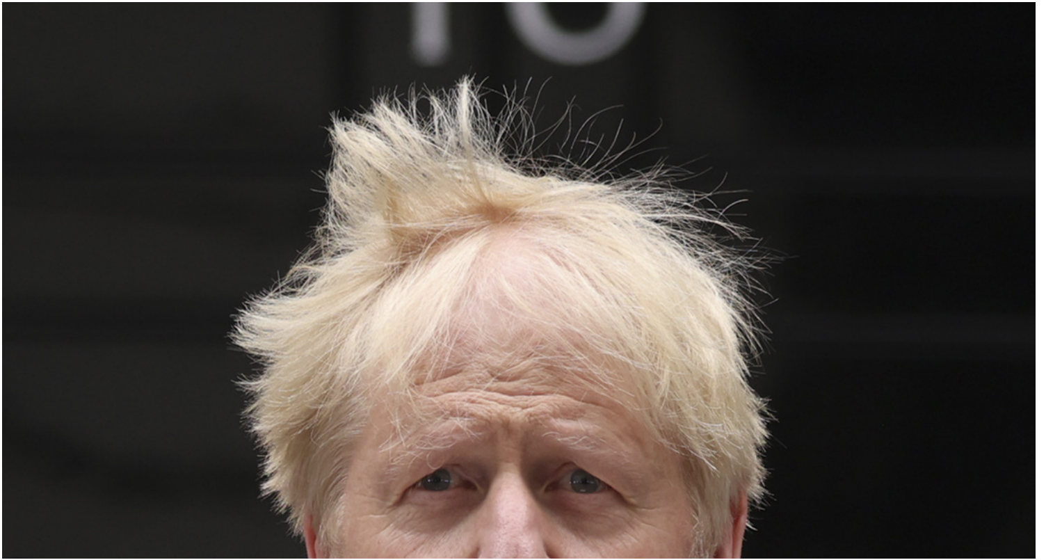
2022年7月7日，英国首相约翰逊在唐宁街 10 号外宣布辞职时向全国发表讲话。

但是，约翰逊的下台并没有解决问题。当未来新首相出现时，这些问题仍将存在：通货膨胀和生活成本危机；北爱尔兰协议的混乱以及爱尔兰和平进程的崩溃；即将到来的衰退；贸易逆差和疲软的公共财政；罢工和短缺；长期支持乌克兰和下一波可能到来的疫情。现在保守党内参加竞选的人没有任何人提出可以解决这些问题的方案。