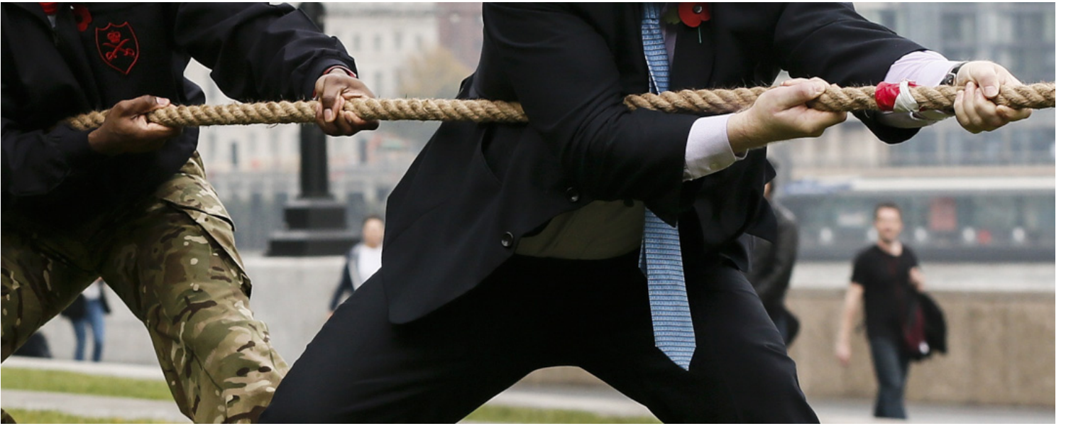
2015年10月27日，伦敦市长约翰逊参加伦敦罂粟日街头募捐活动，旨在为退役军人及其家属服务。并与武装部队成员的拔河比赛。

“我一生都投票给工党。（但它）一直都说一些虚假的承诺”。他们或许并不完全支持约翰逊，但至少他看起来那么坦诚。