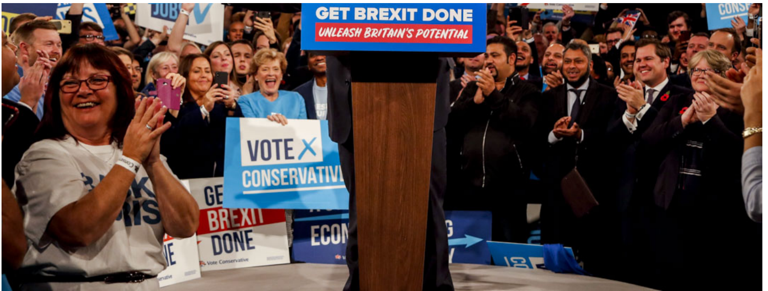
2019年11月6日，英国首相约翰逊在英国伯明翰举行的执政保守党竞选活动中发表讲话。

尽管保守党主席在败选后很快辞职并称“我们不能继续这样下去”，约翰逊仍然保持了一种奇怪的乐观。在不信任投票结束后，他称这一结果“非常好”。几周之后，他甚至在卢旺达表示“他正在积极考虑第三个任期”。