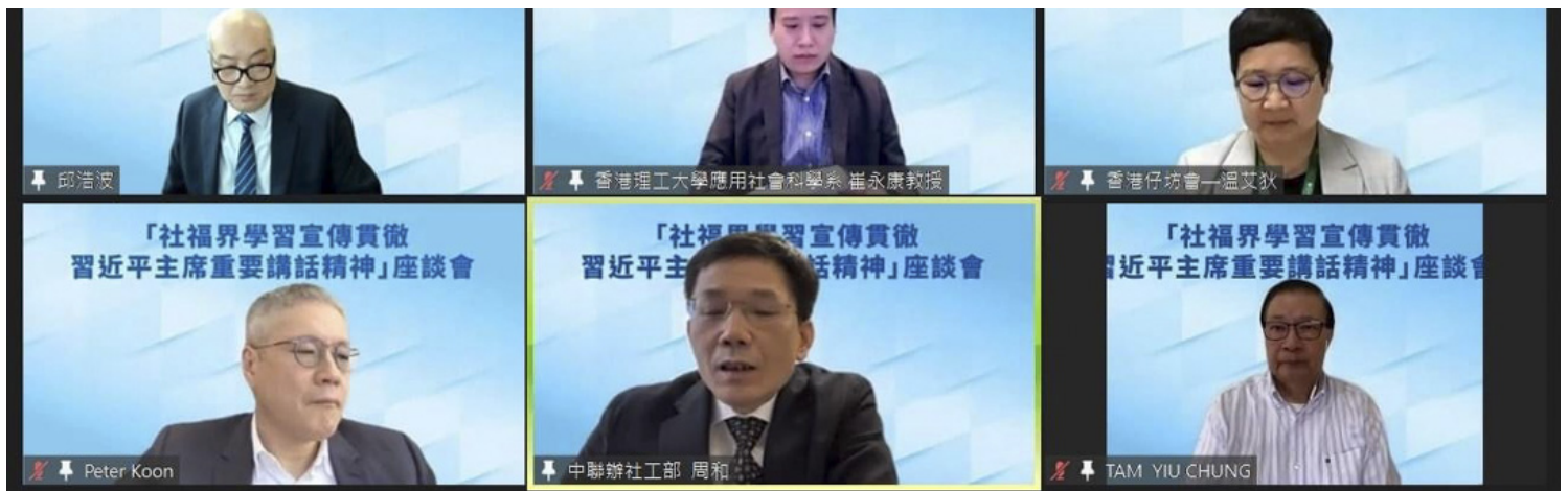
“社福界学习宣传贯彻习近平主席重要讲话精神”线上座谈会。