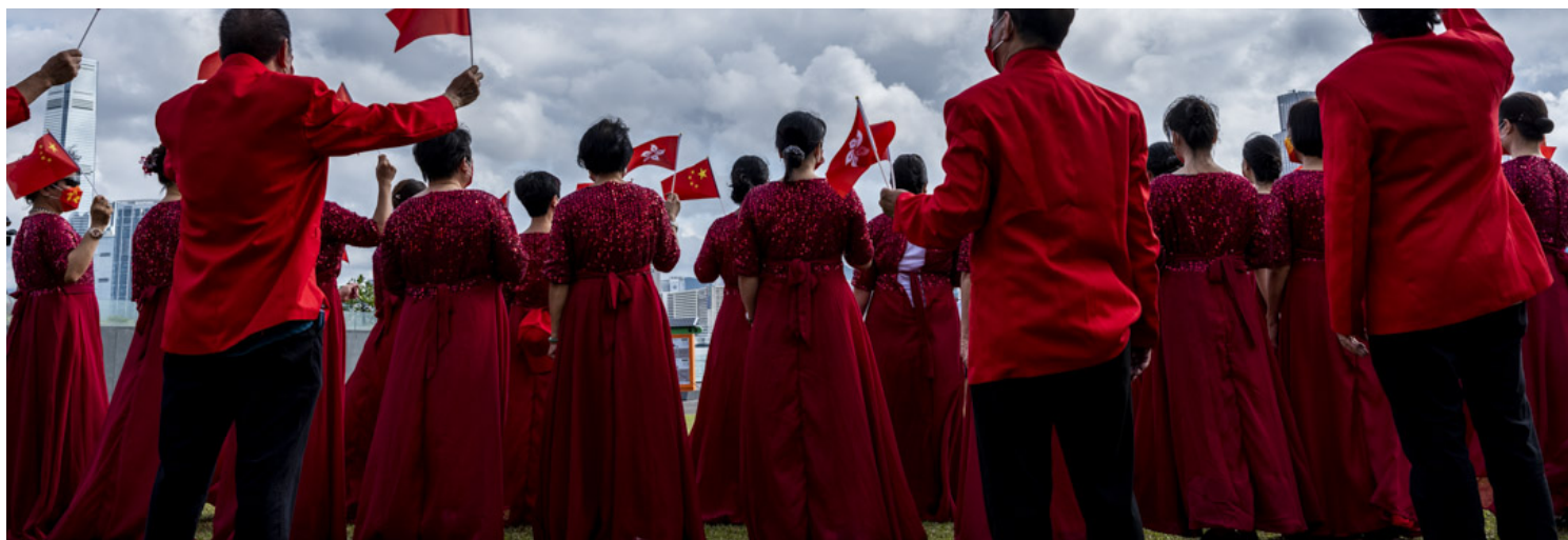
2022年6月29日，金钟添马公园有爱国的市民举行活动，庆祝回归25周年。