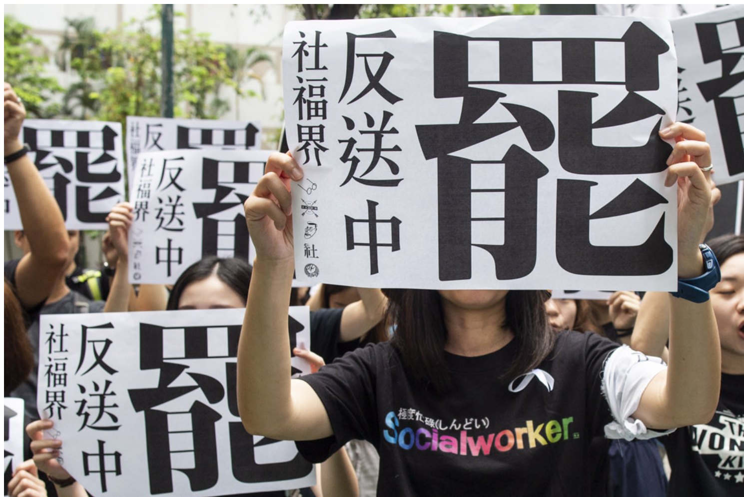
2019年6月17日，反修例运动期间，社福界发起的罢工行动。

翻查资料，2017年习近平访港，出席一系列主权移交20周年活动、第五届政府的就职典礼和检阅解放军驻港部队，当时中联办主任王志民与全国政协副主席董建华、梁振英会面时，曾“分享”学习习近平视察香港期间发言的心得体会。多名建制派人士当时虽曾于接受访问时表达对习近平发言的解读，但未如今次般大规模举办“习精神学习班”。