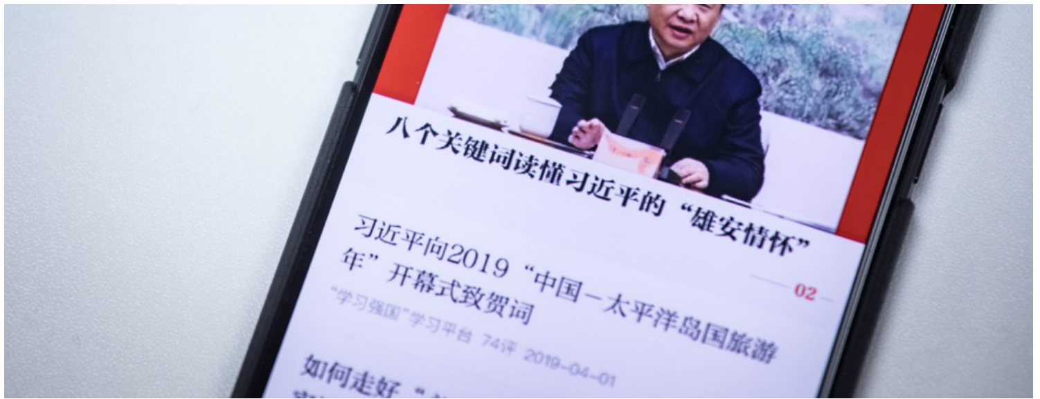
“学习强国”手机程式的首页，显示着一则又一则与习近平有关的文章。