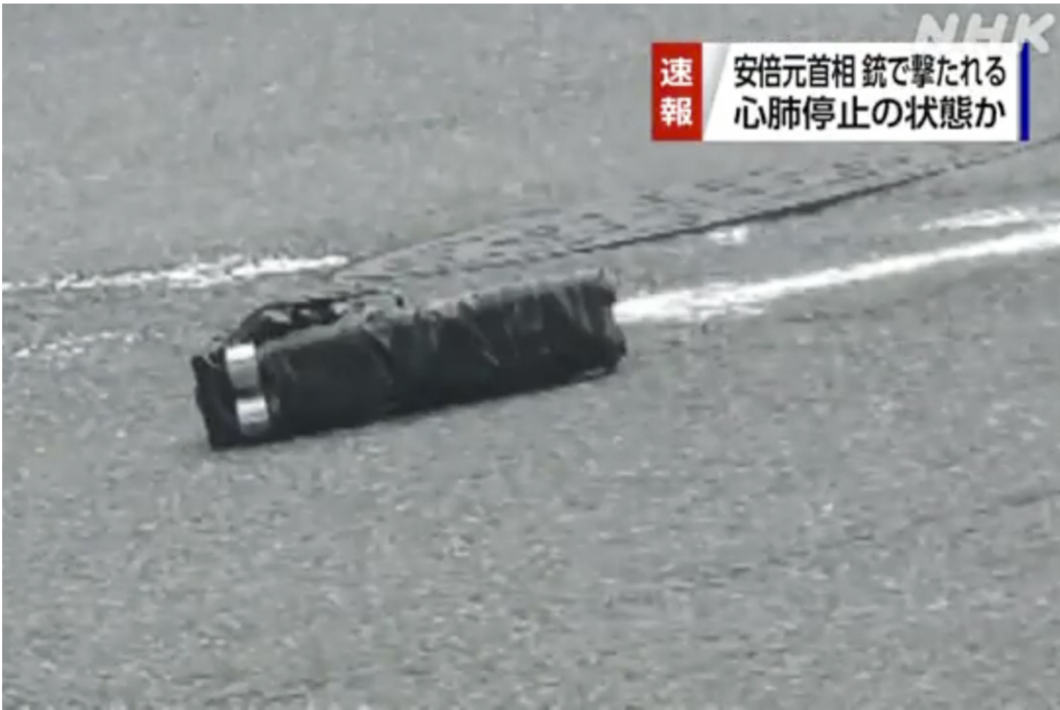
有分析认为嫌犯犯罪的枪枝可能是自制拼装枪枝。影片截图

得知消息后，首相岸田文雄取消活动急返东京，批评刺杀行为是动摇民主制度的卑劣行为。日本记者质疑安保工作，岸田指相信工作人员已经尽责。