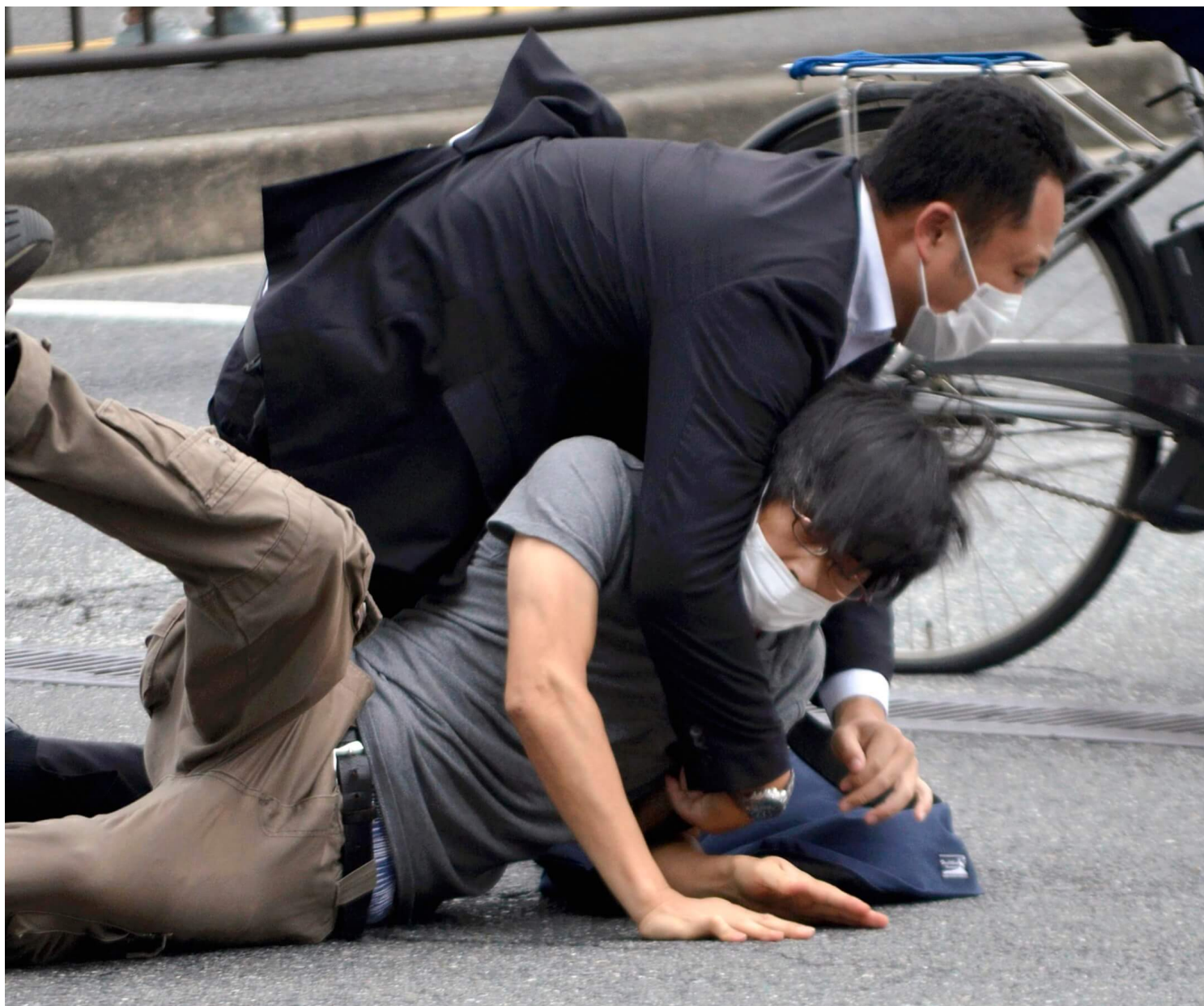
2022年7月8日，日本奈良市，前首相安倍晋三进行拉票活动期间遭枪击倒地，在场保安制服一名疑犯。

日本媒体一度在犯罪枪枝是手枪还是霰弹枪上犹豫，因为日本有严格的枪枝管理，一般人无法持有手枪，只能持有猎枪或气枪。而根据影片截图，虽然枪声巨大，但枪枝大小似乎介于一般手枪和猎枪之间，所以有分析认为可能是自制拼装枪枝。有关信息仍待日本警方进一步确定。