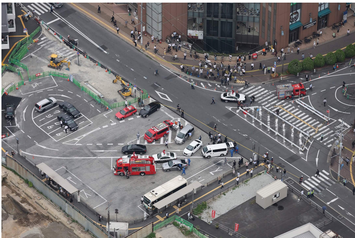
2022年7月8日，日本奈良市，前首相安倍晋三发表演说时中枪倒地后，警员封锁事发范围。

根据日本警察厅的统计，2021年间共发生10起枪械射击刑事事件，造成5人受伤1人死亡。