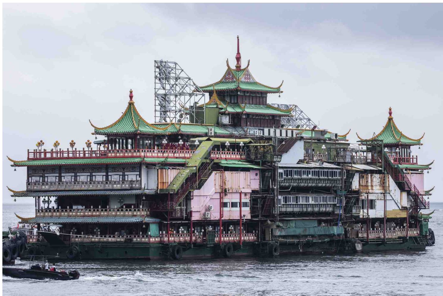
2022年6月14日，有逾70年历史的珍宝海鲜舫于接近中午12时，由多艘护航船拖走离开香港仔。

即便如此，“太白”却于同年因应香港仔海傍填海兴建的高速公路，与“珍宝”和“海角皇宫”一同由香港仔避风塘迁移至深湾。珍宝集团更于1980年代收购“太白”和“海角皇宫”，吸引不少中外名人到访。直至1997年“海角”结业，“珍宝”和“太白”才于2003年进行翻新，并合称为“珍宝王国”。