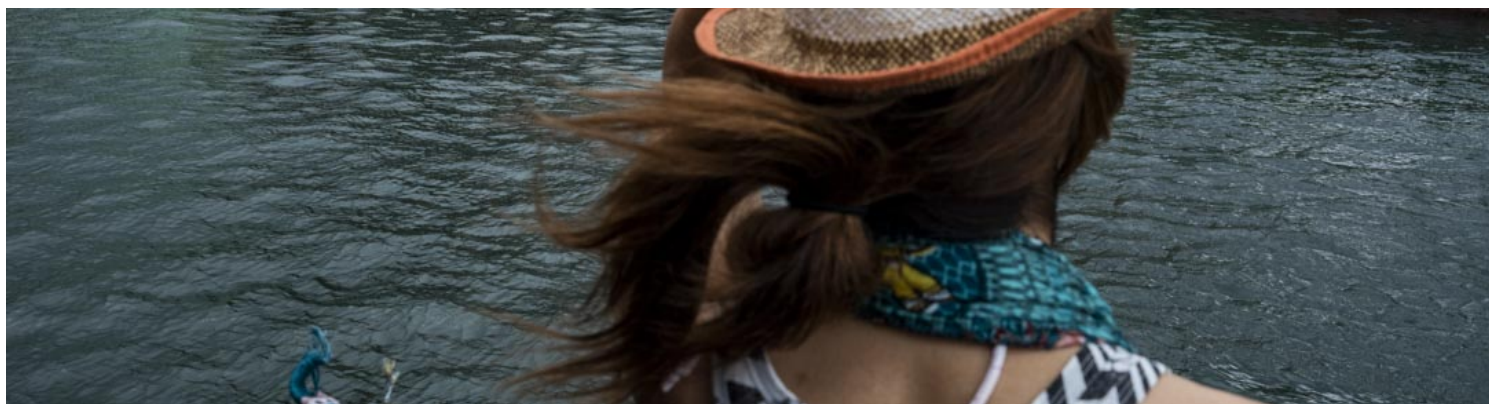
2022年6月2日，附属于珍宝海鲜舫的厨房趸船，入水倾侧。

18日下午，南海最高风速为每小时35公里（约等于18.8海里）。根据香港天文台测量航运天气的蒲福氏风级表，风势为“清劲”，海面状态为中浪，平均浪高为2米左右。联合国ESCAP/WMO台风委员会气象专家、“香港地下天文台台长”方志刚向端传媒亦表示，据数据所示海面不算大浪，但对于平底船来说，“其实已很危险”。