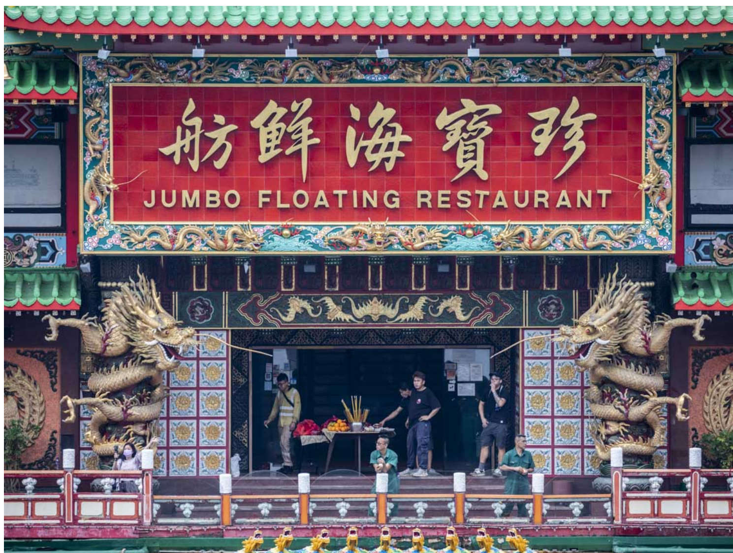
2022年6月14日，珍宝海鲜舫于接近中午12时，由多艘护航船拖走离开香港仔，船上的工作人员。

端传媒翻查梳理有份拖离珍宝的船舶资料、采访行内业者及综合多方意见，尝试解开沉船背后种种谜团。