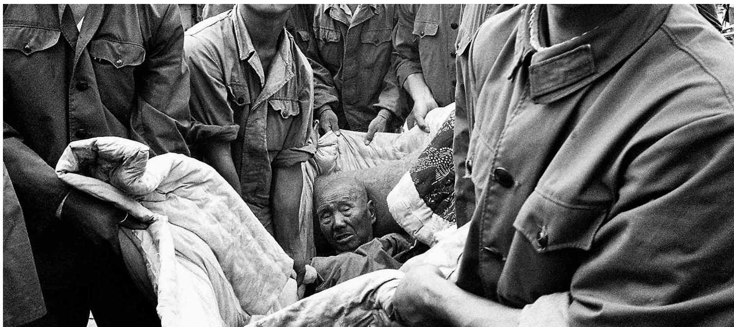
1976年7月28日，唐山大地震后，解放军将一名受伤的年长男子抱在被子里。