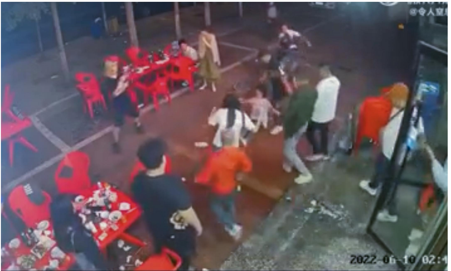
2022年6月10日，河北唐山机场路一家烧烤店发生冲突，多名男子对女子进行殴打。