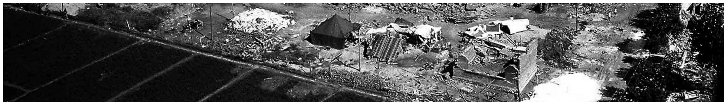
1976年7月28日，唐山大地震后，唐山郊区政府农业中心的废墟。