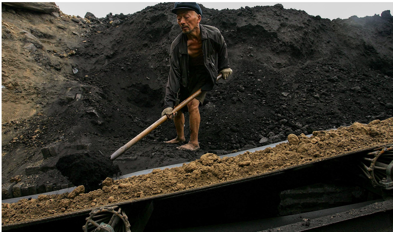
2006年6月3日，唐山市的一家砖厂，一名中国工人将煤铲到传送带上。