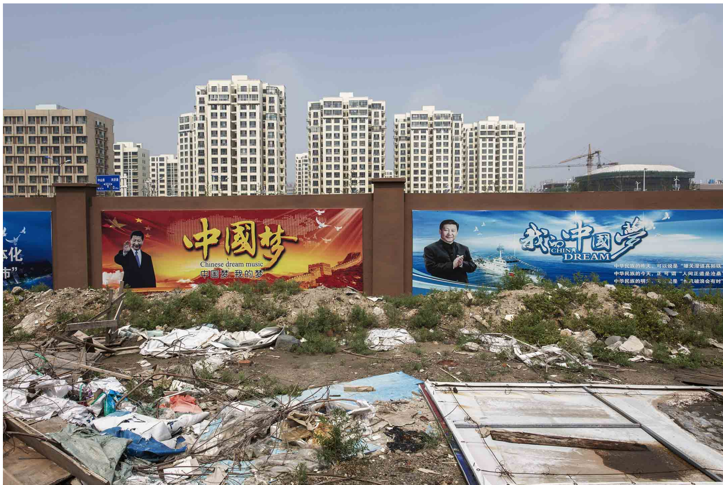
2016年8月10日，唐山市，墙上挂着一张中国国家主席习近平的海报。