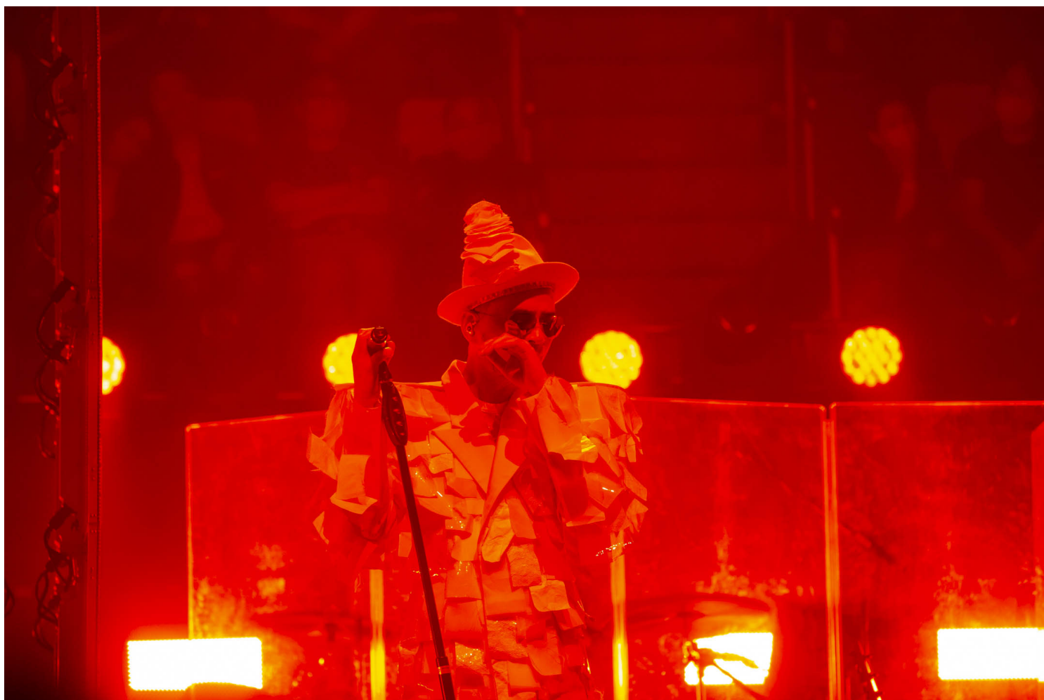
黄耀明在2020年达明演唱会。

“2022年卓越新闻奖”揭晓，端传媒获“卓越女性议题报道奖”、“卓越艺术及文化报道奖”及“卓越突发新闻奖”等五项大奖。