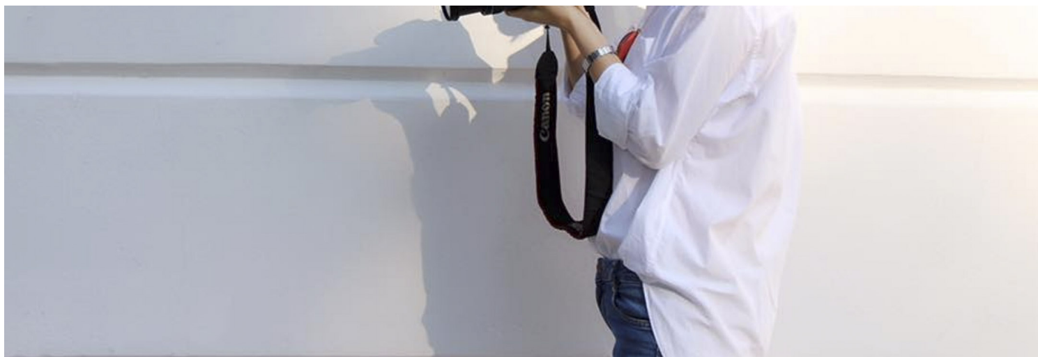
中国独立调查记者、女权行动者黄雪琴。