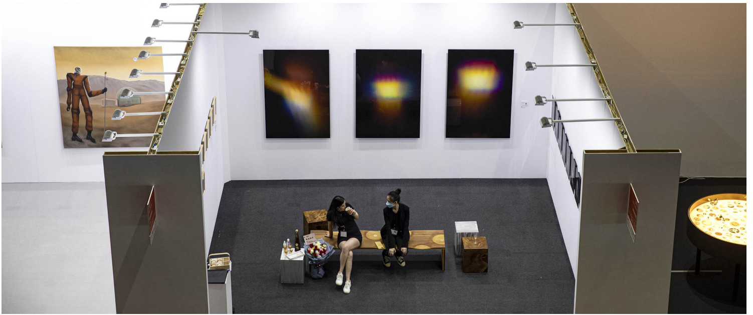
2022年5月19日，台北世界贸易中心，台北当代艺术博览会。