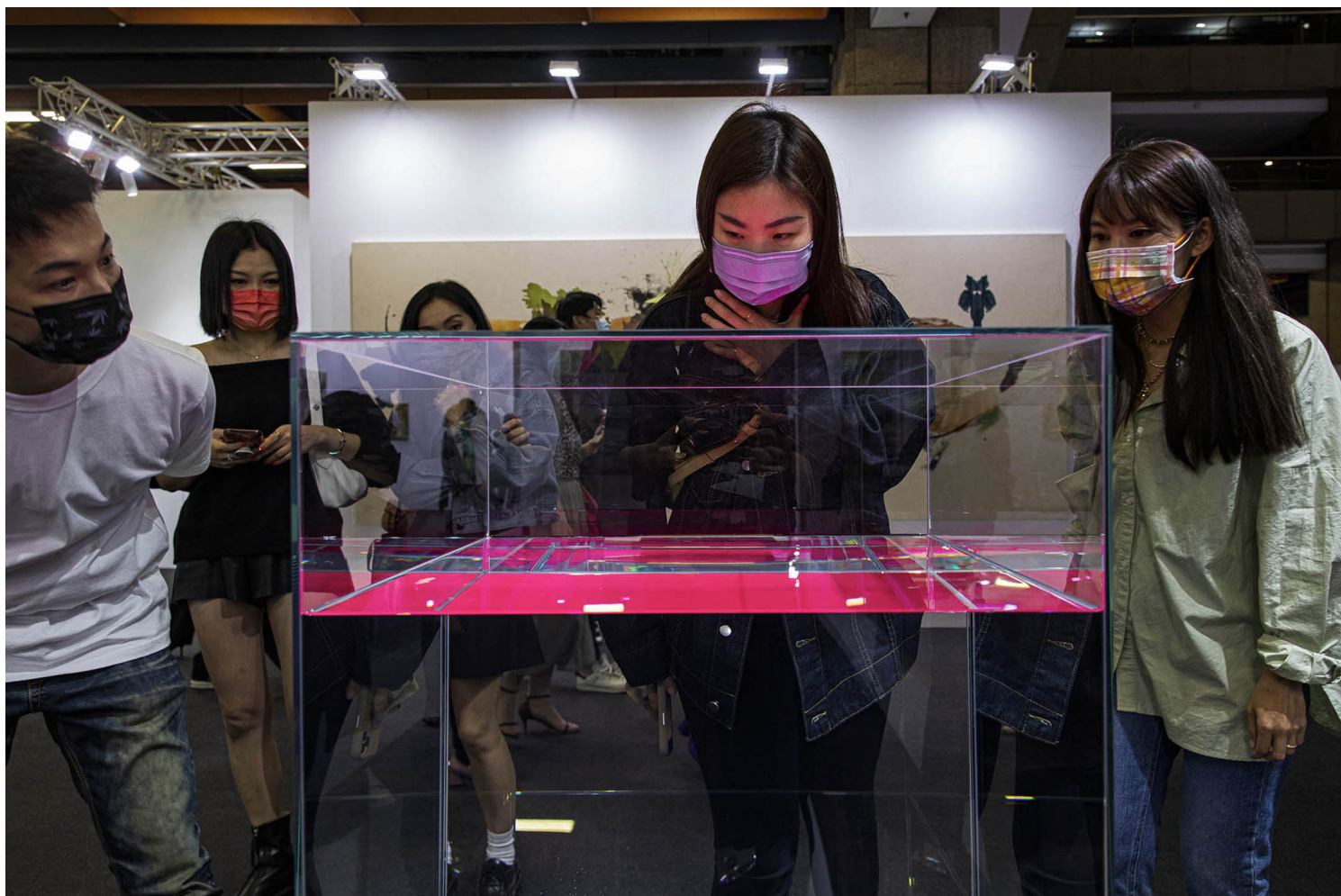
2022年5月20日，台北当代艺术博览会，观众在观看艺术品。

但也被许多人诟病，似乎展会的内容，或是画廊呈现的内容都越来越相近。不过随著越来越多的地方展会的萌芽，似乎在地的内容和不一样的形式越来越重要，差异化的形式越来越明显。