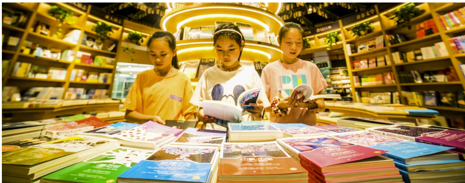
2020年7月20日，贵州的孩子们于暑假期间在书店读书。

做儿童文学编辑的第一年，出版机构的负责人和我说，既然你对儿童文学也不是特别了解，就先把咱们这儿出过的书都看一遍。在大量的阅读中，我才发现，除我们耳熟能详的《安徒生童话》、《格林童话》外，居然有这么多儿童文学的存在，像历史悠久的凯迪克文学奖、日本的严波文学奖，都陪伴了一代又一代儿童的成长。