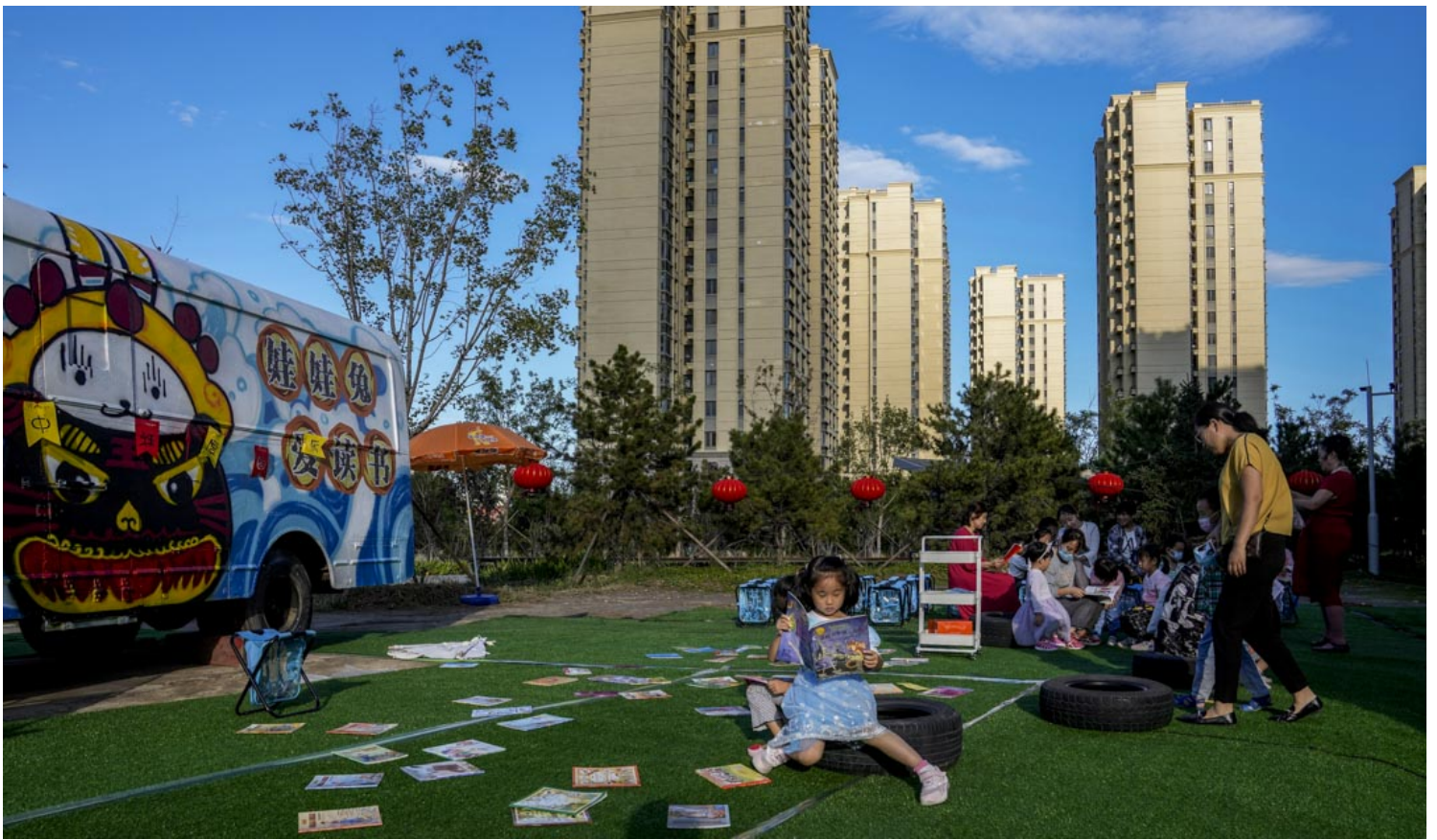
2021年9月21日，北京的中秋节，孩子们在一项促进阅读的活动中读书。

越来越多地接触儿童文学后，我也在想，现在成人与儿童的阅读界限，是不是太过于泾渭分明了？很多厉害的作者，虽然他们写的不是童书，但在他们的作品中，儿童的视角是始终没有消失的。