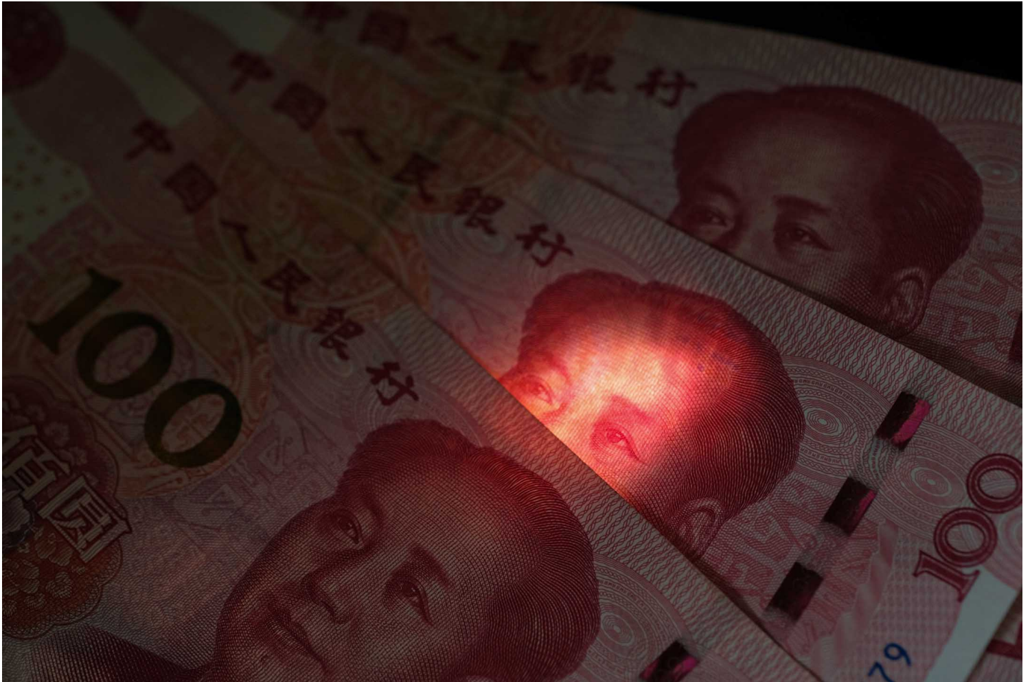
2020年11月14日，中国前领导人毛泽东肖像的在人民币上。

美国另类右派的政治混乱（及毛主义的延展）。当时有一份备忘录在国家安全委员会（National Security Council）的川普支持者之间流传，后来流入媒体手中，导致川普政府面临更多的动荡。那份备忘录描述“深层政府”（deep state）以“毛派叛乱模式”的策略及战术来对付总统。