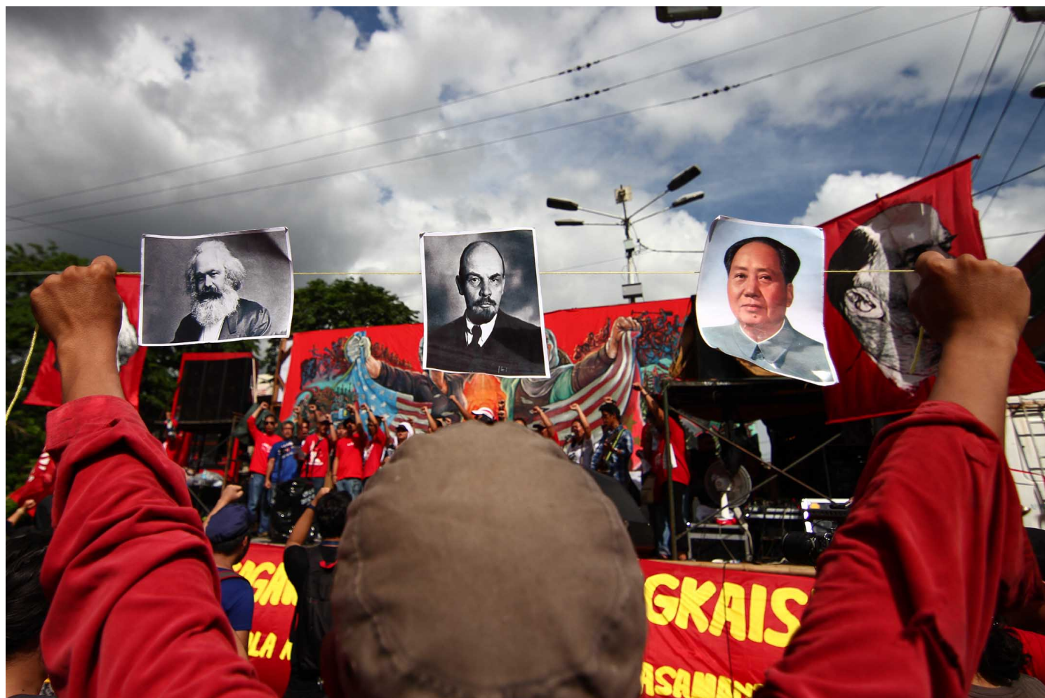
2018年5月1日，马尼拉，五一集会期间，一名抗议者举起了马克思、列宁和毛泽东的照片。

研究毛主义的全球蔓延，不仅需要从过往意识形态的角度（亦即共产主义学说支配及影响许多人类的时候）来重新考虑这套思想，也需要从非常不同的地理观点来思考。对一九五〇年代至七〇年代在开发中国家成长的许多人来说，毛泽东主政时期的中国并不是（至今依然不是）一无可取，而是一种可取的、有别于美苏政治模式的独立选择。它提供一个贫穷的农业国家在西方或日本的扩张主义迫害下，在世界上奋斗以站稳脚跟的例子。在今日的尼泊尔，许多消费者把中国神化成经济天堂，并认为中国发展之所以如此蓬勃，就是拜毛泽东所赐，而不是视毛泽东为阻碍其发展的绊脚石。从巴黎到金边，从北京到柏林，从利马到伦敦，从坦尚尼亚的三兰港到澳洲的德比，毛泽东不止提供思想上的反抗，也提出务实的战略，为那些遭到世界强权边缘化或主宰的贫国赋予力量，也训练低技术的农村叛乱分子对抗国家资助的殖民军队。