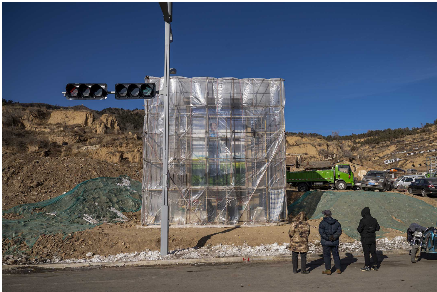
2022年1月2日，河北省张家口市，中国前领导人毛泽东的肖像画被覆盖著。

的甲虫，投叉成 放入胆儿长的土坏努力。他的江山 竹雅南六页、刀叉目理的口口， 去似言刀 义上取狂的人类操纵尝试之一”的宣传与思想控制体系，以及一支纪律严明的军队。他把一群才华横溢、冷酷无情的同志汇聚在身边。他的思想激起了广大的热情，数百万人为了政治利益而结婚，抛弃子女，投身乌托邦实验。那些遭到抛弃的孩子在一九六〇年代与七〇年代，则是反过来以其伟大领导人的名义，谴责、羞辱，甚至在极端情况下杀害自己的父母。