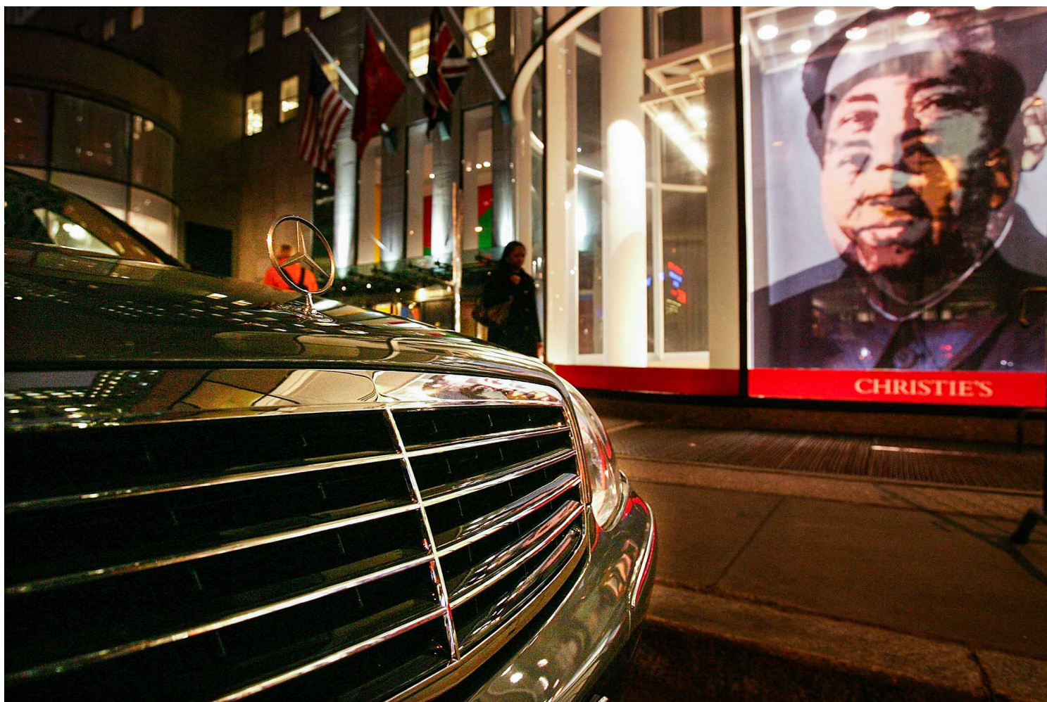
2006年11月15日，纽约，当代艺术拍卖会期间，窗户上打印著安迪·沃荷的“毛”肖像，一辆汽车等待在佳士得拍卖行内的一位客户。

我将会描述冷战早期的末日恐惧，当时（一九五〇年）中国与苏联签订的条约令西方政府不寒而栗。文安立写道，这个中苏联盟是“十六世纪鄂图曼帝国最终扩张以来，挑战西方政治霸权的最大势力”。然而，十年后，中国和苏联原本可能一起称霸世界的友谊迅速瓦解。毛泽东及其党羽谴责苏联人是急于安抚美国人的“修正主义者”，并把握每个机会公开抨击苏联，声称中国才是世界革命的真正领导者。一九六〇年代与七〇年代，毛主义在世界各地的传播是本书的核心，毛泽东也在那几十年间争取全球共产主义的霸主地位。我将在书中追踪毛主义熊熊大火般的热潮，例如毛徽章穿过中国边境，渗入尼泊尔、印度、柬埔寨，在加德满都、加尔各答、金边成为年轻人追逐的潮流；流传甚广的《北京周报》宣称，毛泽东是“世界革命的伟大舵手”和“永不落日”；北京广播电台（Peking Radio）充满杂讯的广播开始在非洲大草原播送；从远方崇拜毛派中国的欧美人士，包括嬉皮、民权活动者、哲学家、恐怖分子、女星莎莉·麦克琳（Shirley MacLaine）等人。