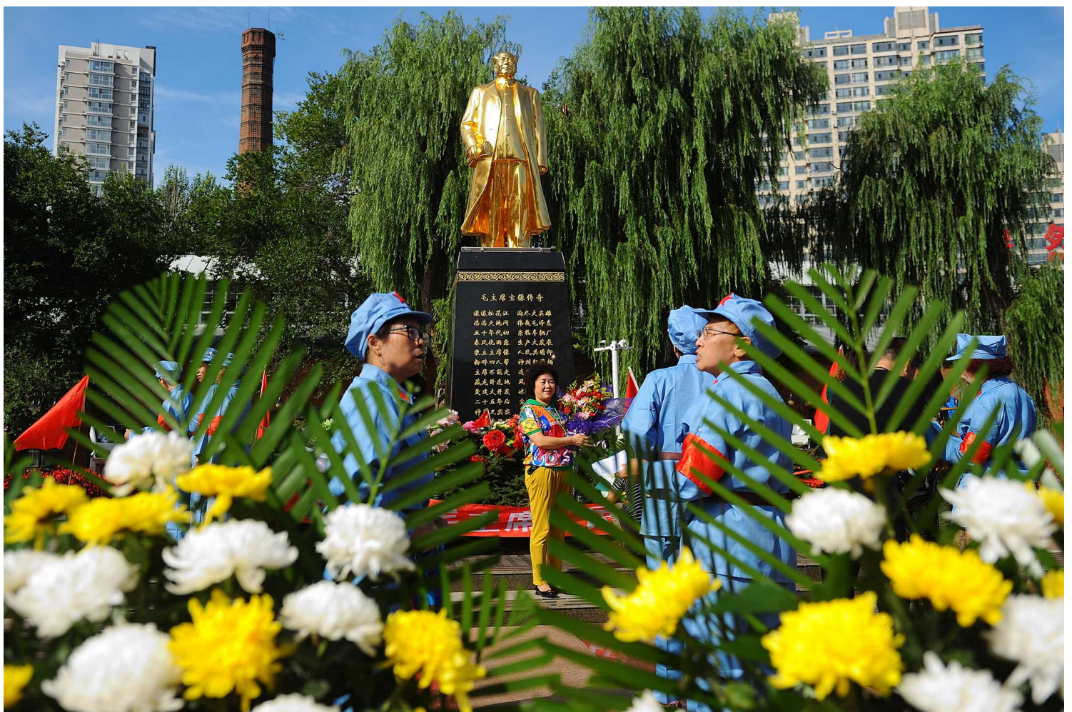
2019年9月9日，哈尔滨，毛泽东的支持者在前领导人毛泽东逝世43周年的纪念活动中。

这不是一九六六年——亦即毛泽东发动文化大革命的那一年，他的乌托邦狂热达到巅峰，一群群红卫兵走上中国城市的街道，数百万受过教育的都市人被逼到偏远的农村，造成至少一百五十万人死亡。而不久前的一九六〇年代初期，人为饥荒才刚造成三千万人死亡——这是二〇一一年，所以这些歌曲在KTV也听得到，中国的手机因此频频收到毛语录的轰炸——一次广传一千三百万支手机——毛泽东思想因而得以透过那些经常播放经典革命电影的电视台来锁定观众，而政府也才能够推出“红色推特”（Red Twitter），透过这个非常二十一世纪的微媒体来传递一九六〇年代的名言锦句。薄熙来是打造这场新毛派复兴的总策画，他于二〇一二年春天因腐败及其妻毒死哈罗公学的老校友尼尔·海伍德（Neil Heywood）而失势下台。然而，二〇一二年十一月就任中共中央总书记的习近平，承接了薄熙来的新毛派复兴并在全国落实。习近平上台才几个月，就推出“群众路线网”（群众路线是毛泽东最爱的口号之一）以打击腐败，加强共产党与基层之间的联系，并在全中国的官僚机构重新导入毛派的“批评与自我批评”。自一九七六年毛泽东逝世以来，习近平首度把毛派策略重新融入中国的民族以及大众文化中。