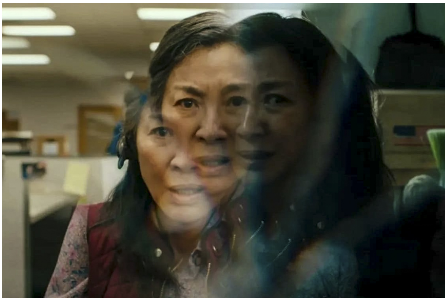
《妈的多重宇宙》（Everything Everywhere All at Once）剧照。网上图片

杨紫琼被量身订造了一个好莱坞史上前所未见的“华裔大女主角”，从家庭剧TA到超级英雄粉丝、再到热衷拆解真实与虚构思索银幕内外层次的艺术片迷，都能从这部电影得到乐趣。