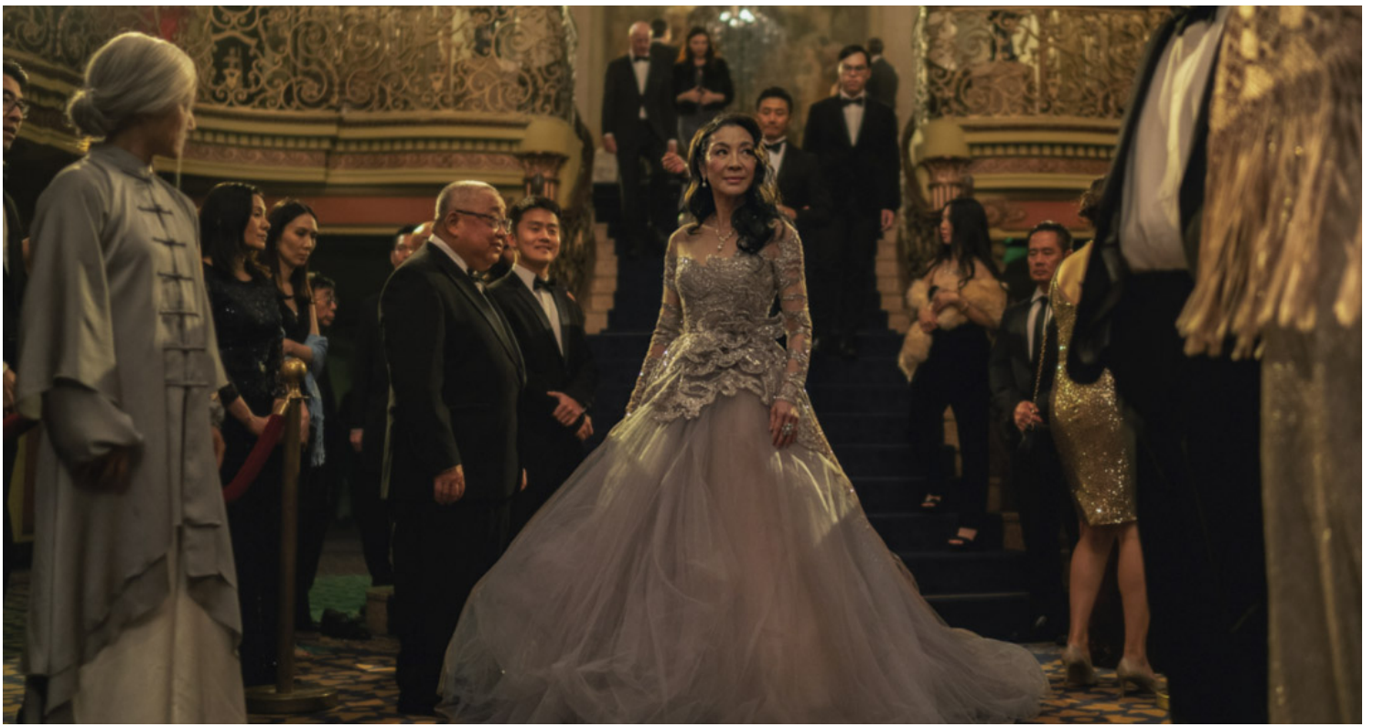
《妈的多重宇宙》（Everything Everywhere All at Once）剧照。网上图片