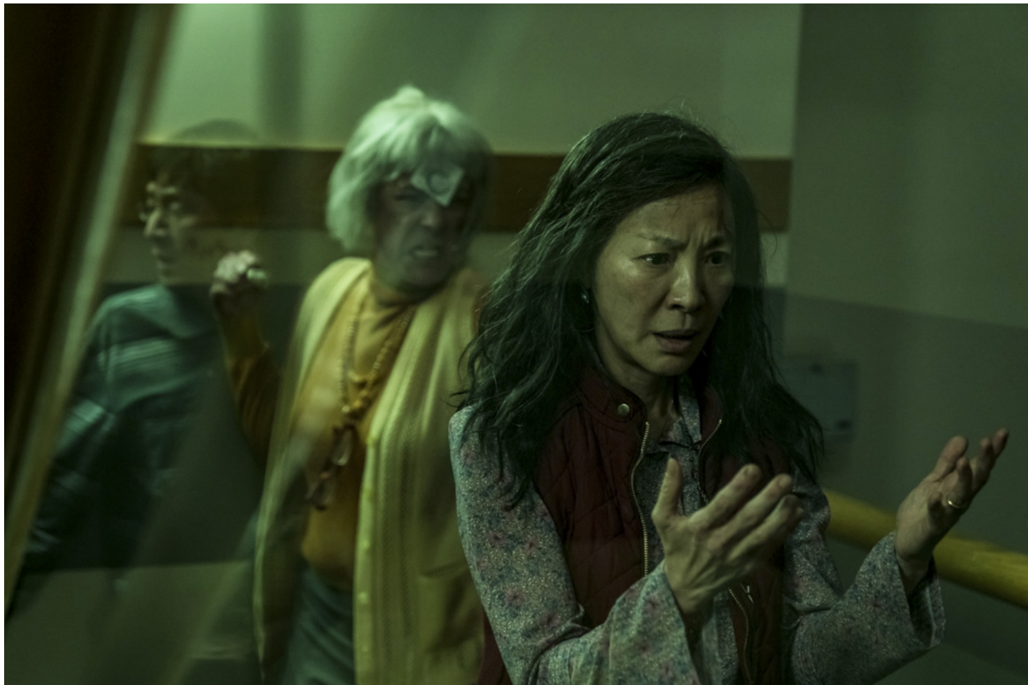
《妈的多重宇宙》（Everything Everywhere All at Once）剧照。网上图片

比摩天史摩天，比兀盾史兀盾，比忘却史忘却，比儿尔史儿尔，大和耐尔付付达三及达科及不出的惨剧，以悲喜夹杂的一派感性给演绎出来，再透过咖啡厅里正在对话的肥胖欧吉桑和妙龄少女为它们下了注解：天下怪事何其多，躲也躲不掉。