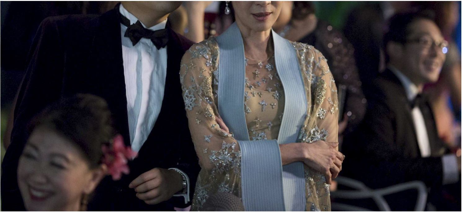
《疯狂亚洲富豪》剧照。