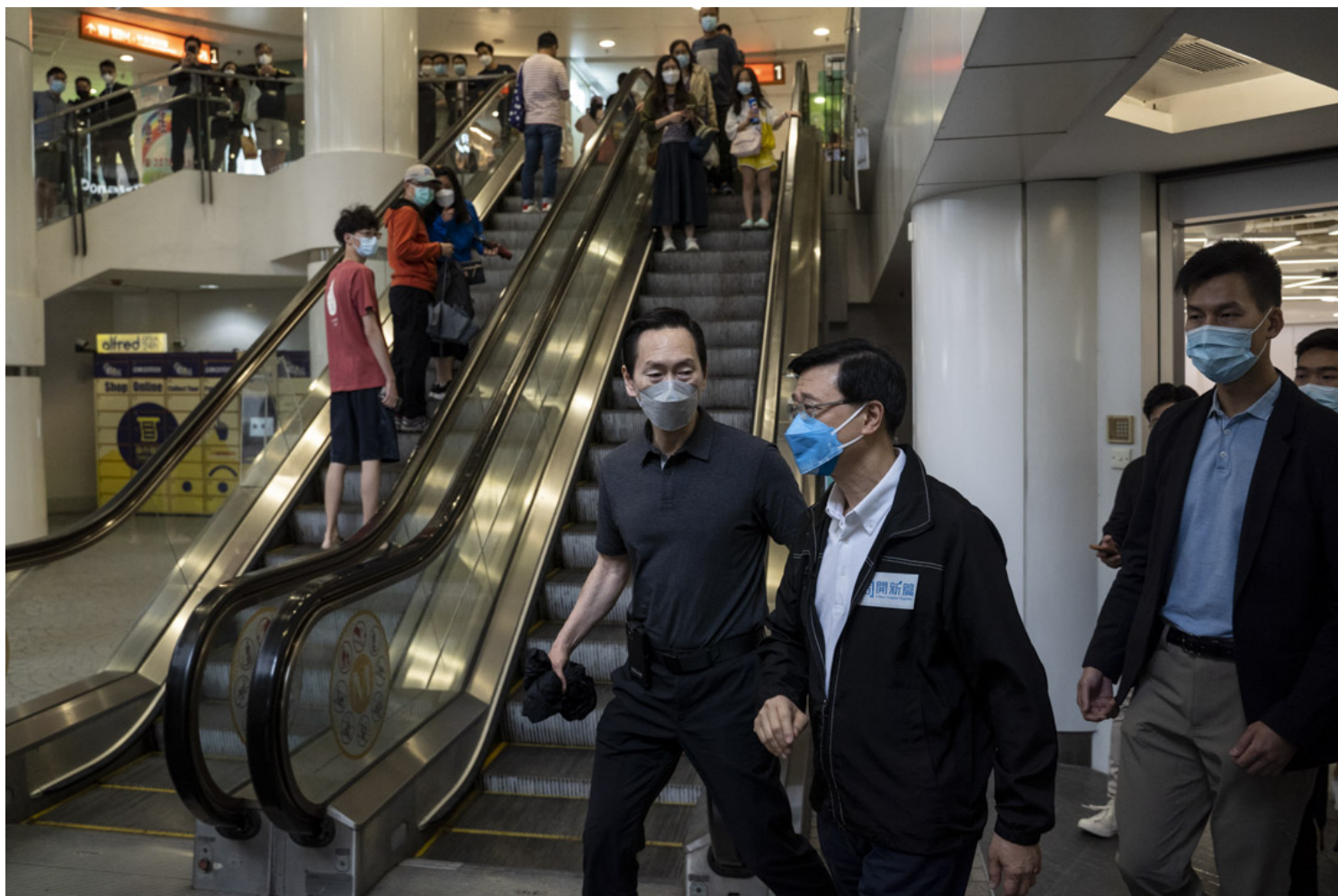
2022年5月1日，特首选举参选人李家超到访沙田探访赛马会“a家”乐龄科技教育及租赁服务中心。

这正是李家超团队的圆滑乖张之处：将一份面向北京与政治盟友的选举承诺，透过不同政治语言包装成讨好香港人与北京的方向性政纲。