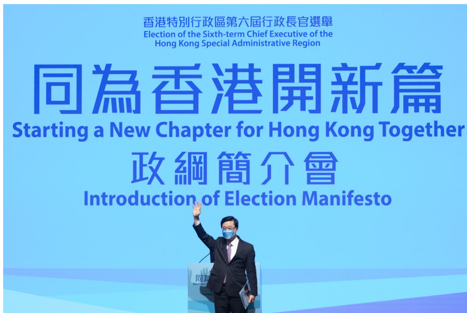
2022年4月29日，特首选举候选人李家超公布政纲，邀请过百名地区及基层人士参与。

不过这些花边新闻虽然成功引起关注，但因故事内容老派与缺乏网上互动营销策略，使得难以延伸话题至政纲，转化成支持度。单以追踪者比较，每日关注李家超中文水平的FB专页的粉丝（约四万）比李家超选举专页（约两万五千）还要高，林郑月娥的专页则有约二十万粉丝。在网络选战层面，李家超团队可谓未能有效创造内容。