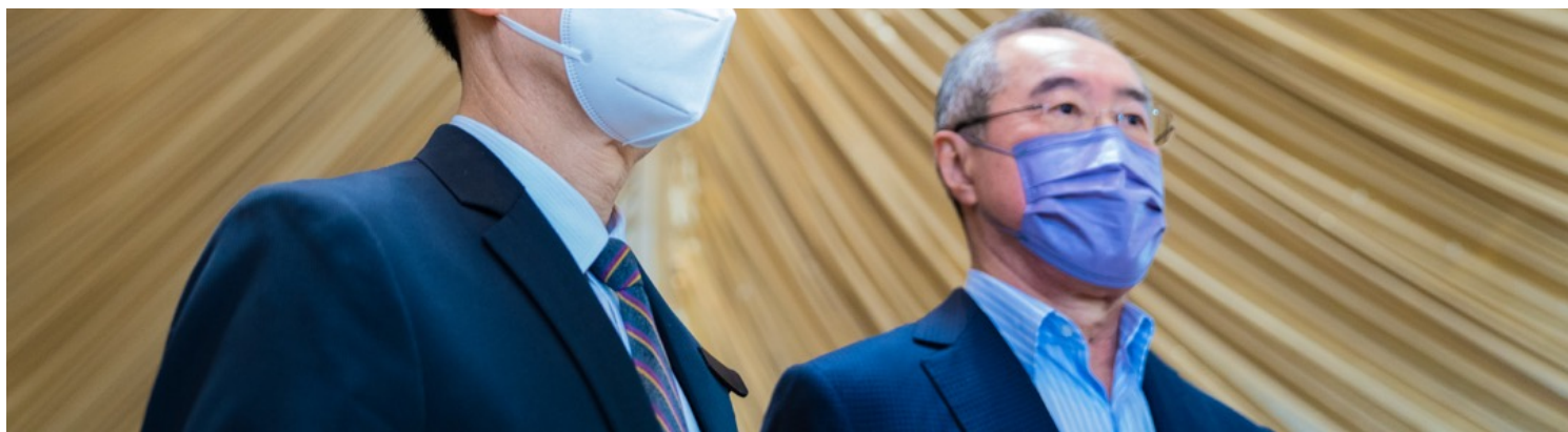
2022年4月11日，特首选举参选人李家超与政协常委唐英年回应记者提问。