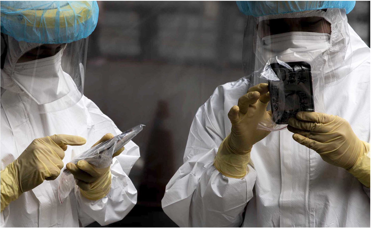
2022年4月18日，台湾新北市，防疫人员在一间医院外等待接送患者。