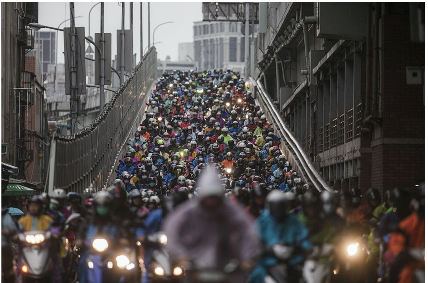
2020年3月12日，台北，市民在早上骑机车上班。

我想跟民众说，希望你们可以多体谅一线的防疫人员，我们可能没办法即时回应你们的问题，可以先到疾管署、地方政府的网站查询资料。如果身体有紧急状况，请马上拨打119，不要等待。