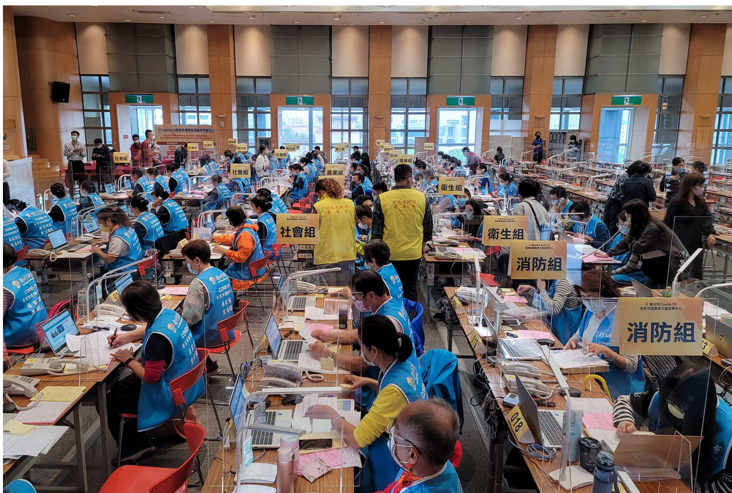
2022年5月2日，台湾新北市，Covid-19居家照护关怀中心。

“很难过的是，甚至有民众说我们那么晚通知，才是造成疫情扩大的原因，把过错推到第一线人员身上。”