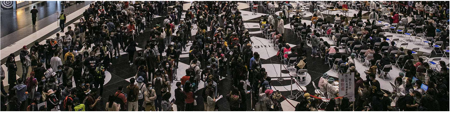
2022年4月17日，台北车站，大量市民在车站等待打疫苗。