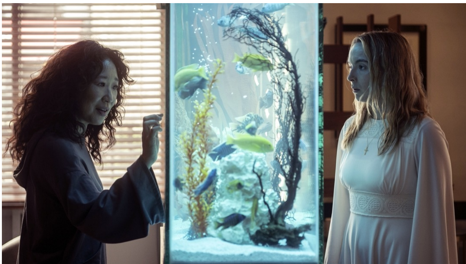
电视剧《Killing Eve》剧照。网上图片

而最让人失望的是，Killing Eve从第一季的制作和故事设定开始便是注定要打破这种传统既定价值观的，一个MI6的女探员和反社会精神病患女杀手的相爱相杀故事，怎么看都是要颠覆主流传统爱情故事中的规范。