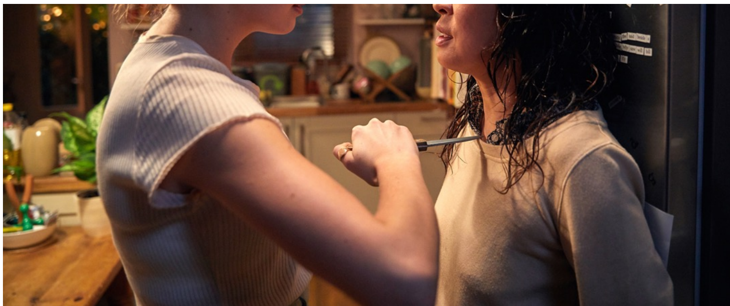
电视剧《Killing Eve》剧照。网上图片