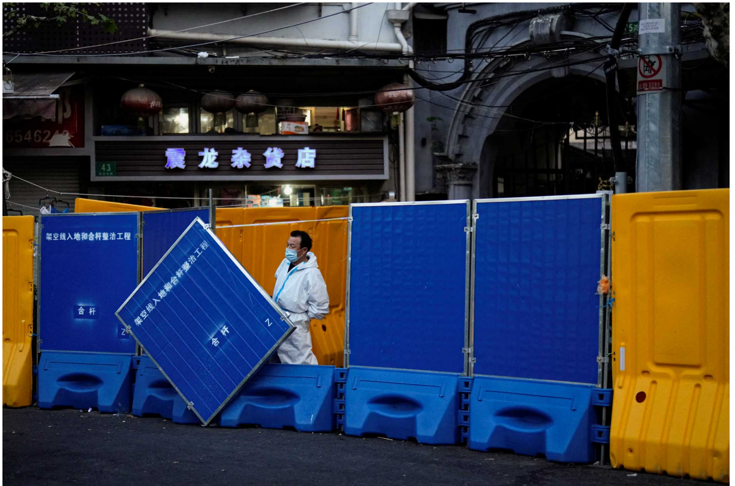
2022年4月11日，中国上海，因疫情被封锁的社区，一名身穿防护衣的工作人员在封闭区的路障旁。

还有一点是，对于一些比较愿意去抵制学校不合理政策的学生，我身边这样的同学几乎人人都被学校辅导员约谈过，甚至被约谈很多次，我们都在经受非常大的压力。