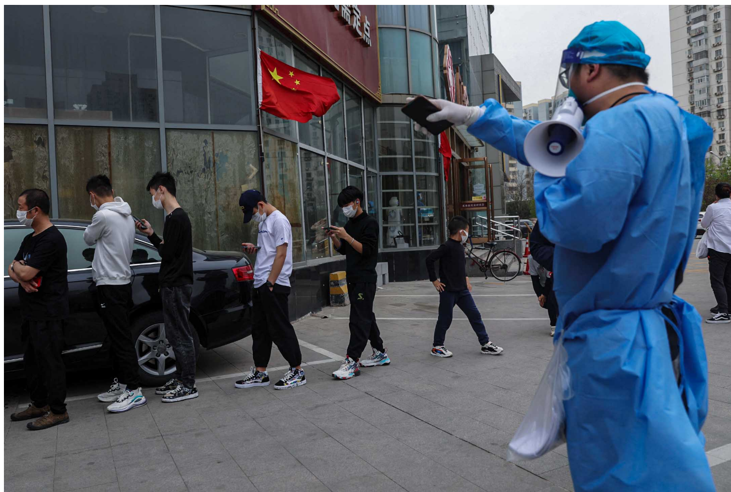
2022年4月11日，中国北京，一名工作人员引导市民在检测点排队进行核酸检测。

Iris：好的，谢谢泡面。我觉得你的分享让我知道除了看到很多其他媒体报道之外的方舱的情况。我们接下来进入到开放麦的环节。