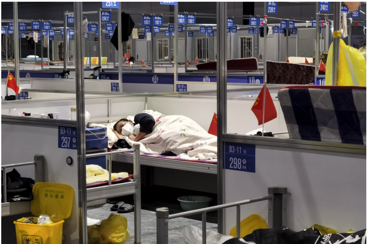
2022年4月19日，上海，一名2019冠状病毒病患者睡在临时医院。

但其实这种情况在我个人看来，存在一个非常强的漏洞。我们以现在上海实行的“清零”政策作为前提去讨论这个问题，因为这个政策不是我能改变的，我同不同意也没有办法。如果我连续两天都是阴性就可以出来的话，那就意味着我有可能进去的时候是阴性，出来的时候反而是阳性。因为你第二次核酸检测报告出结果和你真正离开方舱是有一个时间差的，在这个时间差里我和一群阳性患者生活在一起是有概率被感染的。按照目前这样的行为方式，我感觉“清零”是非常难达到的，因为它真的有可能把阴性的人抓进去，然后把阳性的人放出来。