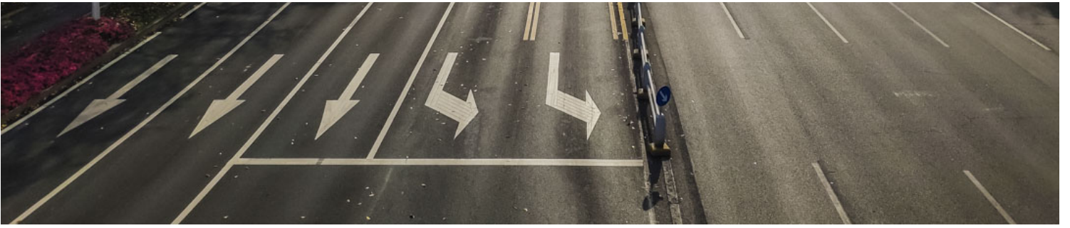
2022年3月14日，深圳暂停地铁和公交服务以控制疫情，街道上空无一人。

分享者4：我是来自深圳的，也非常关心上海的朋友们，因为我觉得上海的情况有概率发生在全国各个地方的每个老百姓的身上。