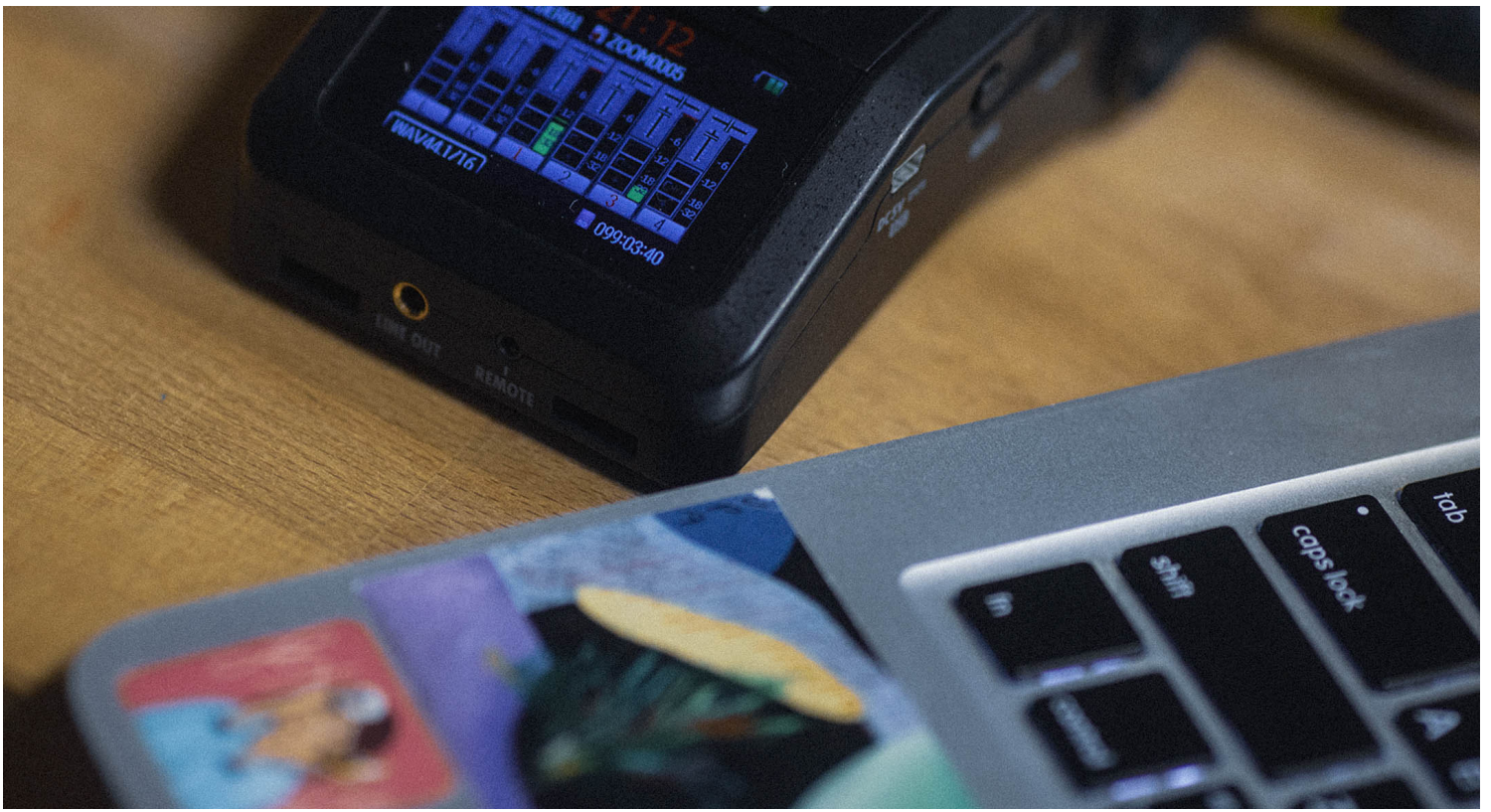
《谈性说爱 Sex Chat》主持扬。

扬希望能让各种性偏好、性别认同的人们都能自在表述情慾，透过各自不断地述说与连结，也让很多人知道，在面对情慾那么困惑的自己并不孤独。她好像在录音室中，用声音解放了自己的恐惧。