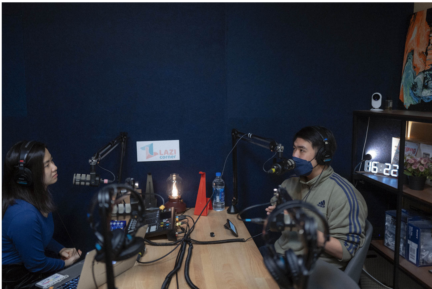
《谈性说爱 Sex Chat》录製中。

这也让扬在无心之中，搭上2020年肺炎疫情冲击，台湾实施三级警戒影响下，所掀起的Podcast大热潮，成为Podcast圈裡的性爱教主，在看似Podcast生涯上了轨道的时刻，却也让她很矛盾“我不想为了录音而录音”。