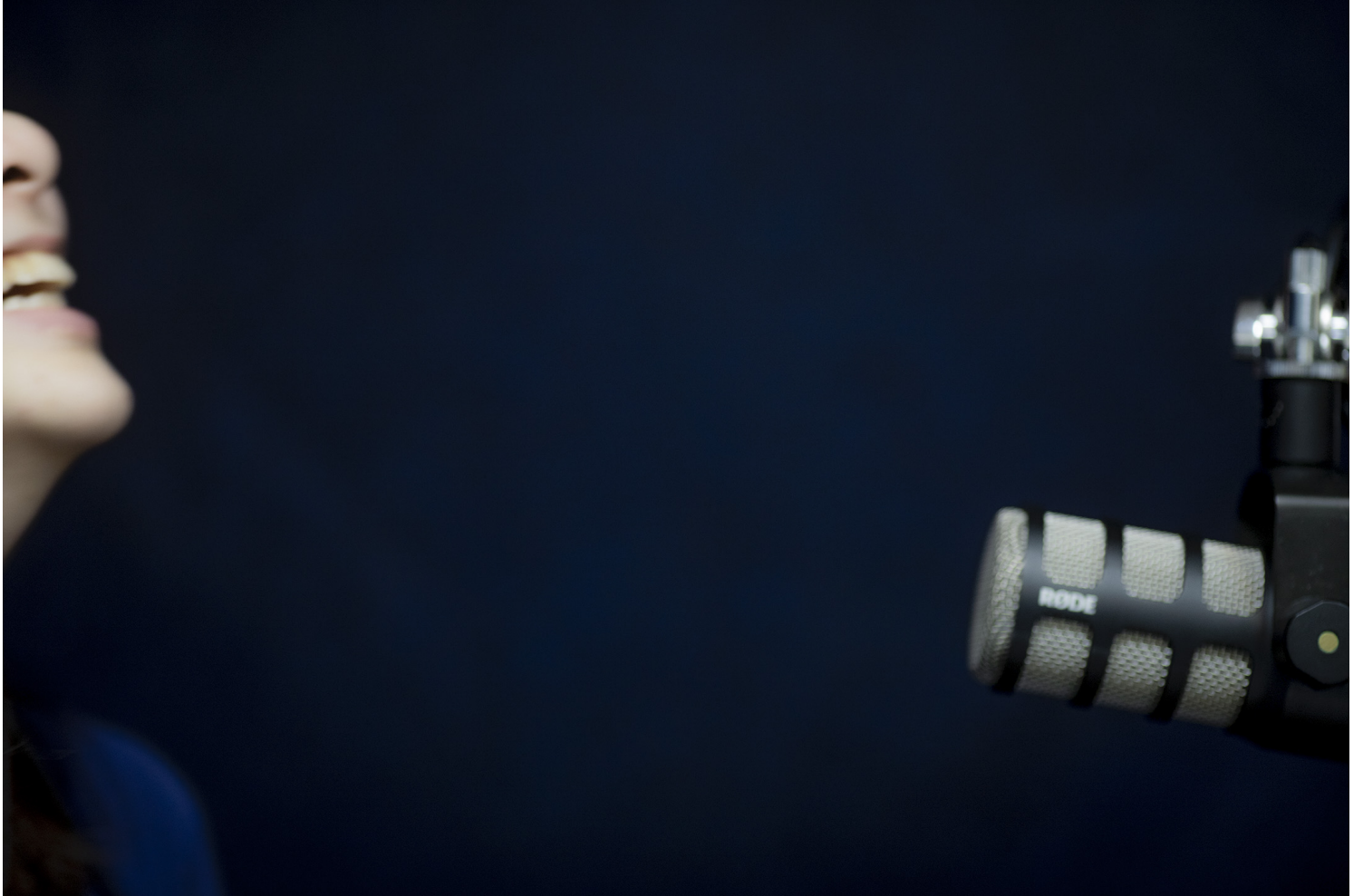
《谈性说爱 Sex Chat》主持扬。

她开始约访来自不同领域的性工作者，他们更像是为扬打开了世界的另一面，有替身障者服务的手天使、性谘询师、情慾技巧老师、开放关系实践者等，他们带领着扬认识了更多各种不同面向的性。