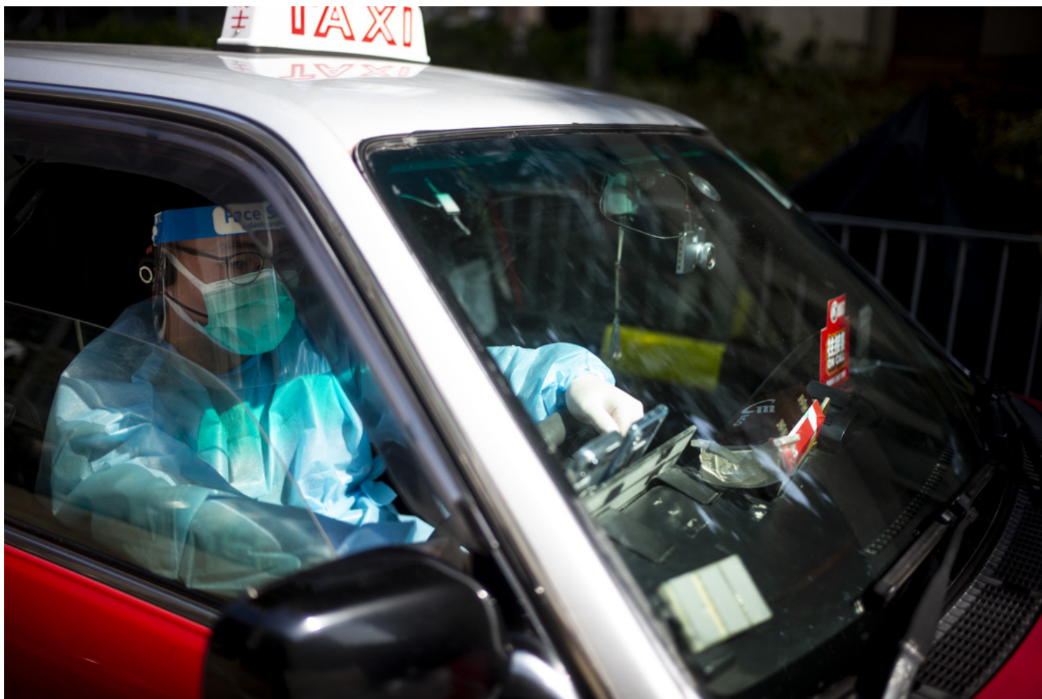
穿着全副防护装备的森仔在车上等候乘客。

第14天，森仔忍不住离开大屋，回家与亲人团聚，但他未有退出抗疫的士，“本身初衷4个人的目的都是想为社会出一份力，那么4个人都还在这里，那就一起做下去、坚持下去啰。”