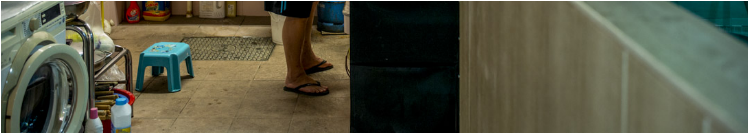
辉哥是屋中的大厨，每天预备早餐及晚餐。