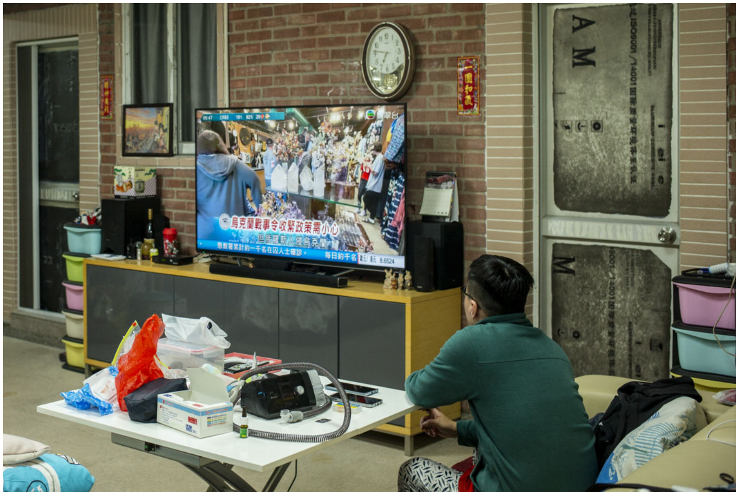
森仔在屋中观看晨早新闻。

整个计划原来只维持14天，司机默认不能中途退出；但后来确诊的人多了，政府决定延长。截至发稿时，阿廷和阿峰2个人已经连续工作了40天。