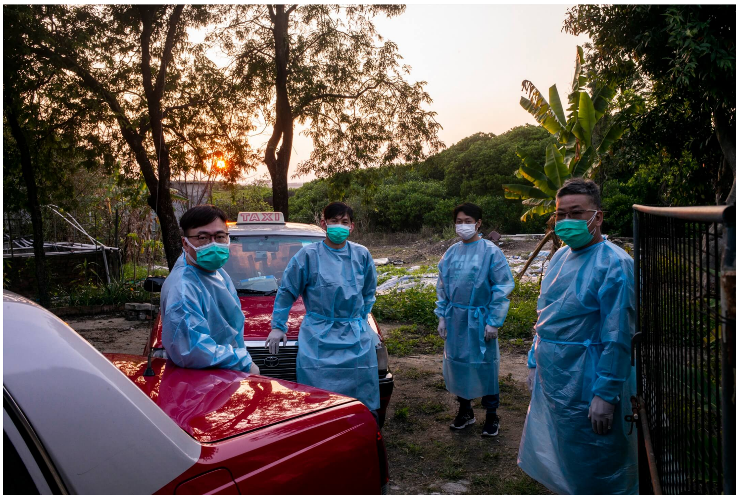
四位抗疫的士佬：森仔、阿廷、阿峰与辉哥。

妻子问，“可不可以摸摸你的手？”他说，“不行啦，女儿回家，再摸你就感染了。”原来在香港生活，这么近、那么远。