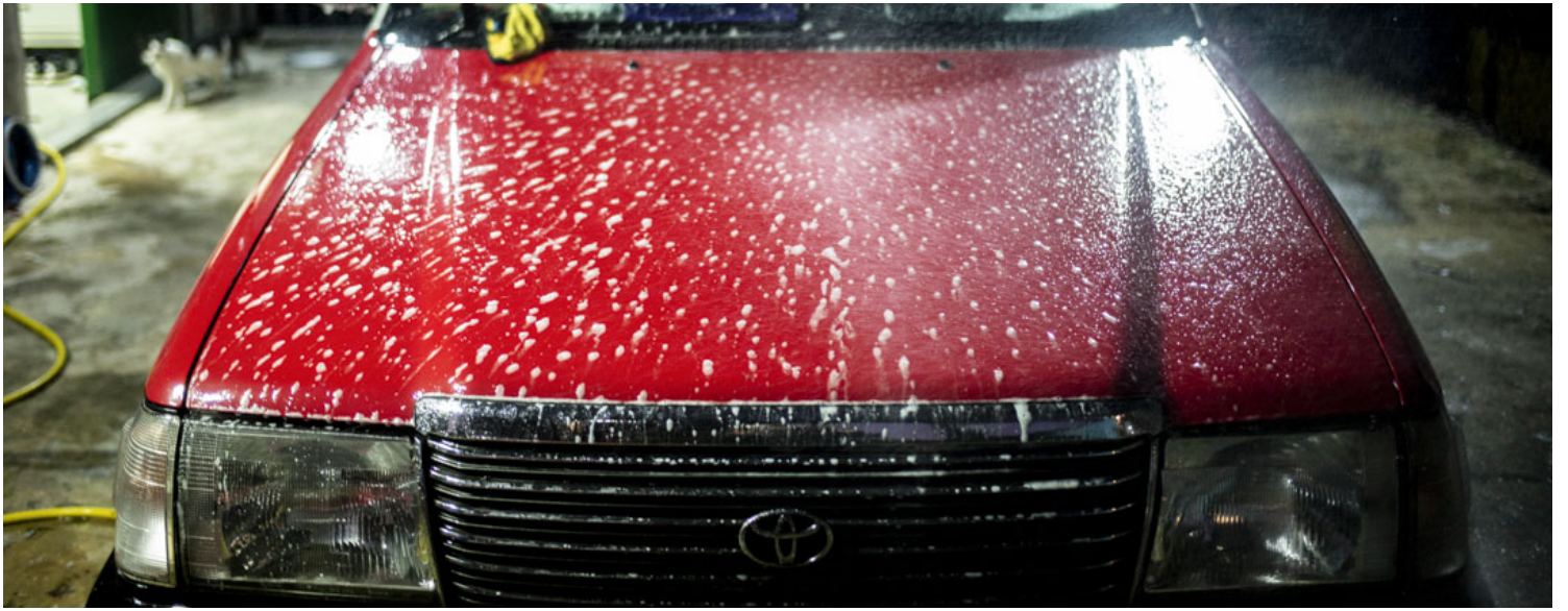
清洁中的“抗疫的士”。