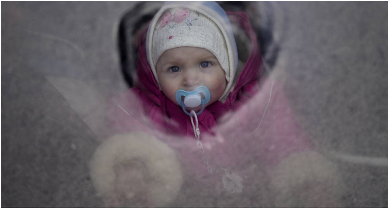
2022年3月9日，一名从乌克兰逃离战争的孩子在波兰 Przemysl 的公共汽车上往窗外看。