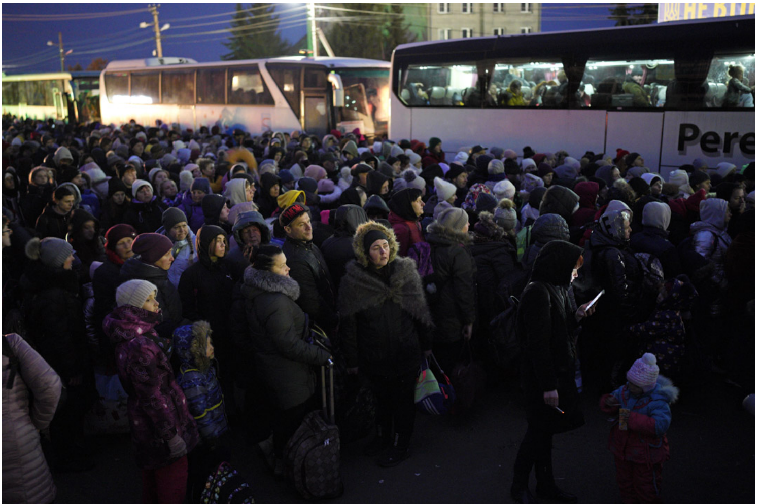
2022年3月6日，乌克兰难民抵达波兰边境。

“希望战争赶快结束，回去重建我的家乡。”这是在采访过程里，大部分乌克兰难民告诉我的唯一打算。