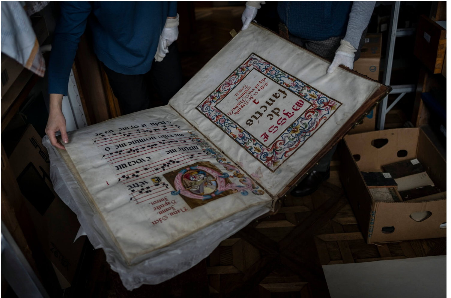
2022年3月4日，乌克兰利沃夫国家博物馆，职员将珍稀手稿与图书放到纸箱内。