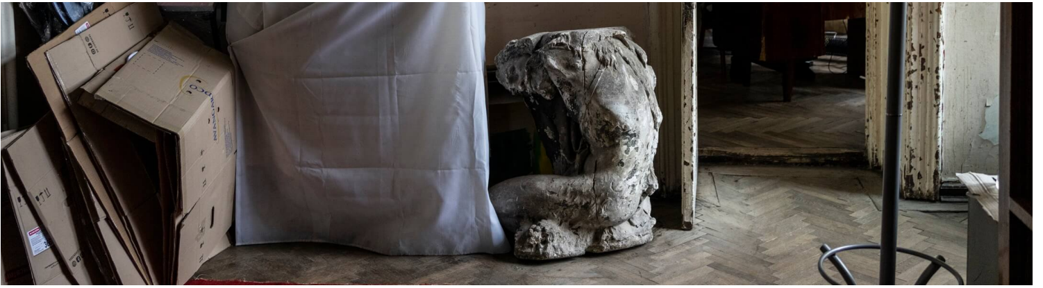
2022年3月4日，乌克兰利沃夫国家博物馆，一件雕塑被白布覆盖。