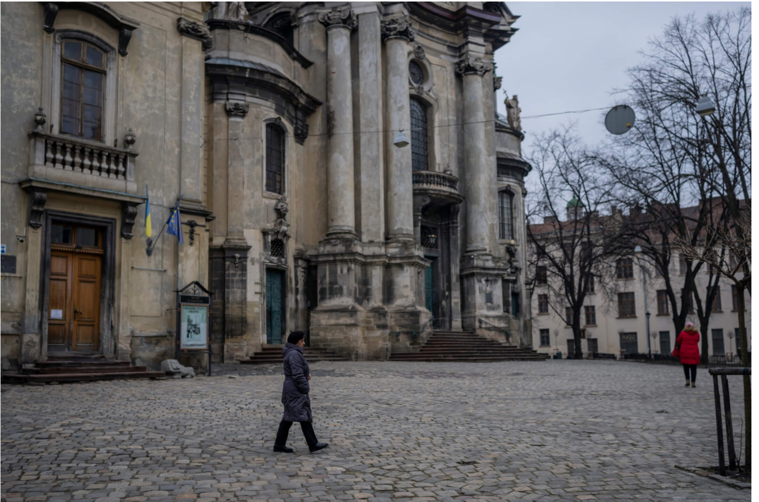
2022年3月4日，乌克兰西部城市利沃夫，宗教历史博物馆在俄罗斯入侵乌克兰后关闭。