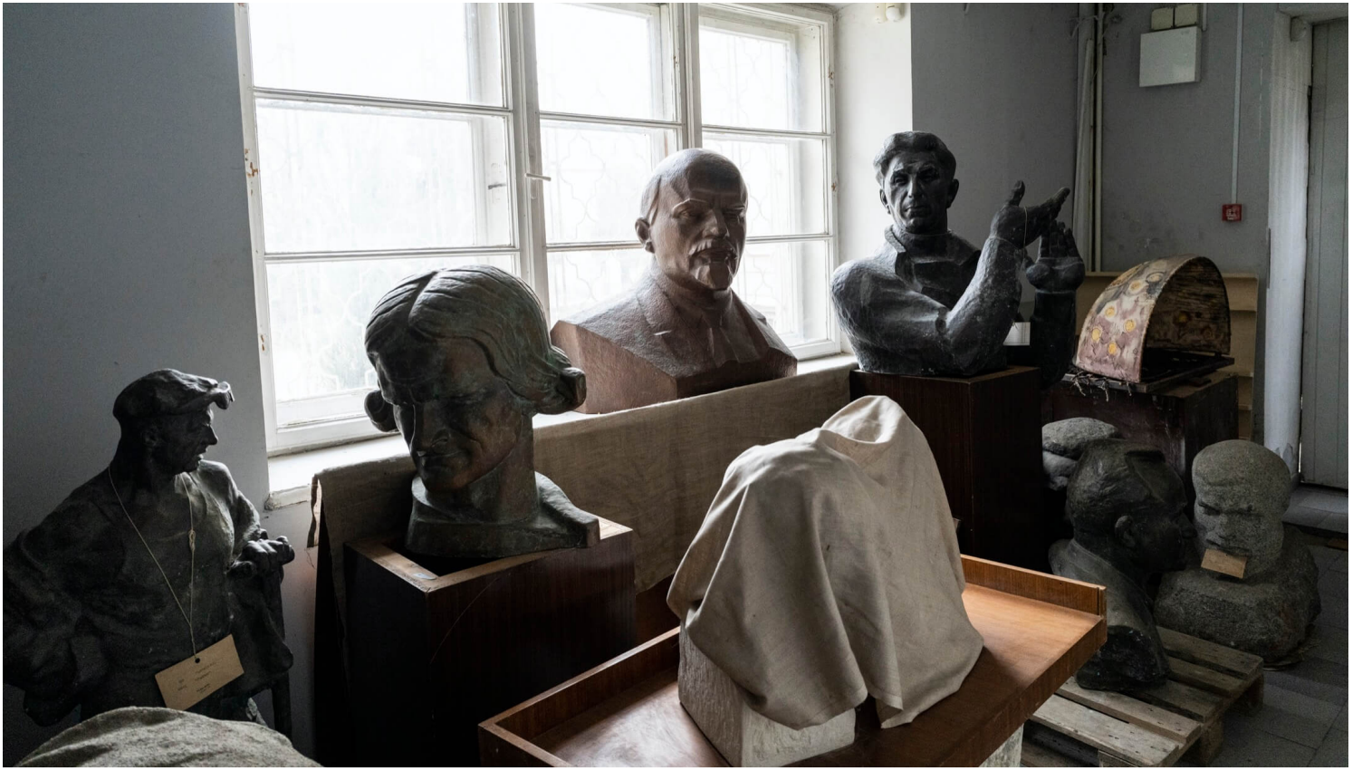
2022年3月4日，乌克兰利沃夫国家博物馆内，摆放著苏联时代的代表性人物的雕塑头像。