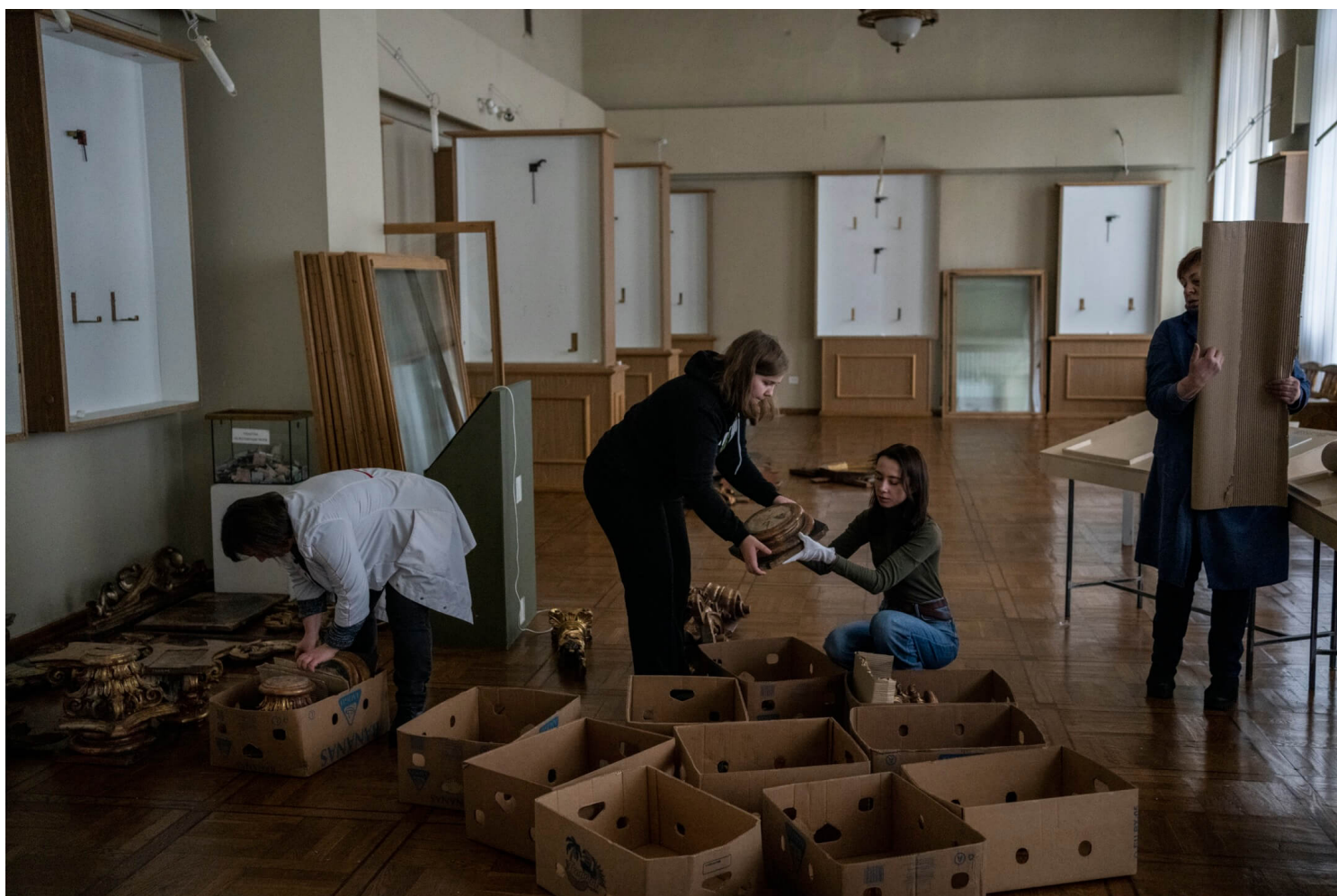
2022年3月4日，乌克兰利沃夫国家博物馆，职员将巴洛克时期藏品放到纸箱内，免受战火损毁。

“当你相信你在做对的事，你便会感到骄傲。这工作需要非常多的精力和时间，所以当你望著馆内空空如也的饰柜和墙壁，难免会伤感。”馆长Kozhan说，他难以相信要走到如今这个地步，不禁落泪。