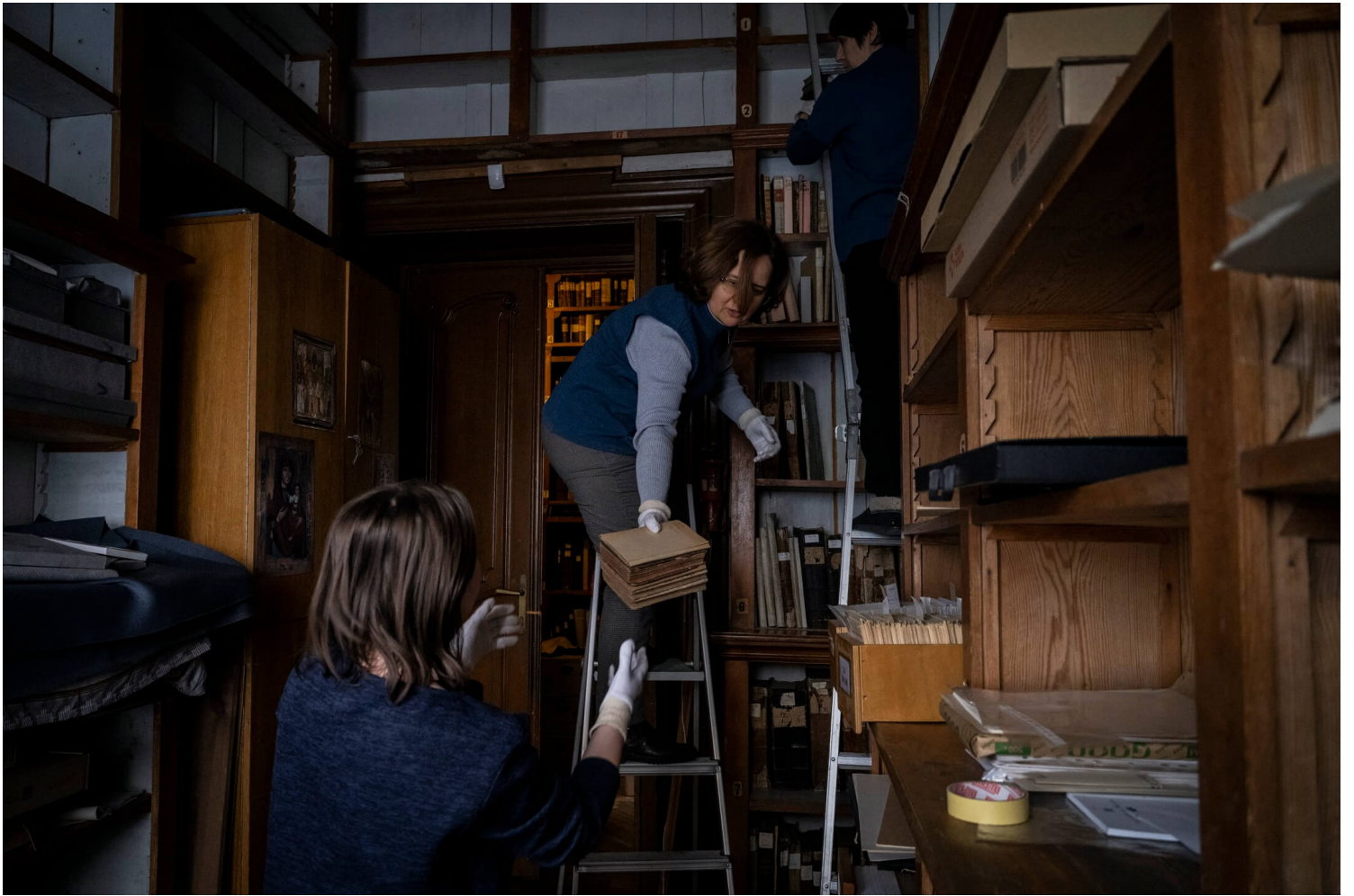
2022年3月4日，乌克兰利沃夫国家博物馆，职员将珍稀手稿与图书放到纸箱内。