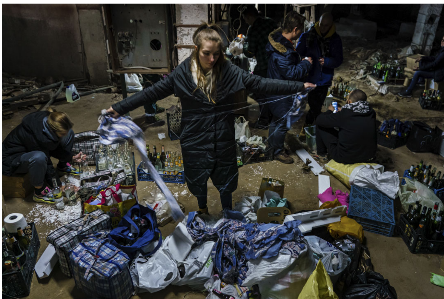
2022年2月26日，乌克兰的保卫队志愿者收集玻璃瓶来制作汽油弹，以对抗入侵乌克兰基辅的俄罗斯军队。

过去数天，她曾执著觅路回基辅，父母担心她安危，劝说：“如果你不是一个训练有素的战士，此时去基辅并没有意义。”然而，各地交通中断，她苦无出路、踌躇不前，不得不妥协，“无论身在何处，我们仍有事可为。在医院做志愿者、帮助年长的邻居、协助领土防御、筑路障……”