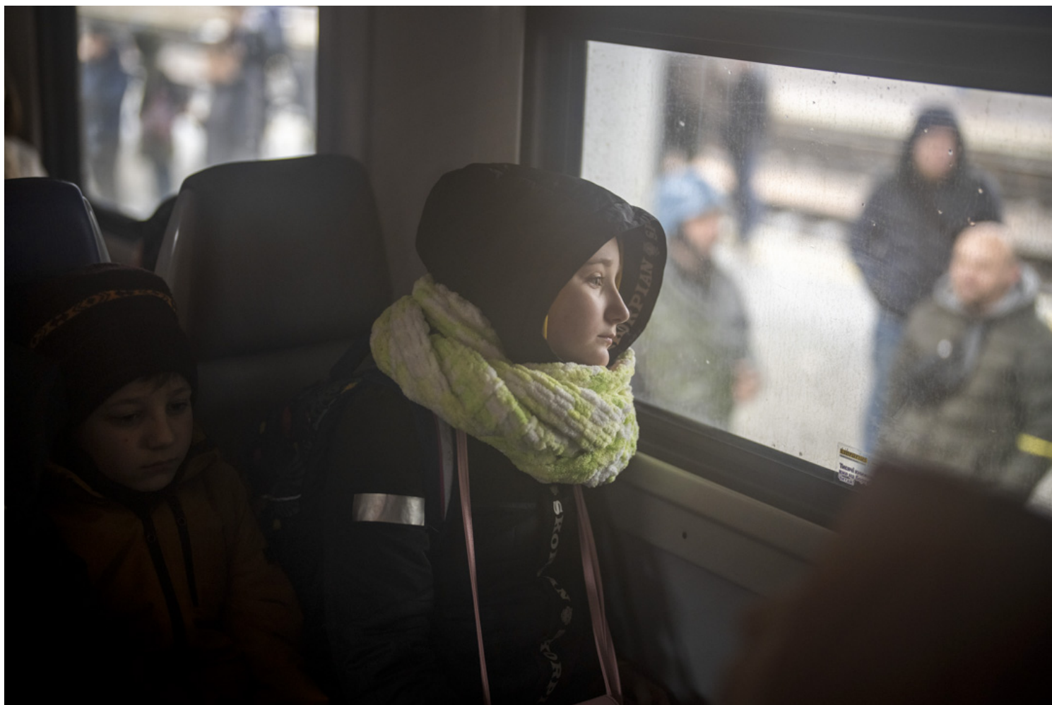
2022年3月3日，乌克兰基辅火车站，一名女孩和她的兄弟坐在开往利沃夫的火车上。

父母对执意回基辅参战的她说：“如果你不是一个训练有素的战士，此时去基辅并没有意义。”