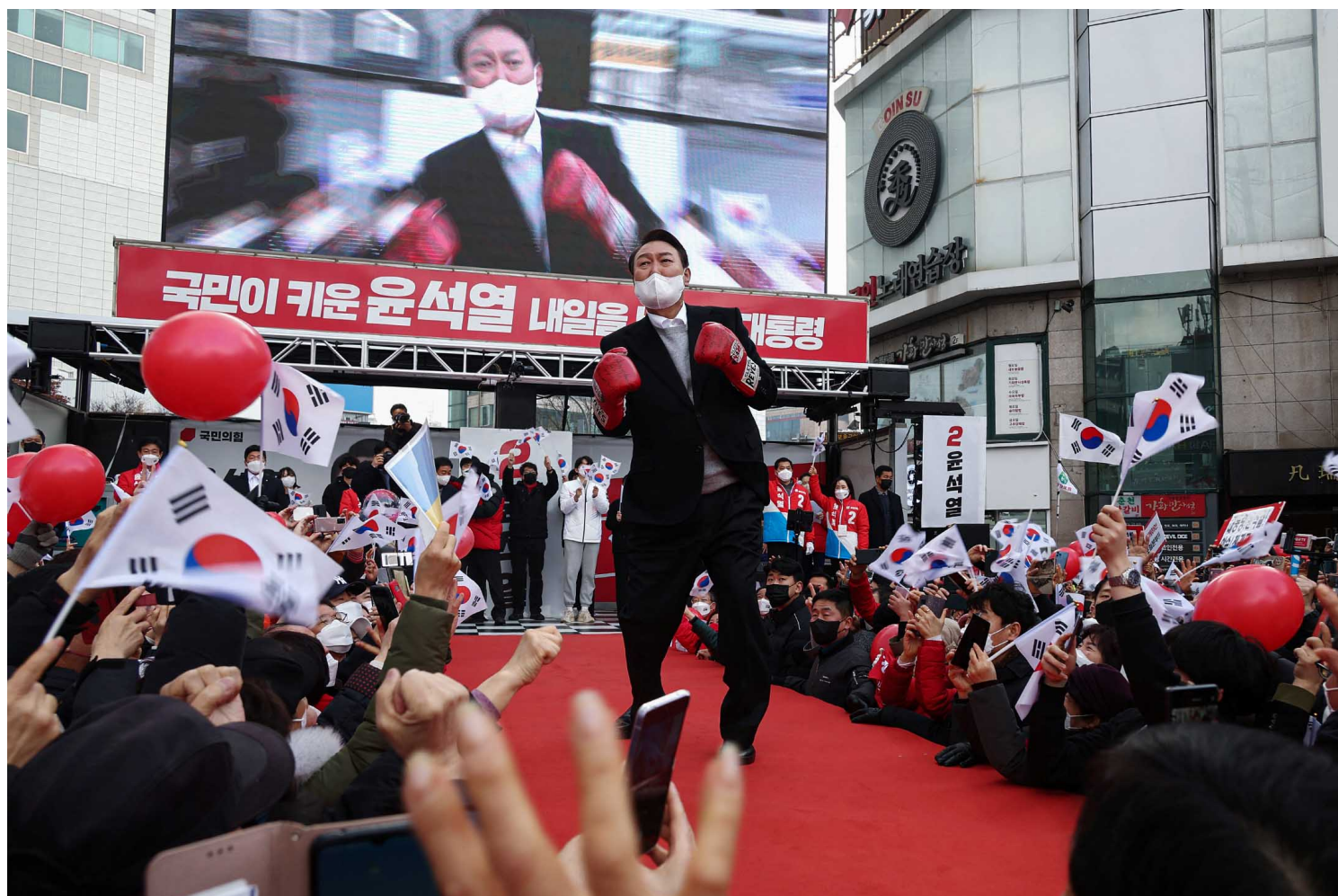
2022年3月1日，韩国国民力量党的总统选举候选人尹锡悦参加了首尔举行的竞选活动。

连绵的爆料与鞠躬道歉，朝野相互攻击的恶性循环没完没了，选民对选举感厌恶，有评论更直指，整场选举“只有不断争相撒钱和互相抹黑”，又形容现时的局面是“韩国选举历史上从未有过的奇观”，纷促请候选人停止泥浆摔角，勿让他们常挂嘴边的“国民团结”成为空话。