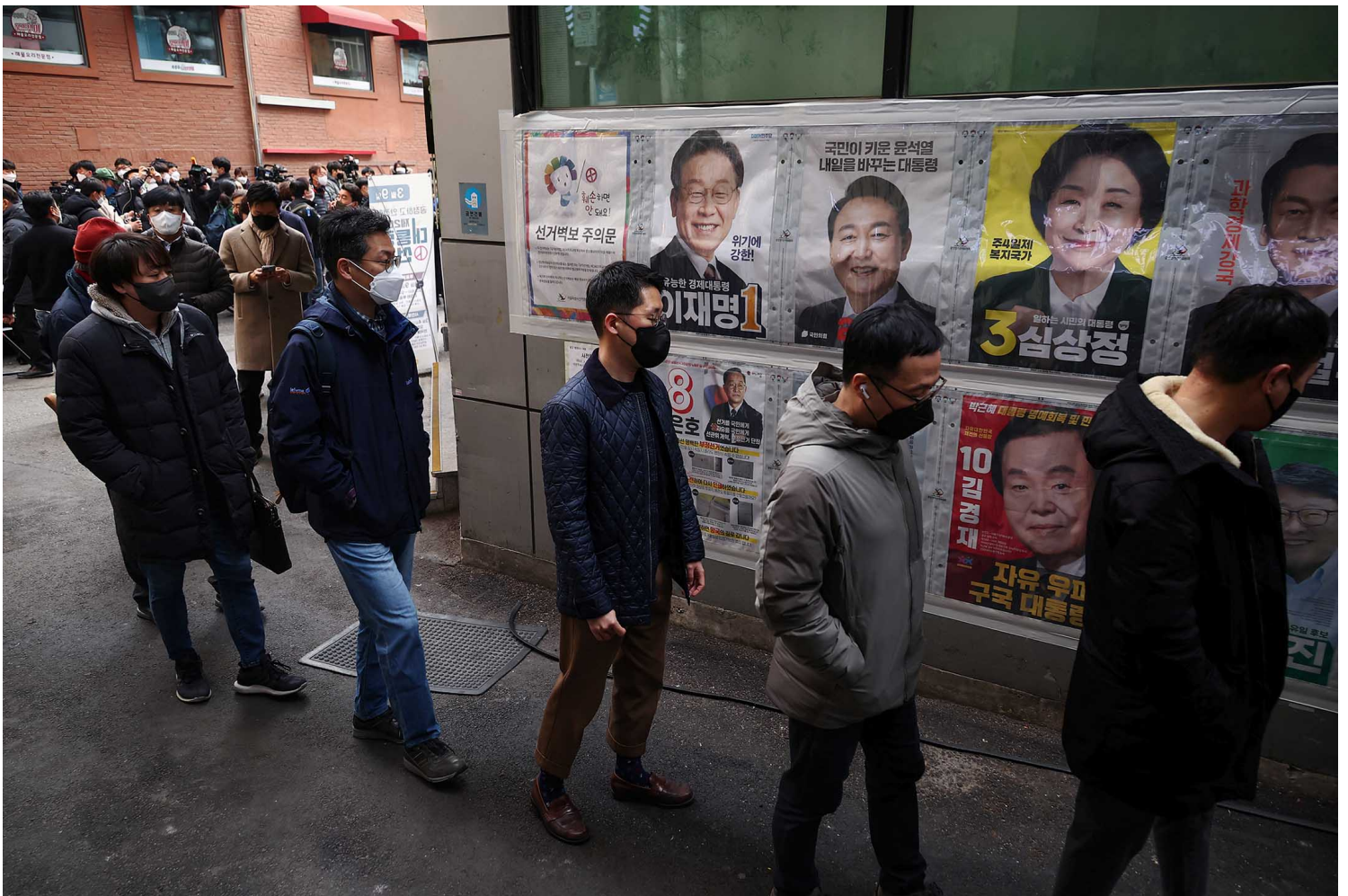
2022年3月4日，韩国首尔的一个投票站，人们站在总统大选候选人的海报前排队投票。

特约撰稿人 陈倩婷 端传媒实习生 黄奕邦 发自伦敦、新加坡 | 2022-03-05