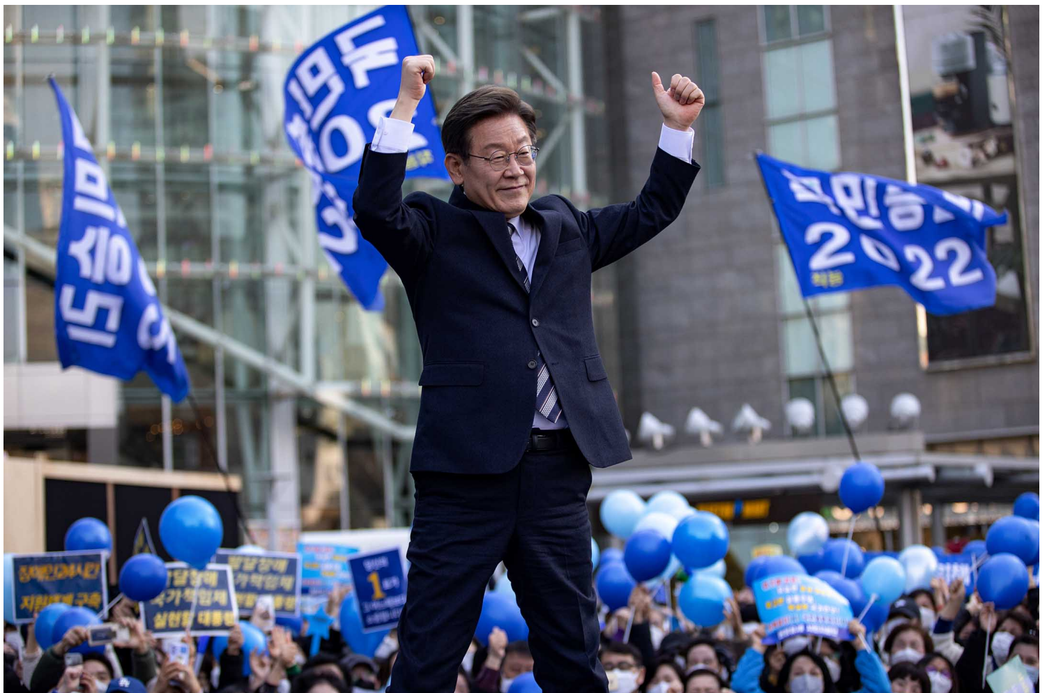
2022年3月3日，共同民主党总统选举候选人李在明于首尔参加竞选活动。

在大选前夕，端传媒整理了六个韩国大选的关键看点，尝试解答读者对这场“最呕心的大选”可能存在的疑问。明日（3月8日），端传媒将刊出一篇评论，重点讨论今次大选中的性别争议。