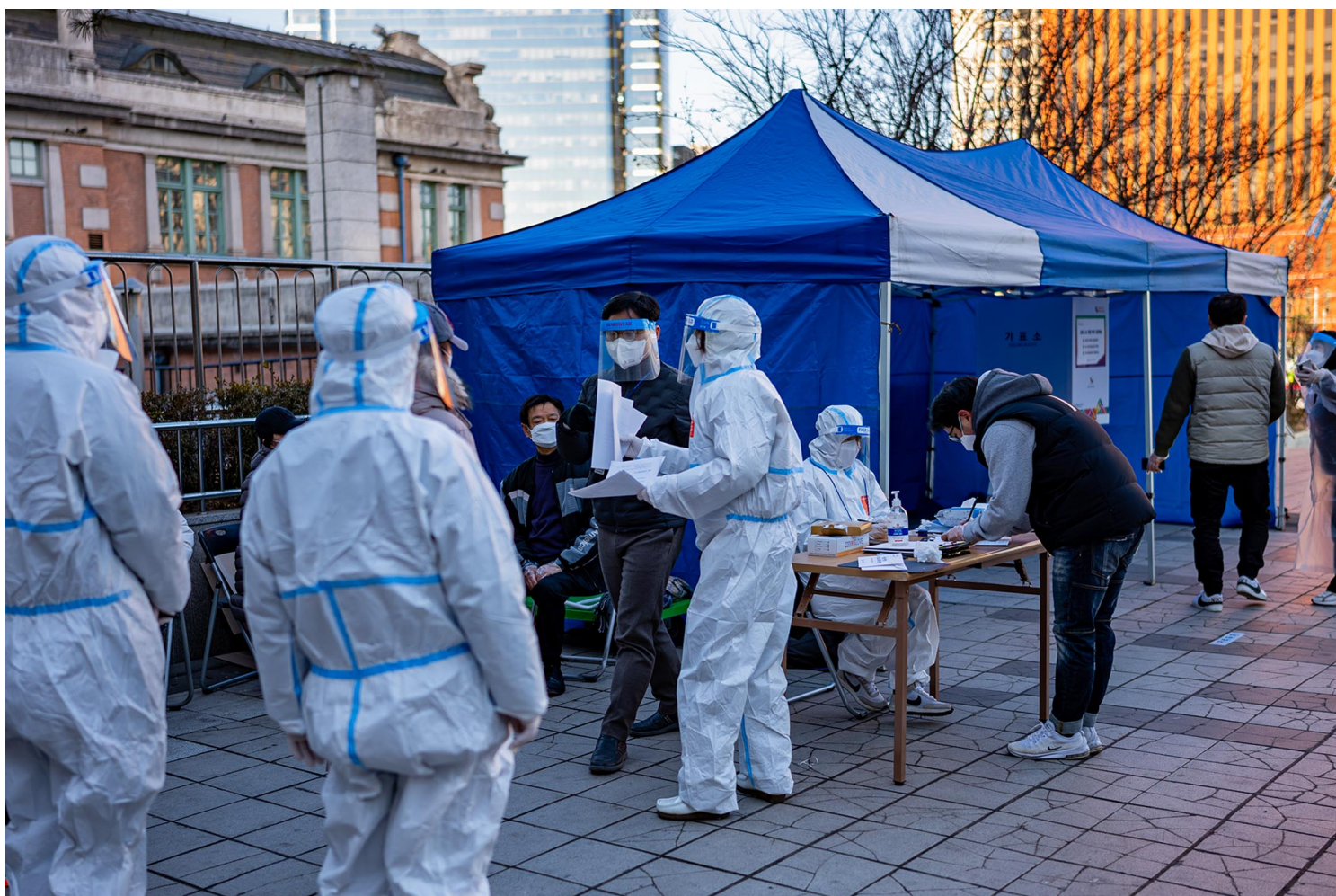
2022年3月5日，韩国首尔总统选举投票，选民到投票站投票。