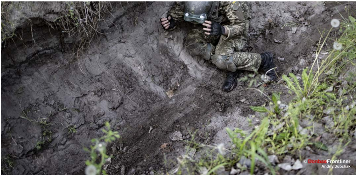
训练第二天，有个培训生恐慌发作。