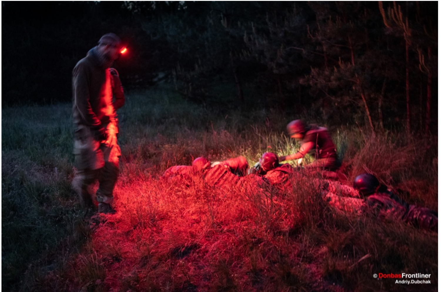
学员接受夜间压力训练期。

每期训练营都有一个不同的名字，这一期叫做“随机作战部队”，之前的一期叫“不承诺，不辩解”。培训结束后，参与者往往在社交网络上建立群组，有时会持续好几年保持联系。