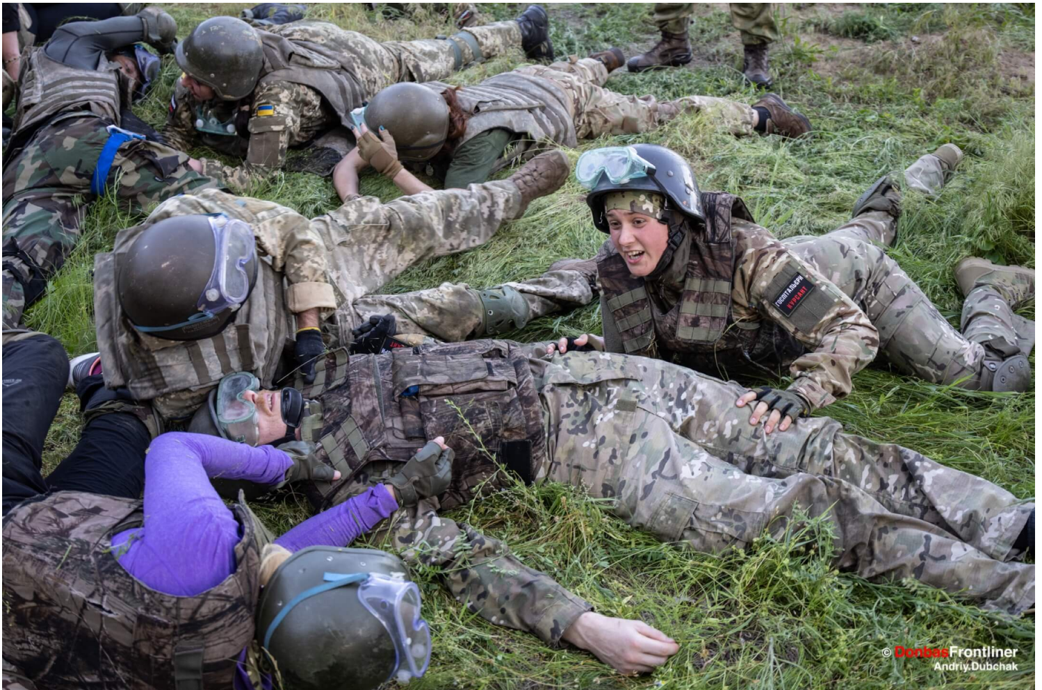
“医院骑士”急救员（代号Vuzlyk）在疏散演习中。

“医院骑士”是一个由志愿者组成的乌克兰医疗营队，俄罗斯入侵乌克兰以来，“医院骑士”的急救员们仍然活跃在战斗前线救死扶伤。