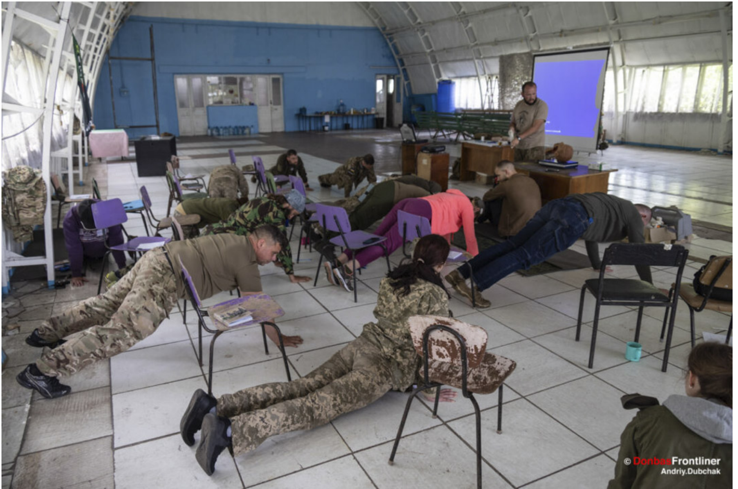
培训生在做平板撑。