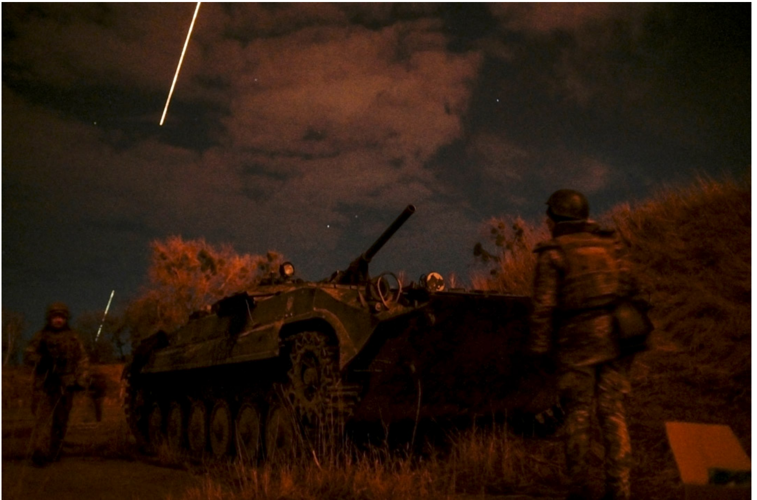
2022年2月27日，乌克兰基辅的军事空军基地。

曾在美国国家安全会议主掌俄国事务的杰佛瑞·艾德蒙兹 (Jeffrey Edmonds)，也在接受美国公共广播电台 (NPR) 的专访时指出，俄军的“空降任务执行后，支援部队并没有跟上，军用车队也只是开进乌克兰、中了埋伏，而后勤也没有跟上。他们虽然被训练来进行现代战争调动，却没有真的在实践。”