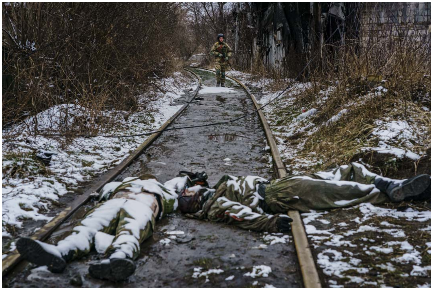
2022年3月1日，乌克兰伊尔平郊区，一名乌克兰士兵从铁路上回来，经过俄罗斯士兵的尸体，在那里曾与俄军发生激战。

乌克兰国防部长列兹尼科夫 (Oleksiy Reznikov) 估算 ，俄国一共在乌克兰周围部署了约15万名士兵。乌克兰总统泽伦斯基，则认为入侵乌国的兵力达20万人，坦克数量则达2,840台，为乌克兰的三倍。