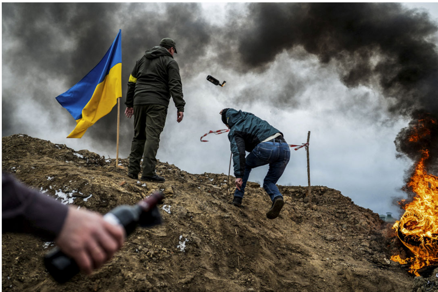
2022年3月1日，乌克兰日托米尔，随著俄罗斯继续入侵乌克兰，一名平民训练投掷燃烧弹来保卫这座城市。

加列耶夫指出，俄国士兵参军的主要动机，通常是为了取得国家配发的公寓，这些士兵常常来自底层；然而一但阵亡，取得配房的目的也就不可能实现了，因此一旦战争变得比想像中危险，或是受伤或阵亡的可能性提高了，想继续吸引年轻人投入战场也会变得更加困难。