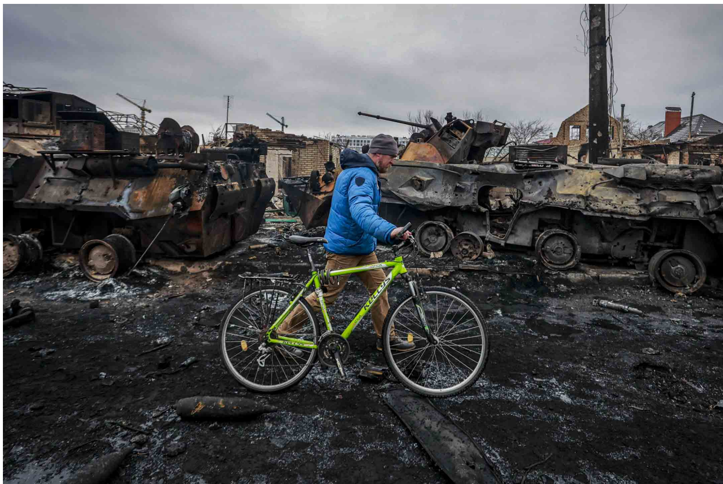
2022年3月1日，乌克兰首都基辅附近的布查 (Bucha)，一名男子走过俄罗斯军用车辆的残骸。